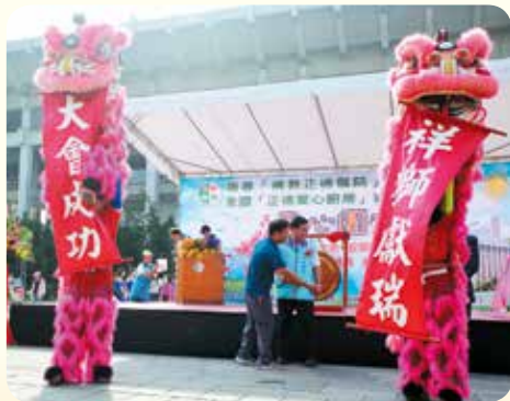
▲大榮中學祥獅獻瑞慶祝大會成功圓滿。