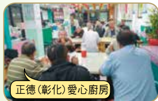
正德(彰化)愛心廚房

請大家發心加入愛心廚房會員或建房委員，共襄善舉 廣濟全國各地貧困民眾飲食，福德無量