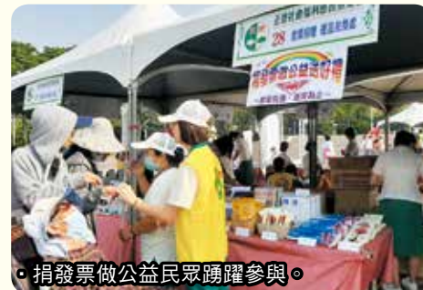
◦捐發票做公益民眾踴躍參與。