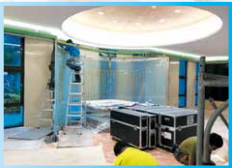
▲大廳佛像玻璃背牆施工