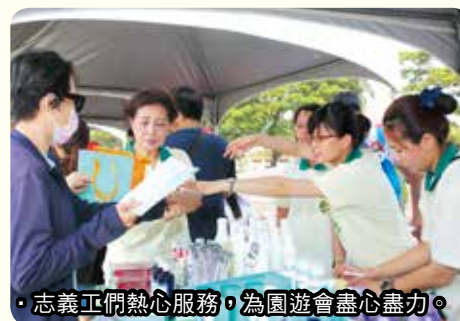
◦志義正們熱心服務，為園遊會盡心盡力。