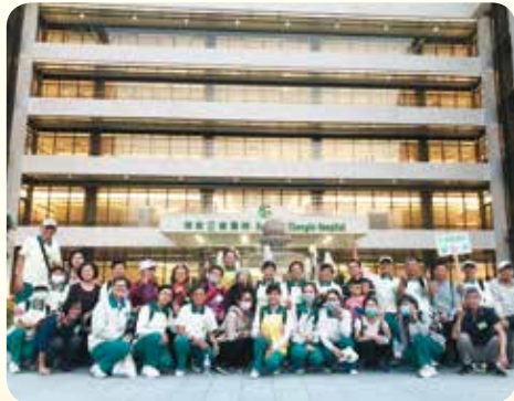
▲佛教正德醫院醫療大樓前合影，留下珍貴鏡頭。