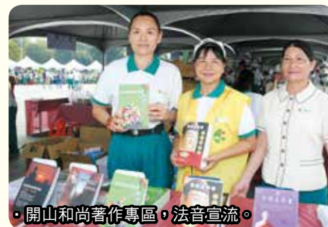
◦開山和尚著作專區，法音宣流。