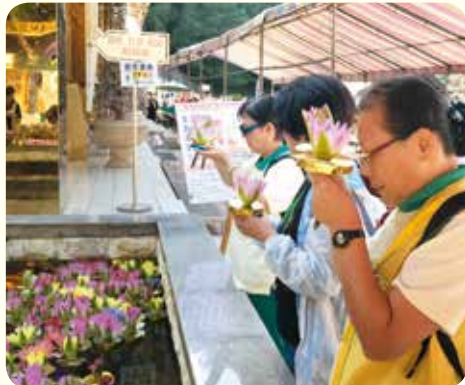
▲請花供佛，供養外在諸佛，也供養自性佛。