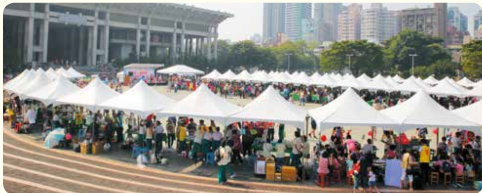
▲高雄總院園遊會於高雄文化中心熱鬧登場。