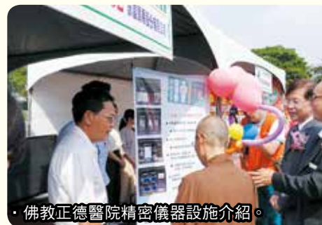
◦佛教正德醫院精密儀器設施介紹。