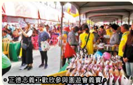
正德志義正歡欣參與園遊會義賣。