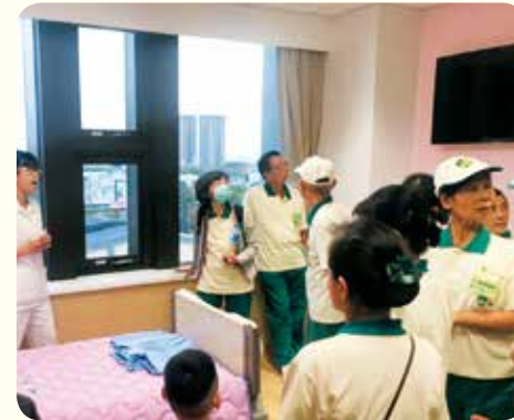
▲參訪貼心完善的病房規劃，處處流露和尚對住院病人及家屬的慈悲與溫暖。