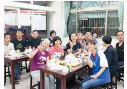
· 院生品嚐享用美味的素食漢堡。

本次活動由呂居士在餐車上現做素食漢堡，新竹愛心廚房亦準備愛心便當、水果及礦泉水連同漢堡，由志義工分送食客、信眾。另邀請華光社會福利基金會，一起附設芥子社區生活持服務中心學員，於愛心廚房享用現做素食漢堡。華光為新竹分院長期捐助的慈善團體，係來自匈牙利的耶