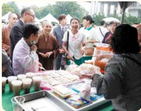
▲演音法師親臨各攤位嘉勉與會攤商之發心。