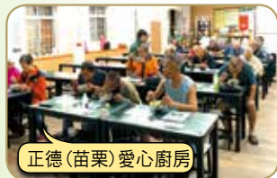
正德(苗栗)愛心廚房