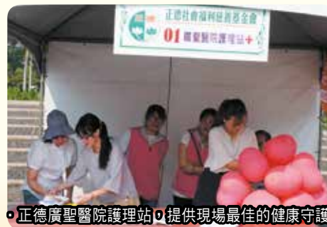
◦正德廣聖醫院護理站，提供現場最佳的健康守護。