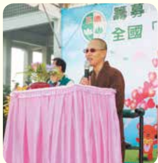
▲演音法師慈悲開示：正德設立醫院及愛心廚房意義，籲大眾發心護持，共行大愛。