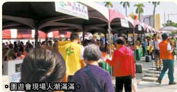
園遊會現場人潮滿滿。

籌募「佛教正德醫院」建院基金暨「正德愛心廚房」救濟饑民基金愛心園遊會-- 108.11.03 新營分院 --- 地點：台南市新營文化中心音樂廳