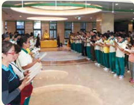
▲大眾持誦大悲咒迴向醫院落成順利無障礙。