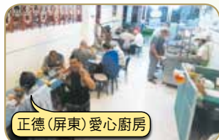
正德(屏東)愛心廚房