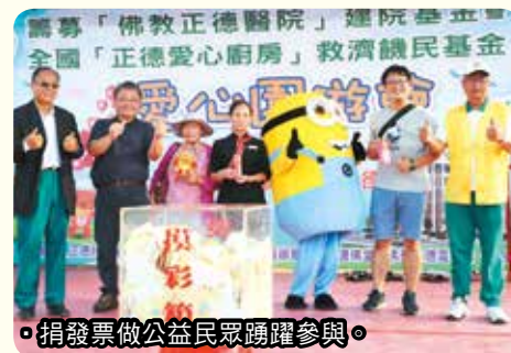
◦捐發票做公益民眾踴躍參與。