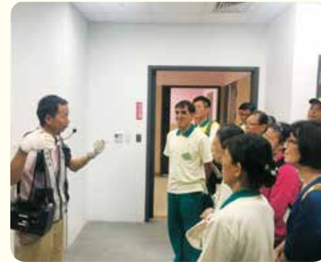
▲工務所副主任帶領大眾參訪醫療大樓各樓層設施及簡介。