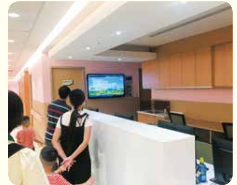
▲守護病人的醫療護理站。