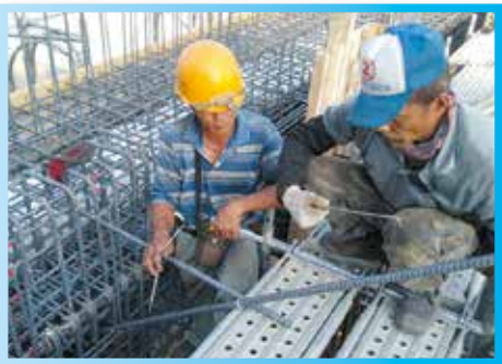
▲行政大樓4樓頂版鋼筋綁紮