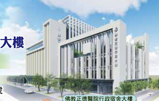
佛教正德醫院行政宿舍大樓