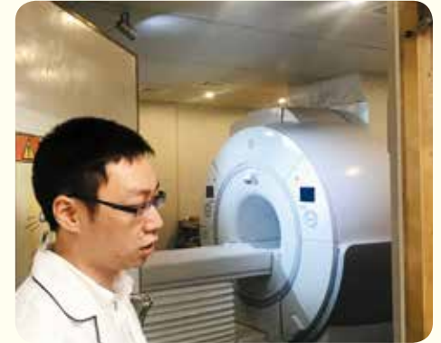
▲精密的MRI磁振造影掃描儀已安置完成。