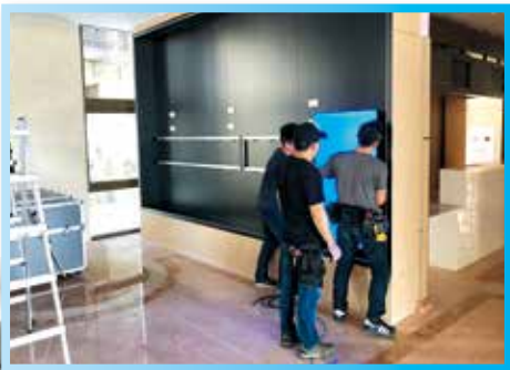
▲1樓大廳多媒牆設備安裝