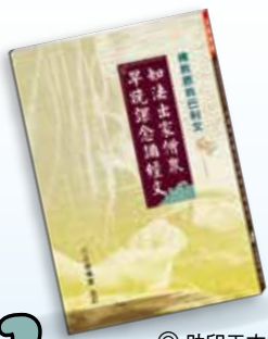
◎ 助印工本費，每本100元

常律老和尚長年深入經藏，始察漢傳《大藏經》相較原始佛典，出入甚多、疑點重重。諸多不合邏輯之記載，有悖佛教真實教義，誤導佛子。遂傾注心血編纂佛教原典巴利文《如法出家僧眾早晚課念誦經文》，還原真正佛所教示之如法課誦儀軌，一改數十年來佛門制式課誦經文，堪稱教界創舉，彌足珍貴。