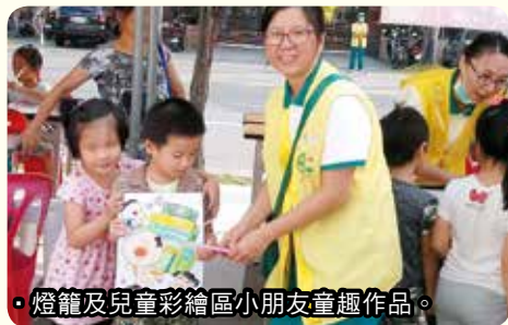
燈籠及兒童彩繪區小朋友童趣作品。