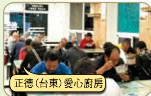
正德(台東)愛心廚房