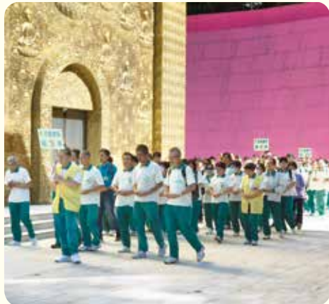
▲虔心朝禮大佛，繞佛三匝，圓滿朝山功德。