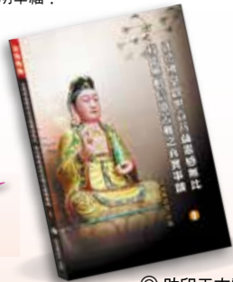
◎ 助印工本費，每本100元

觀世音菩薩慈悲聞聲救苦的點滴事蹟，長期深植人心，普為民間信仰及依怙。正德佛堂乃觀世音菩薩慈悲化現的道場，長期救度無數眾生，遠離諸苦，釋疑解難，遠近馳名，藉由本書諸多真人實事的現身說法，將見證佛法奧妙不可思議的力量，讓您對學佛之路更具信心，人生更光明幸福！