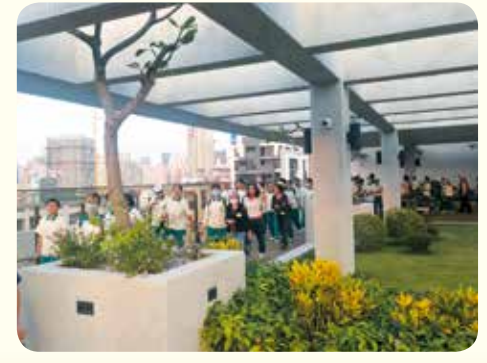
▲六樓精心規劃的空中花園，是一處匠心獨具，充滿綠能的療癒磁場。