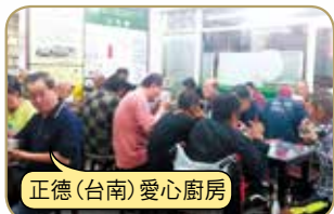
正德(台南)愛心廚房