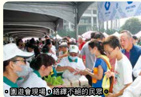
◦園遊會現場，絡繹不絕的民眾。