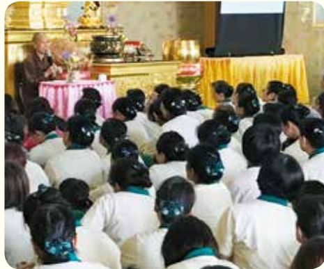
▲演音法師慈悲開示，把握因緣，即時行善。