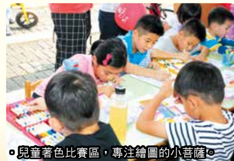
◦兒童著色比賽區，專注繪圖的小菩薩。