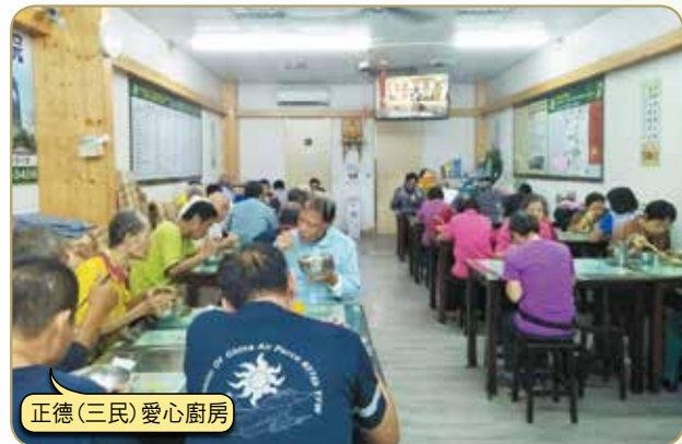
正德(三民)愛心廚房