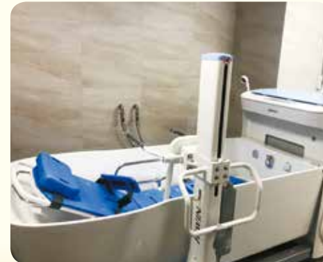
▲為行動不便的病人者貼心準備的佰萬元洗澡機。