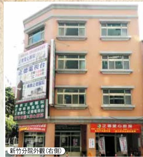
新竹分院外觀(右側)