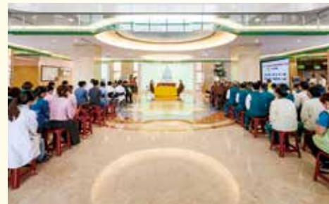
▲法師帶領全體與會人員持誦藥師咒迴向。