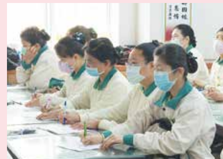
▲苗栗愛心廚房在陳師兄用心的帶領下，利用有限資源，跳脫既有模式，創造愛心廚房更多的可能，讓無數食客身心受益，也為愛心廚房樹立了最佳經營典範。