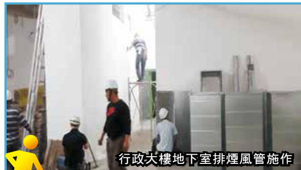
行政大樓地下室排煙風管施作