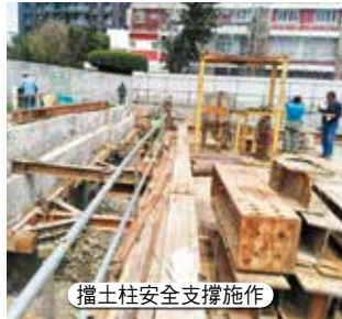
擋土柱安全支撐施作