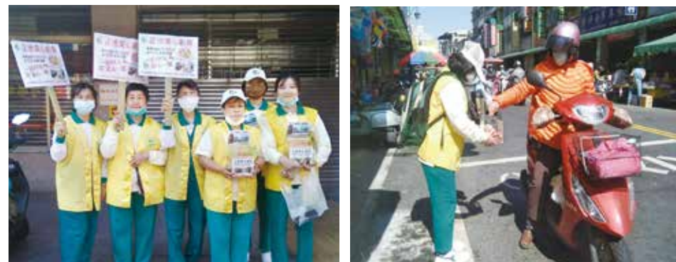
▲鳳山區第二分會·行動勸募活動。