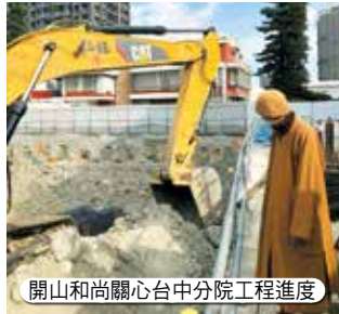
開山和尚關心台中分院工程進度