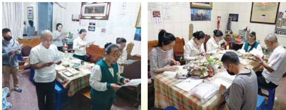
▲分會讀書會，適時充電，提升自我，福慧雙修（仁武分會）