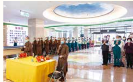
▲前彰化市長溫國銘(右座3)，蒞臨觀禮。