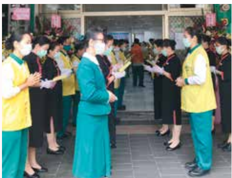
▲大眾齊心恭誦大悲咒，祈活動圓滿順利。