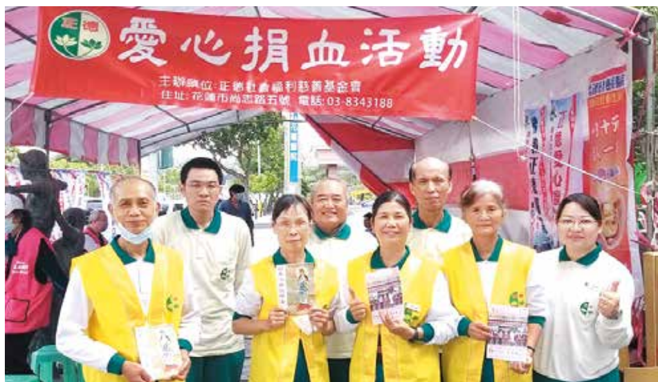
▲花蓮志義工發心參與捐血活動，助人為樂，法喜充滿。