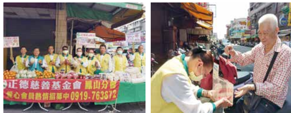
▲鳳山區第一分會·義賣暨行動勸募活動。