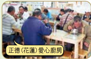
正德(花蓮)愛心廚房