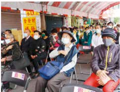
▲永和地區民眾參與愛心廚房開幕實況。