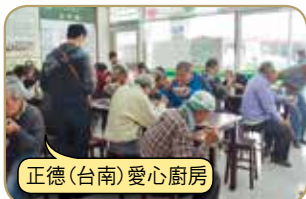
正德(台南)愛心廚房