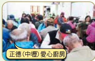
正德(中壢)愛心廚房