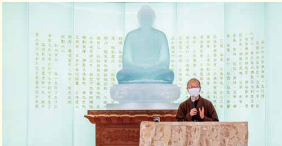
▲演音法師會中慈悲開示，藥師佛發十二大願救度眾生，乃醫院之精神象徵，期勉院內醫護人員學習藥師佛的精神，發慈悲心，醫護眾生遠離病苦。

109年3月20日佛教正德醫院藥師佛像安座大典在正德僧眾帶領下，全體醫護人員及中區志義工皆蒞臨觀禮，共同見證，圓滿安座儀式。