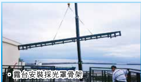
露台安裝採光罩骨架