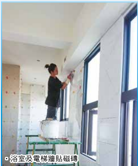
浴室及電梯牆貼磁磚