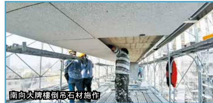
南向大牌樓倒吊石材施作