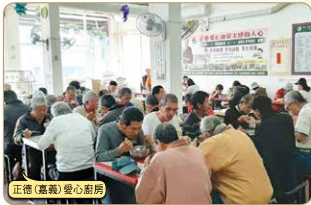
正德(嘉義)愛心廚房