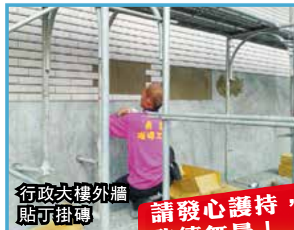
行政大樓外牆貼可掛磚