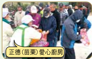
正德(苗栗)愛心廚房

請大家發心加入愛心廚房會員或建房委員，共襄善舉，廣濟全國各地貧困民眾飲食，福德無！