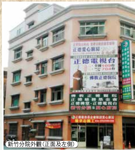
新竹分院外觀(正面及左側)