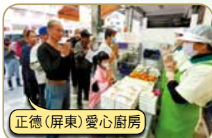
正德(屏東)愛心廚房