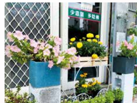
▲苗栗愛心廚房環境結合「慈善」與「藝術」巧妙連結，成功綠化為打卡景點，為民眾搭起一道走進正德世界的橋樑。