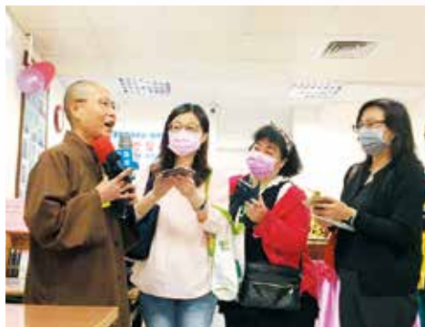
▲演音法師會後接受媒體採訪，闡述開山老和尚設置愛心廚房的悲心大願。