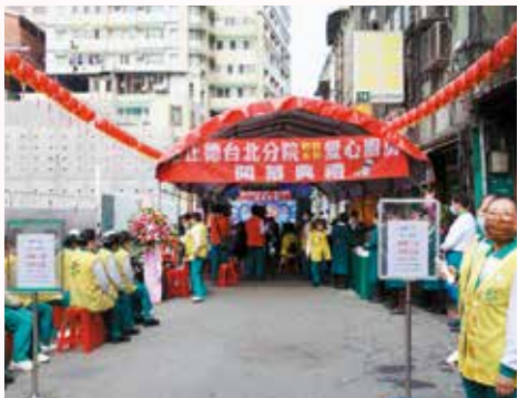
▲台北分院全體志義工同心協力圓滿開幕活動。

正德全國第20家愛心廚房於永和區隆重開幕，正德社會福利慈善基金會再度創新善舉，化愛心為具體行動，持續嘉惠更多弱勢族群。