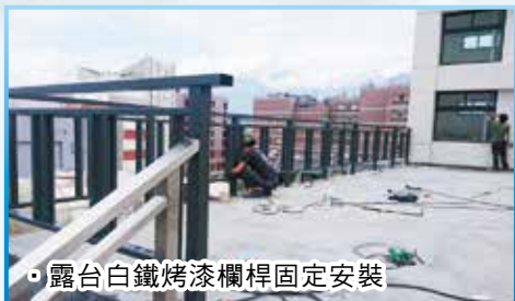
露台白鐵烤漆欄桿固定安裝