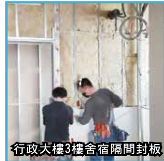
行政大樓3樓宿舍宿間封板