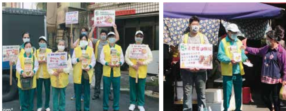
▲大寮分會·行動勸募活動。