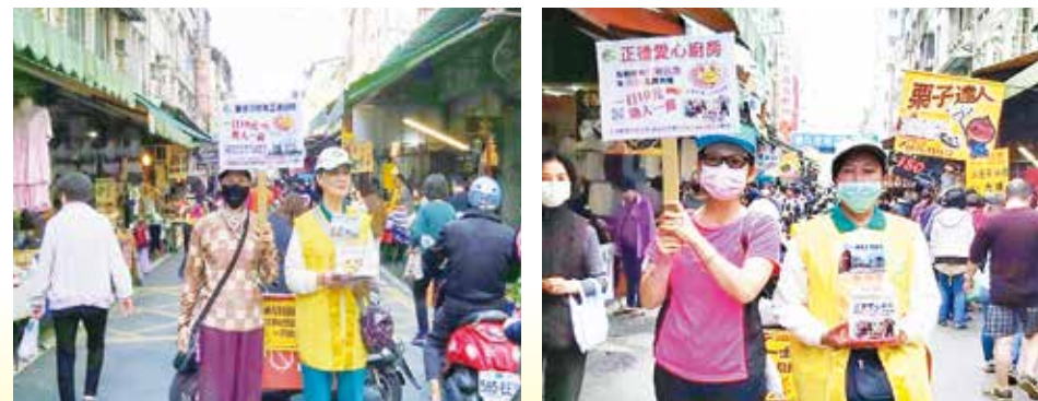
▲三民西區第二分會·行動勸募活動。