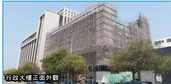
行政大樓正面外觀