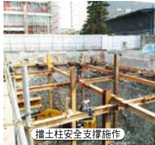
擋土柱安全支撐施作