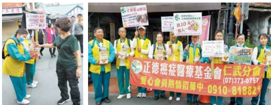
▲仁武分會·旗山老街行動勸募活動。