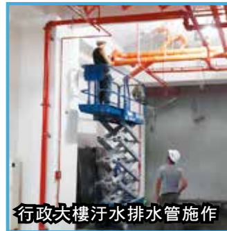
行政大樓地下室排水管施作