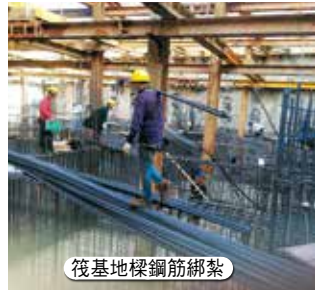
筏基地樑鋼筋綁紮