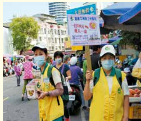
▲三民東一分會--陽明市場勸募。