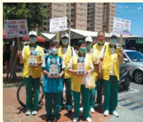
▲鳳山二分會--鳳山工協市場勸募。