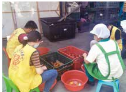
▲學生們至愛心廚房協助備菜及檢菜。