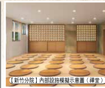
【新竹分院】內部設施模擬示意圖(禪堂)