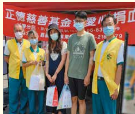
▲新營分院嘉義捐血活動。