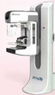
Tomo 3D數位乳房X光機 儀器費用：980萬元