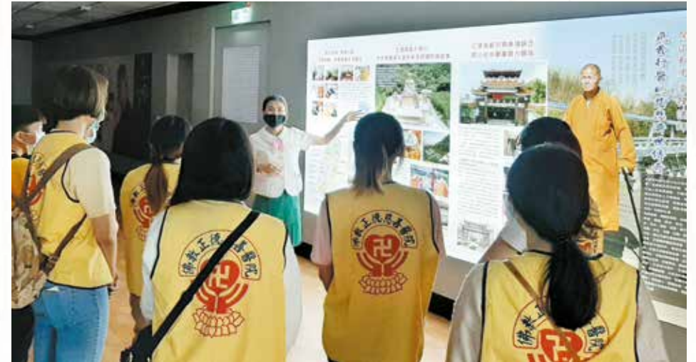
▲慈善專員為學生們介紹開山和尚行菩薩道的行宜及認識正德五大志業，期許學生能作個「手心向下」有愛心、熱心助人，成為別人的貴人。