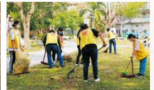
◀學生們宜蘭社區公園環境清潔公益活動。