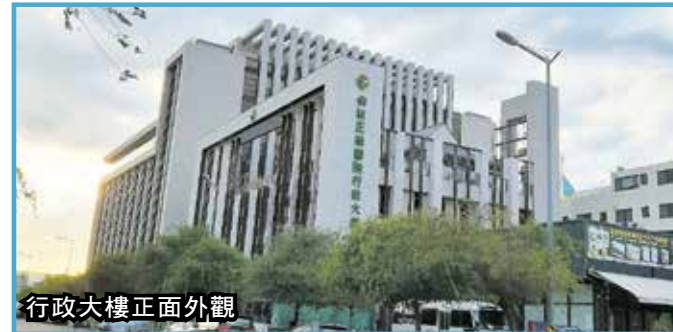
行政大樓正面外觀