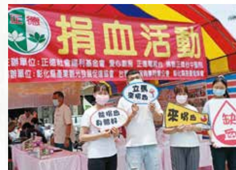
▲學生參與正德彰化分院捐血公益活動。