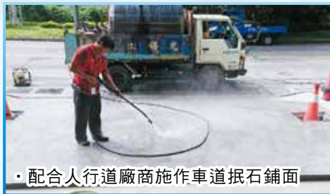
配合人行道廠商施作車道抵石鋪面