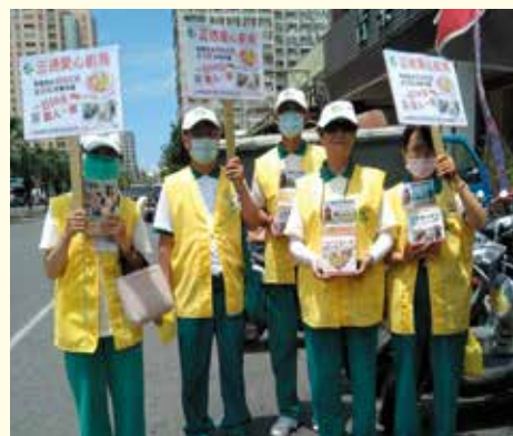
▲前鎮保泰市場勸募。