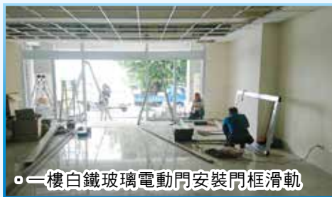
一樓白鐵玻璃電動門安裝門框滑軌