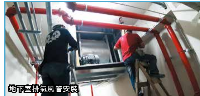
地下室排氣風管安裝