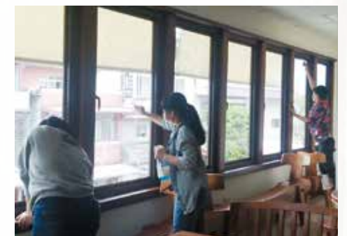
▲學生參與花蓮分院環境整理。