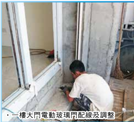
一樓大門電動玻璃門配線及調整