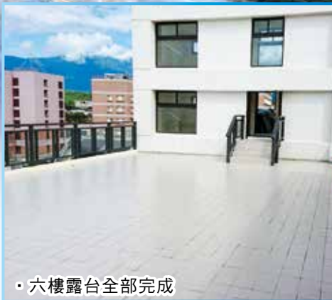
六樓露台全部完成