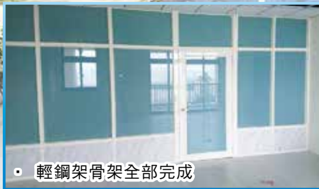
輕鋼架骨架全部完成