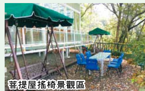
菩提屋搖椅景觀區

為讓大眾同享功德，相關設施特開放認捐，成就三寶道場，廣度眾生學佛，敬請踴躍護持，功德無量！