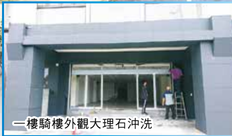
一樓騎樓外觀大理石沖洗