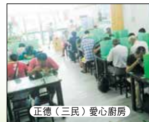
正德(三民)愛心廚房