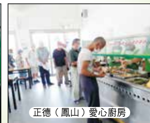
正德(鳳山)愛心廚房