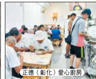
正德(彰化)愛心廚房