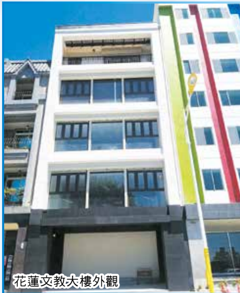
花蓮文教大樓外觀