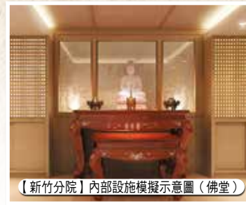
【新竹分院】內部設施模擬示意圖(佛堂)