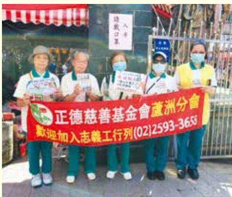
▲蘆洲分會-社區市場義賣勸募活動