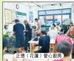
正德(花蓮)愛心廚房