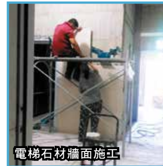
電梯石材牆面施工