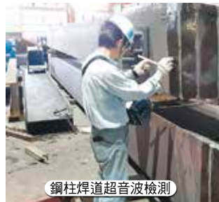
鋼柱焊道超音波檢測