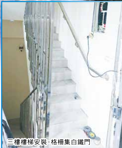
三樓樓梯安裝-格柵集白鐵門