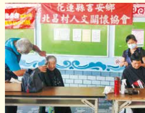
▲花蓮分院--6月27日於北昌福境宮舉辦義剪，量血糖、血壓社區關懷活動。