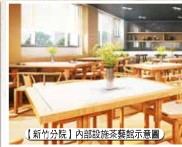
【新竹分院】內部設施茶藝館示意圖