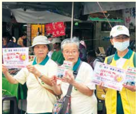
▲內湖分會-社區市場義賣勸募活動