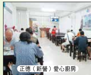
正德(新營)愛心廚房