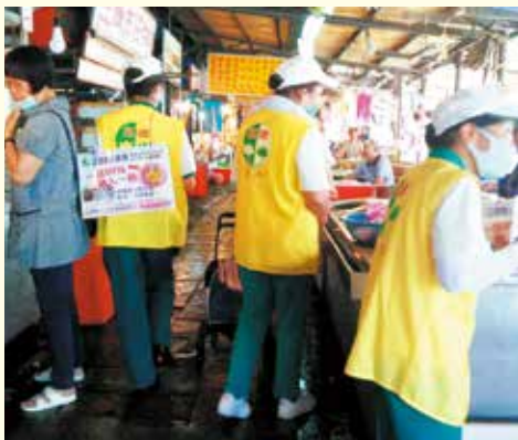
▲萬華分會-社區市場義賣勸募活動