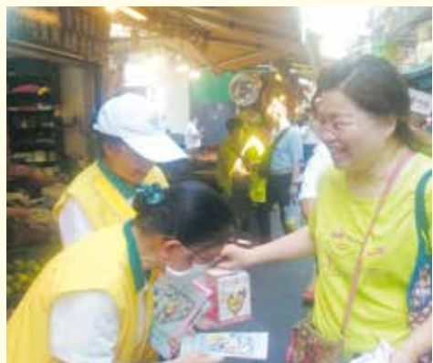
▲土城分會-社區市場義賣勸募活動