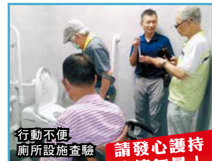
行動不便 廁所設施查驗