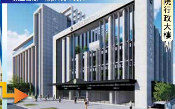
正德醫院行政大樓