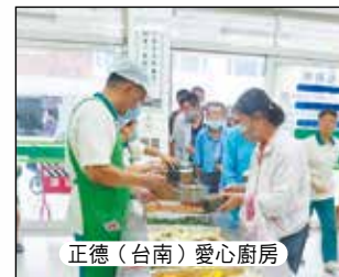
正德(台南)愛心廚房