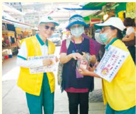
▲景美分會-社區市場義賣勸募活動