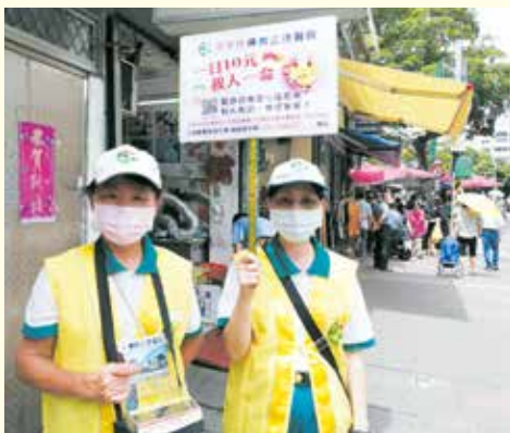
▲大同分會-社區市場義賣勸募活動