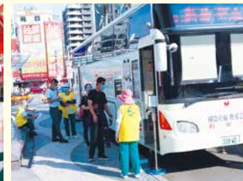
▲宜蘭分院--6月28日於羅東轉運站對面(傳藝路三段239號前休閒廣場)舉辦捐血活動。