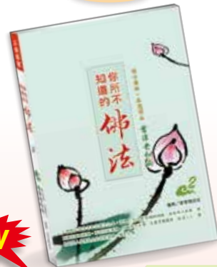
◎助印工本費，每本100元