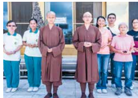
▲新度沙彌尼與俗家親人合影留念。

身為新戒沙彌尼的家屬，兩位母親難掩內心悸動，在晶瑩的淚光中，目送孩子走出不一樣的人生之路；終究這是孩子們自己的抉擇，也是對諸佛菩薩的承諾！也為佛門再添生力軍，給予深摯的祝福。回首培育女兒的歷程與親子共度的美好時光，當下的感受雖悲欣交集，胸臆間卻充滿無盡的法喜與殊榮。