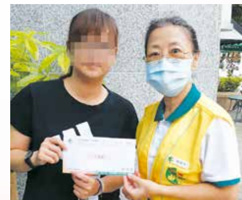
▲台北分院-關懷吳師姐，單親罹慢性病無法工作。