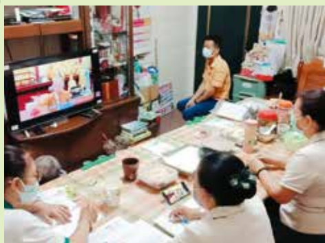
▲仁武分會-精進讀書會聆聽和尚開示。