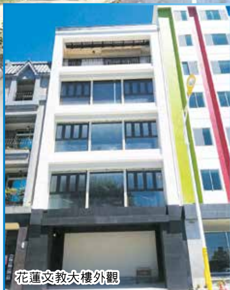
花蓮文教大樓外觀