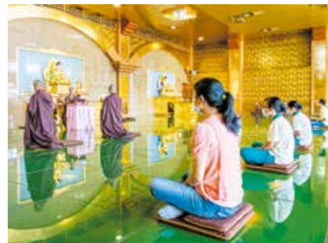
▲授戒儀式家屬全程觀禮祝福。

在眾人齊誦「南無本師釋迦牟尼佛」的聖號中，引領兩位新戒出班落髮；過程象徵著煩惱已除、俗情已斷，更代表願斷一切惡、願行一切善，誓願成就無上菩提。剃度師勉勵戒子精進修學佛法、荷擔救濟眾生的責任，永不退失道心、辜負師長期待，違背自己求剃的初衷。