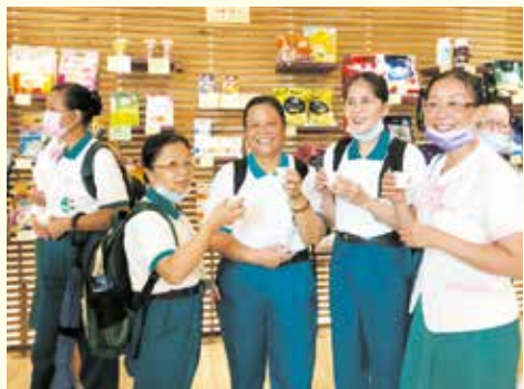
▲聯誼活動之一-參觀「3點1刻故事館」，體驗臺灣『新茶文化』，感受另一種休閒風情。