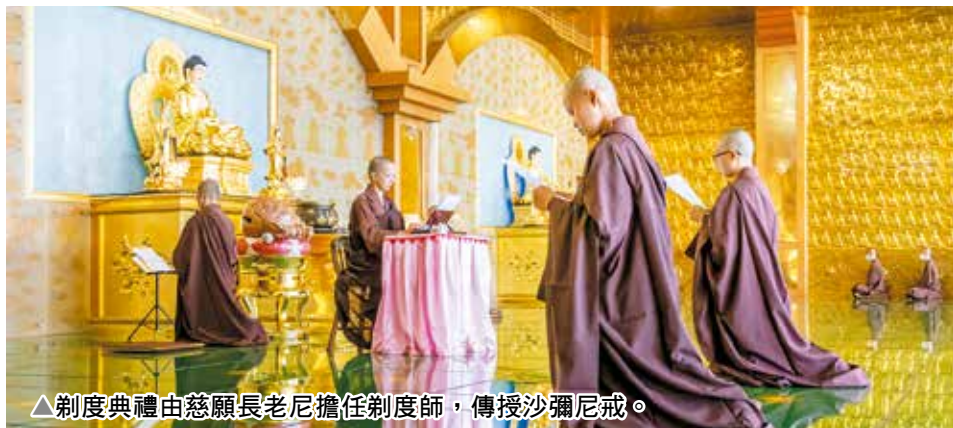
△剃度典禮由慈願長老尼擔任剃度師，傳授沙彌尼戒。