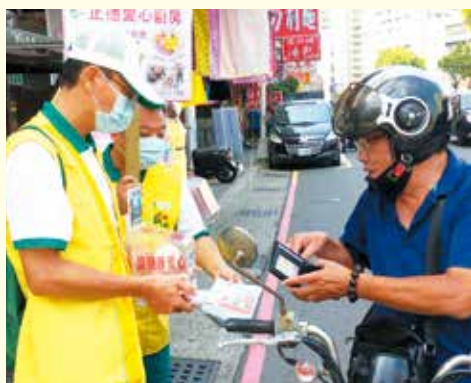
▲大寮分會-二苓市場募款活動給人福田。