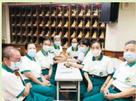
▲台北分院-讀書會小組分享討論。