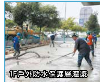
1F戶外防水保護層灌漿