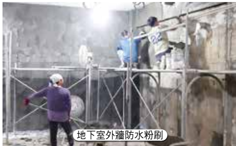
地下室外牆防水粉刷