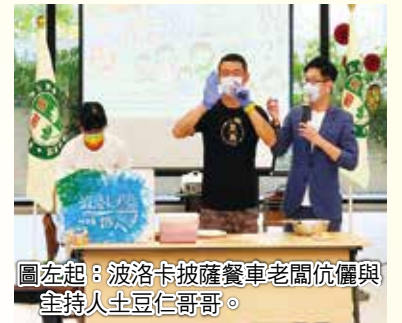
圖左起：波洛卡披薩餐車老闆伉儷與主持人土豆仁哥哥。