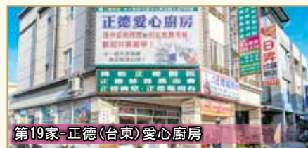
第19家-正德(台東)愛心廚房