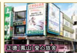
正德(鳳山)愛心旅舍