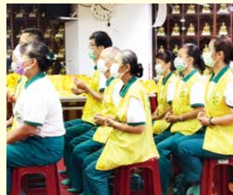
▲台北分院-正德每月助念課程，為能渡亡者往生西方極樂世界，志義工用心上課演練。