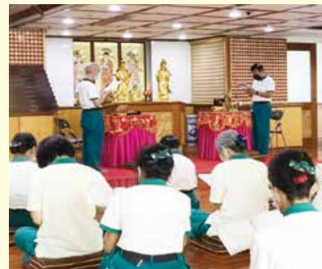
▲台北分院-梵唄班學員專注聆聽法師上課並實地演練。