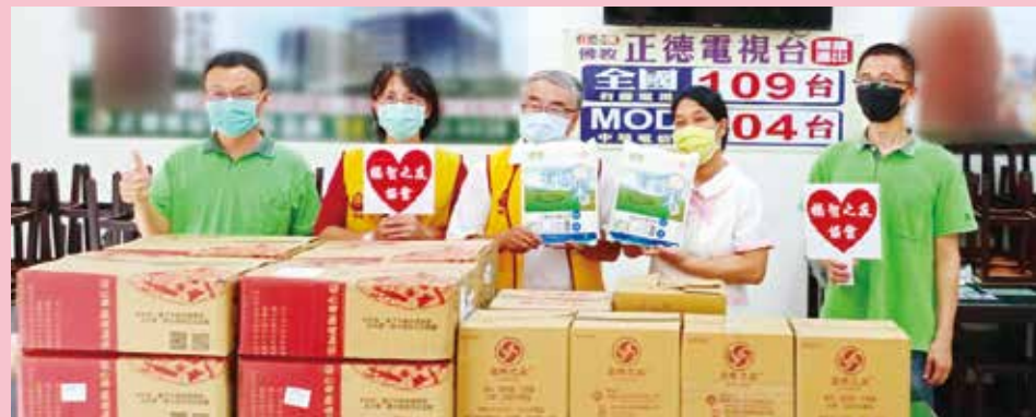
▲福智之友-捐贈物資與正德(斗六)愛心廚房。