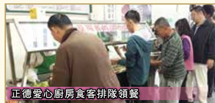
正德愛心廚房食客排隊領餐