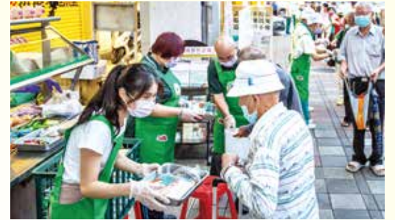
▲蔓蔓與妙緣素食餐車沈老闆伉儷及正德愛廚志義工發放物資關懷弱勢民眾。

吳執行長表示，愛心旅舍目前入住人數已逾 6 成，在寒冬時甚至排隊登記人數過多而無法全數收容，因此，慈悲的開山和尚發願要蓋建 20 層愛心旅舍大樓來救助更多街友。也希望透過本次活動的安排，讓這些弱勢族群們的需求讓社會大眾看見，一起來正視與協助，也期待有更多企業團體與民眾一起共襄善舉。感謝協辦單位「公益團體暨活動報導平台」的全力支持與報導，一起為弱勢族群發聲，讓社會更美好，功德無量！