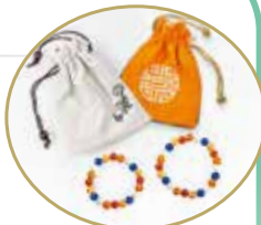
(圖一) 備註：袋子隨機結緣