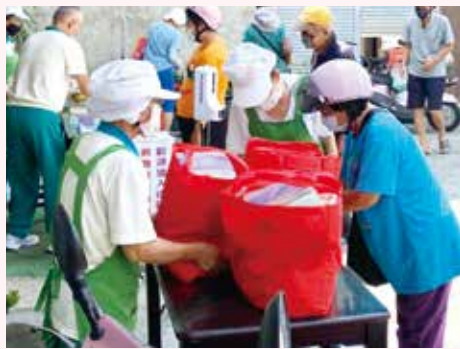
▲在秋涼季節正德愛心廚房，關懷弱勢民眾及街友中秋物資發放。在中秋佳節前夕，適時的伸出溫暖的手，給予需要幫助的人。