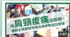
向肩頸痠痛說掰掰~佛教正德醫院物理治療師教您怎麼做

本系列相關醫學保健資訊，歡迎鏈結、 訂閱 佛教正德醫院YouTube影音頻道，讓我們一起守護您的健康。