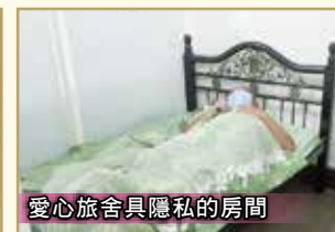
愛心旅舍具隱私的房間