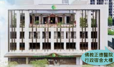
佛教正德醫院行政宿舍大樓