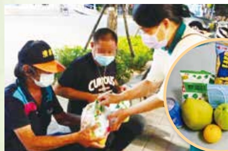
◎ 正德愛心廚房在中秋節夕，準備月餅及柚子等物資予愛廚食客及街友結緣。