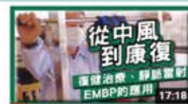
從中風到康復-復健治療、靜脈雷射、EMBP的應用

透過淺顯易懂的醫學知識分享，讓我們從「看病」變成「看健康」，希望廣大眾生都能遠離病痛，享受健康的身體與人生。