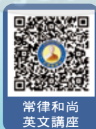
常律和尚 英文講座