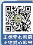
正德愛心廚房 正德愛心旅舍