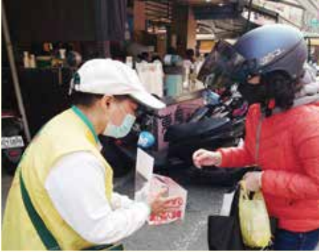
▲ 苓雅分會-社區市場行動勸募。