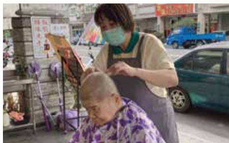
▲ 正德愛心廚房不定期舉辦義剪活動。