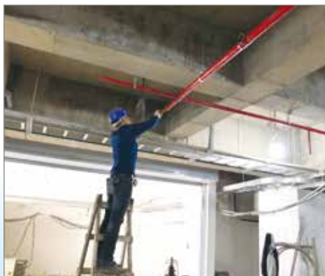
▲地下室消防管安裝