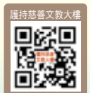
護持慈善文教大樓

銀行匯款或ATM轉帳：台灣土地銀行青年分行 銀行代號005 帳號038001015009 或至郵局劃撥帳號42150839 戶名：正德佛堂