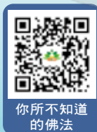
你所不知道的 佛法