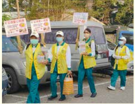
▲ 大社分會-大社果菜市場行動勸募及發善書。