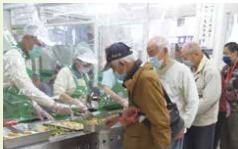
▲ 配合政府防疫規定，愛心廚房適時開放食客入內放用餐。