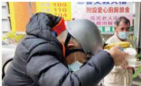
▲ 食客抱持感恩心領餐、用餐。