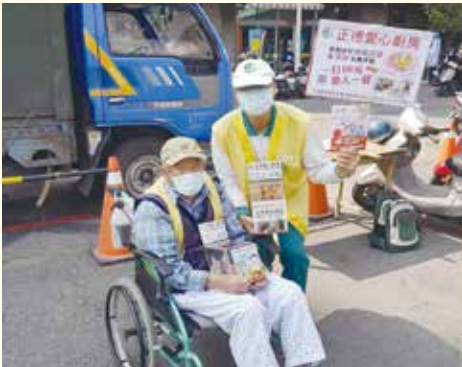
▲ 前鎮分會-行動不便的義工不畏辛勞，發心參與勸募，精神令人讚嘆！