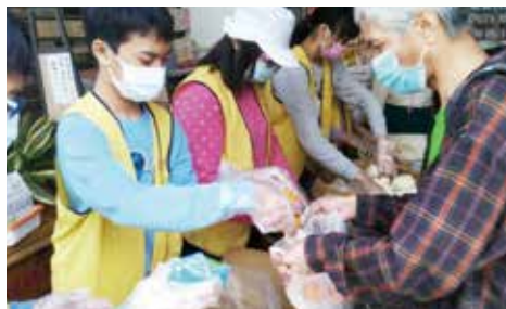
▲ 小菩薩參與義工工作，助人為樂。