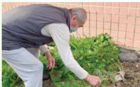
▲ 食客發心整理愛心廚房環境。