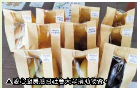
▲ 愛心廚房感召社會大眾捐助物資。

◎「正德愛心廚房」不僅是供餐解飢且兼具社會教化功能，創造了良善的循環—食客用餐之餘懷抱感恩心行作愛心廚房義工整理環境，小朋友們也在家長鼓勵下，在愛心廚房作義工，體悟助人為樂精神。