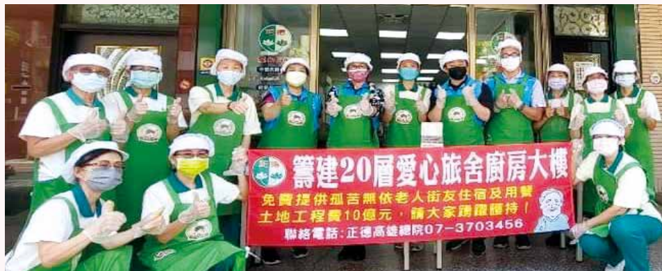
▲高雄市爭議調處職業工會熱心公益，愛心不落人後，於三民愛心廚房體驗半日志工，行善助人。