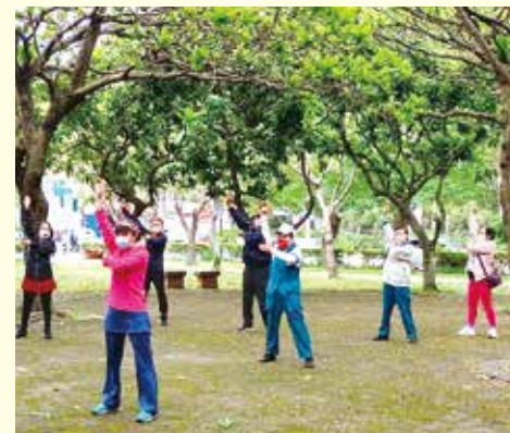
▲新竹分院-長青老人會，戶外律動課程，身體動一動增健康。