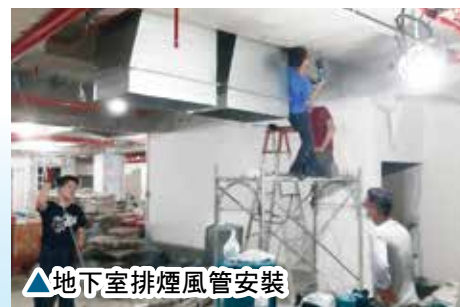
▲地下室排煙風管安裝