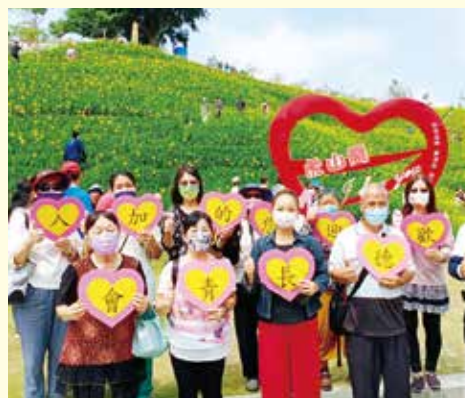
▲彰化分院-長青老人會，虎山巖賞花採果行，健走怡情樂無窮。