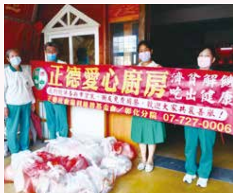
▲彰化愛心廚房關懷彰化縣芳苑鄉四村低收入戶，愛心物資發放。