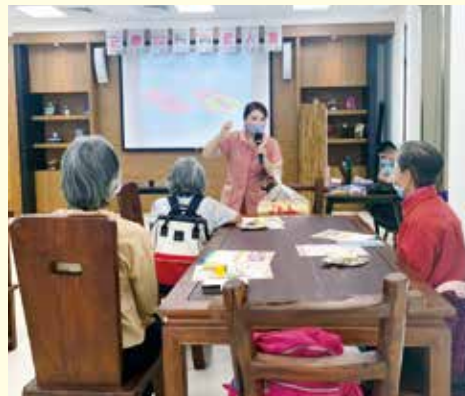
▲台中分院-長青老人會，如何吃出營養-健康管理講座。