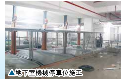
▲地下室機械停車位施工