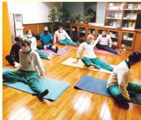
▲台北分院-長青老人會，氣功瑜珈班-柔軟筋骨增強免疫，健康加分。