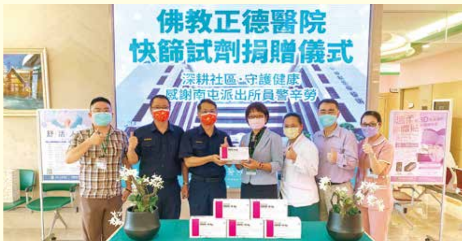
▲佛教正德醫院關心疫情期間辛苦的值勤員警，特捐贈南屯派出所快篩試劑，守護第一線人民保姆的安全與健康，共為台灣抗疫盡分心力！