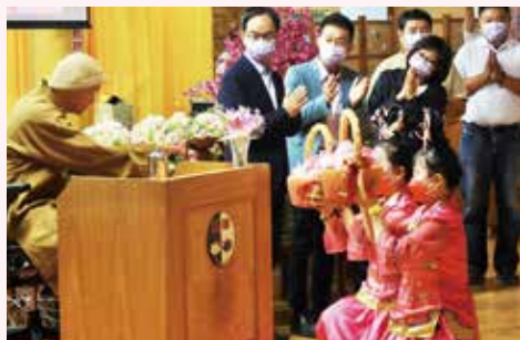
▲南區弟子-百鳥朝鳳賀壽誕-志義工獻上壽桃恭祝 老和尚福壽綿長，圓滿佛道。