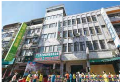
▲志工歡喜心迎接(草屯)愛心廚房開幕。