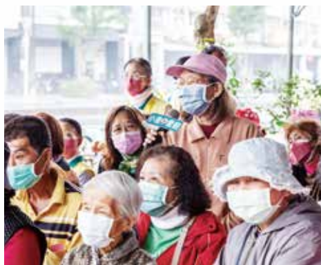
▲ 正德(小港)愛心廚房開幕，雖逢寒流來襲 ▲ 又風雨交加，然而現場民眾仍熱情參與活動，全程觀禮，一起見證小港愛廚開幕。