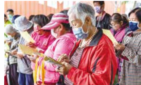
▲祈福儀式大眾專注誠心共同誦經祈願愛心廚房營運無礙，利益更多有需要的民眾。