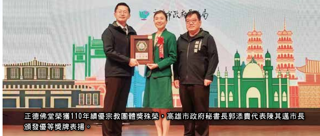
正德佛堂榮獲110年績優宗教團體獎殊榮，高雄市政府秘書長郭添貴代表陳其邁市長頒發優等獎牌表揚。