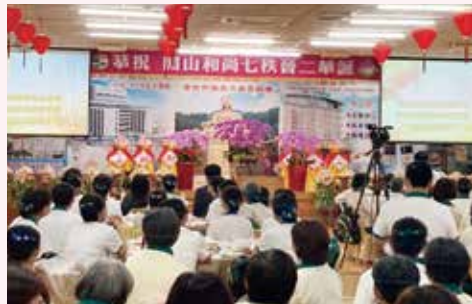
▲南區弟子及信眾歡欣齊聚，恭祝 老和尚72華誕生日快樂！