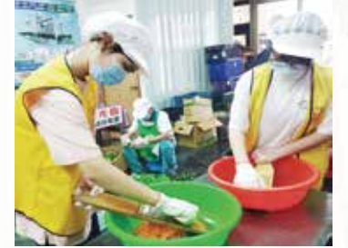
▲學生參與愛廚備餐。

對我而言，正德就像一座崇高的大山，為我阻擋了人生中的風風雨雨；正德像一座橋樑，協助我通向光明的彼岸。感謝正德的協助，我期許自己將來也想變得與你一樣偉大！