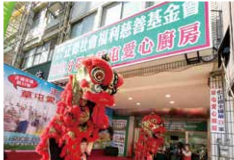
▲祥獅獻瑞賀草屯愛心廚房開幕。