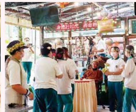
▲宜花東弟子-帶動唱表演，歡慶 老和尚72華誕。