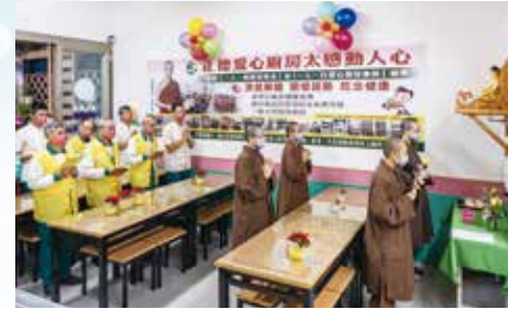
▲正德(小港)愛心廚房開幕啟用祈福儀式