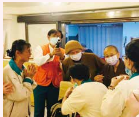
▲北區弟子-虔心祝福 老和尚心想事成。