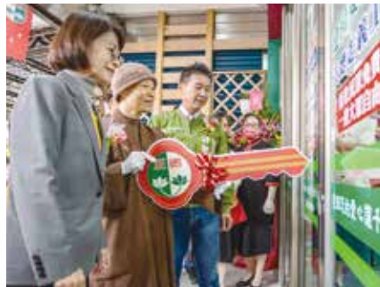
▲演音法師主持愛心廚房啟用開鎖儀式，與會貴賓共同參與見證。