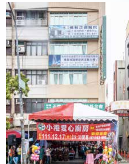
▲ 第24家--- 正德(小港)愛心廚房 地址：高雄市小港區 沿海一路87號

上午10:00，活動正式揭開序幕。首先由主持人介紹常律老和尚創建正德歷史沿革、正德愛心廚房、佛教城蓋建計劃；接下來邀請小港醫院營養師蒞臨現場，親自指導大眾健康蔬食觀念。最後進行有獎徵答，並頒發精美獎品，場面熱絡。與會來賓紛紛表達對基金會弘法利生的肯定，並感謝常律法師及基金會對大高雄地