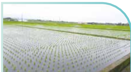
▲正德愛心有機農場實景-圖2