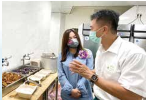
▲愛心廚房督導為馬文君立委介紹愛廚理念及設施。