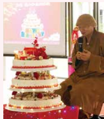
▲中區弟子-歡聚台中行政大樓，為 老和尚72華誕獻上深深的祝福。