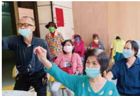
▲開幕活動--問與答，民眾互動熱絡。