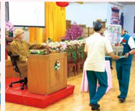
▲南區弟子-志義工獻上手作佛教城建築模型作為生日賀禮，祝福 老和尚宏願早成。