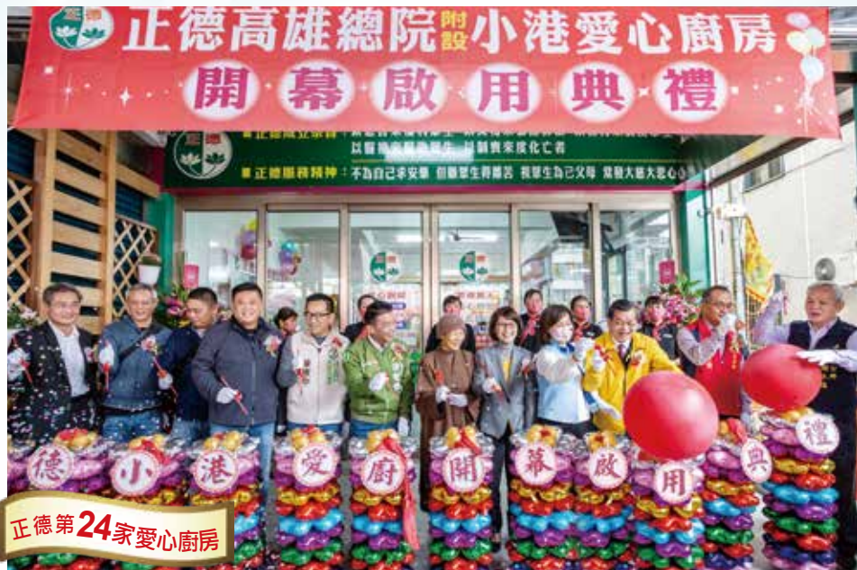
揭幕貴賓自左起：高雄市政府市政顧問蘇致榮(左4)、陳致中市議員(左5)、許智傑立委(左6)、正德基金會董事長演音法師(中)、高雄市議會曾麗燕議長(右5)、陳麗娜市議員(右4)、旗津區羅長安區長(右2)、小港區謝水福區長等(右1)。