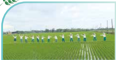
▲正德愛心有機農場實景-圖1

正德愛心有機農場地點：宜蘭縣三星鄉大洲村大排五路 正德愛心有機農場面積：規畫為五甲農地1萬5000坪 目前已購置完成面積：約1萬坪