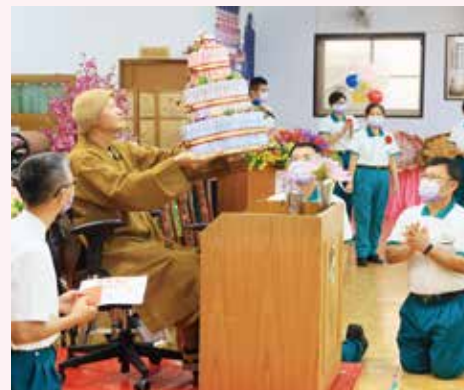
▲南區弟子-獻上精心準備的手作壽糕模型，表達祝賀之意。