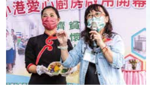
▲小港醫院營養師現場指導大眾健康蔬食觀念。