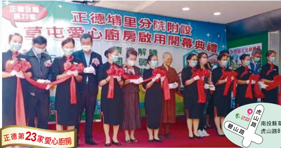
正德第23家愛心廚房