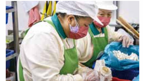
▲志義工們用心專注為(小港)愛心廚房開幕準備美味營養菌菇餐點。

老和尚 常律法師慈悲擘劃興建全球宗教界最高層樓「正德佛教城」，大樓裡包含了「生老病死食衣住行」等等八大民生問題。內部空間，將規劃設置「愛心旅舍」，提供街友老人食宿；並設置「青年愛心宿舍」，提供清寒學生食宿。充分體現「慈善、醫療、文化、教育、制喪、娛樂、體育、住宿、交通」等各種設施，實踐溫馨的正德大家庭之真愛理念。