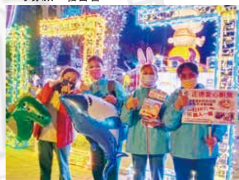
▲彰化分院-志工春節初八燈會行動勸募。