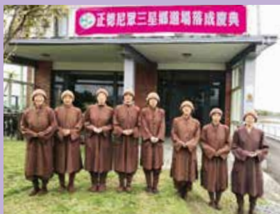
• 正德尼眾三星道場落成啟用。