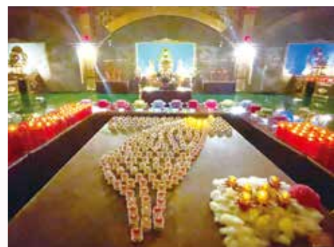
▲為台灣點燈祈福～祈願國泰民安、風調雨順。