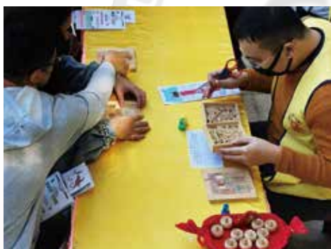
▲新春玩童玩，動動腦六度波羅蜜闖關活動。