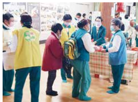
▲高雄總院-新春茶會，信眾歡喜報到。