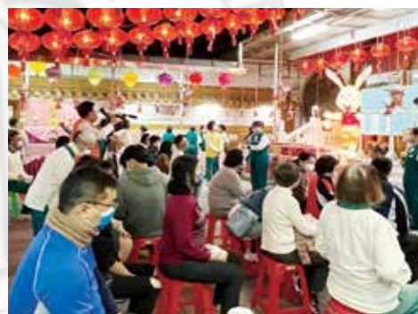
▲元宵猜燈謎活動，大眾踴躍參加。