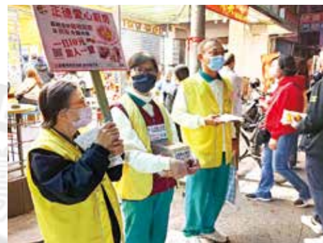
▲高雄總院-志工除夕夜於鳳山天公廟、龍山寺募款、發善書。

正德全國志義工新春期間，自發性發起走春行動勸募，分享佛堂各項新春祈福活動，提供民眾新春種福田機緣，鼓勵布施行善，廣結善緣，散播喜樂。