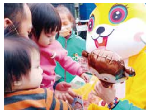
▲彰化分院-志工南投車埕車站行動勸募。