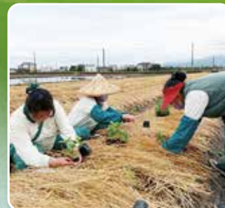
· 正德農耕隊蔬菜種植