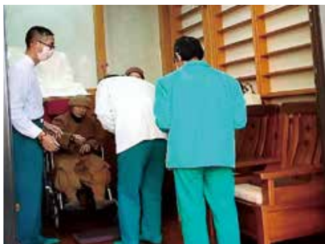
▲新春期間各院志義工及信眾紛紛至大佛山向開山和尚大德拜年，恭祝 老和尚法體康泰。

正德埔里大佛山新春期間舉辦系列活動，結合懷舊古早味主題童玩，勾起大眾兒時美好回憶！超夯玩偶穿梭其間，歡樂有趣；新春見佛大吉大利，佛前點燈照亮光明。