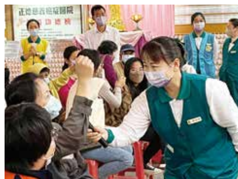
▲元宵猜燈謎，大眾爭相搶答。