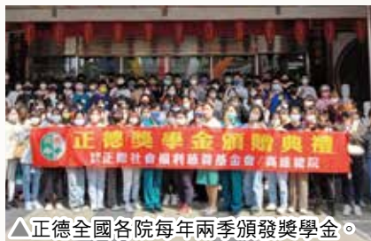
▲正德全國各院每年兩季頒發獎學金。

去年 5 月及 12 月，埔里大佛山舉辦佛教失傳兩千多年「巴利藏三皈五戒大典」。過程依照印度原始佛教儀軌，為大眾親授如理如法的三