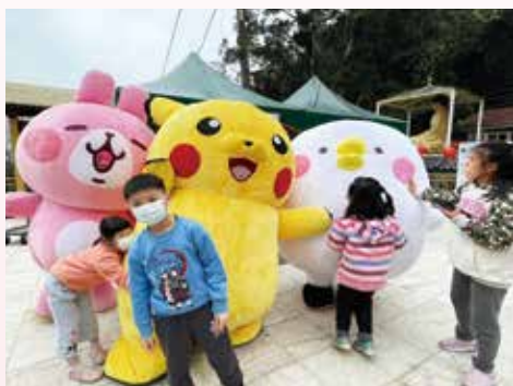
▲卡通布偶逗趣活潑賀歲，小朋友爭相同樂。