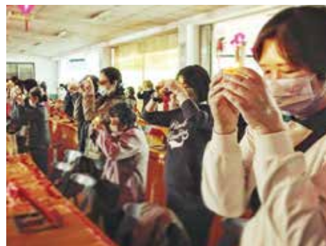
▲與會大眾至誠供燈祈願來年平安吉祥。