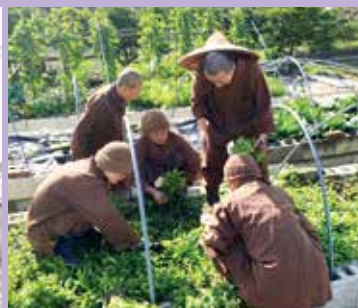
• 尼眾種植有機蔬菜自力自足。