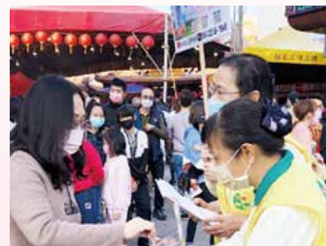
▲台中分院-西屯分會-春節期間街頭行動勸募。