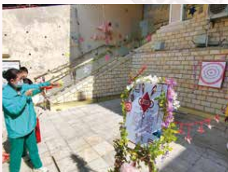
▲新春六度波羅蜜闖關活動～射箭遊戲。