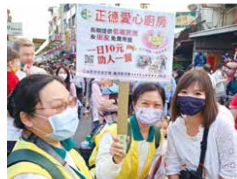
▲旗山分會-大年初一旗山老街募款及發善書。