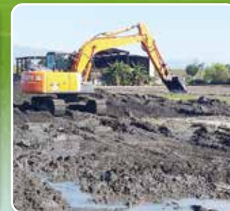
· 農場-種植果樹區整地