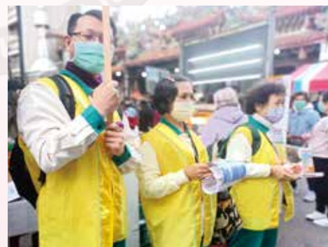
▲台中分院-東區分會-春節期間街頭行動勸募。