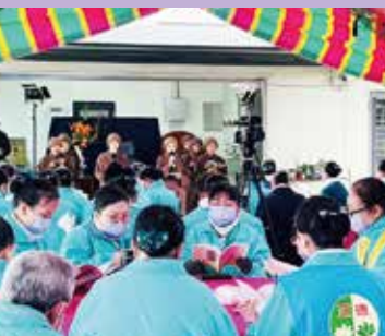
• 三星鄉尼眾道場落成誦經禮讚。