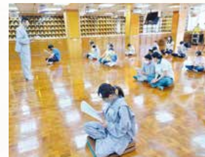
▲兒童巴利藏讀經禪修會

同時，自 7 月份起，「巴利藏成人禪修會」在大眾引頸期盼下正式開班；全國各院「兒童巴利藏讀經禪修會」與「巴利藏兒童讀經班」，也陸續展開。透過讀誦巴利藏真佛經、行禪、淨坐，薰習真佛法的精髓，啟發兒童智慧慈悲與佛性。小菩薩們在輕鬆自在的氣氛學習中，種下菩提幼苗，來日必定開花結果。