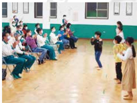
▲高雄總院-小菩薩現場舞蹈表演同樂。