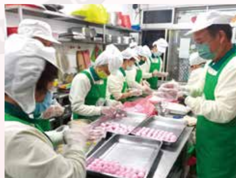
▲廚房組準備應景湯圓與眾結緣。