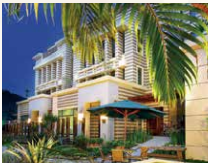
▲埔里~正德朝山會館

和尚一心一意為完成此生最後善願，蓋建「30 層佛教城醫療慈善文教大樓」廣救各地受苦眾生，殫心竭慮、擊劃募款。無奈高雄市近年土地及工程費飆漲，又逢疫情及物價齊漲，募款卻遠不如預期理想，深