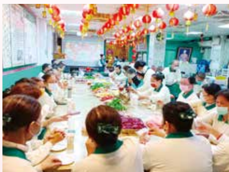
▲彰化分院-新春茶會帶動唱活動，志義工歡聚同慶賀。