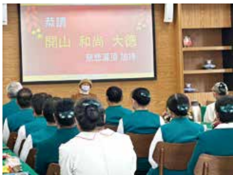
▲和尚大德慈悲與中部各院榮董會長勸委護法隊喝春茶，話家常。

為迎接新的一年，正德全國各院於新年後，分別舉辦新春茶會，以簡單的儀式相聚一堂，大家相見歡，互道恭喜，共為來年道務攜手努力。