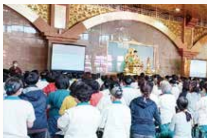
▲大佛山-巴利藏三皈五戒殊勝大典。

皈五戒律儀，正本清源，革新台灣教界長年未能如律如儀的傳統陋習。此為和尚長年深入巴利藏原典研究，盡心竭力思惟探源的心血；因緣殊勝，千載難逢。受持正法戒律，必定能種下解脫生死輪迴道種、來世修行成佛之果！