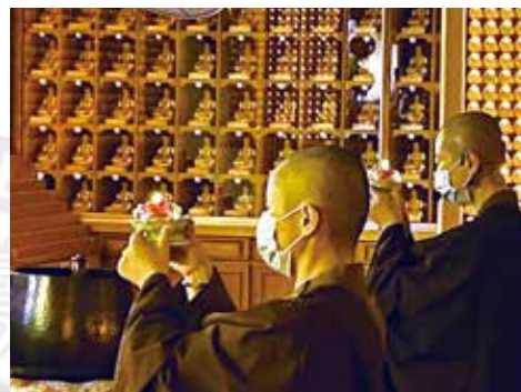
▲莊嚴隆重的元宵上燈祈福法會。

112. 02. 05元宵節，正德全國各院同步舉辦元宵節上燈祈福法會及元宵節猜燈謎、吃湯圓活動，民眾踴躍參與，場面溫馨熱鬧。