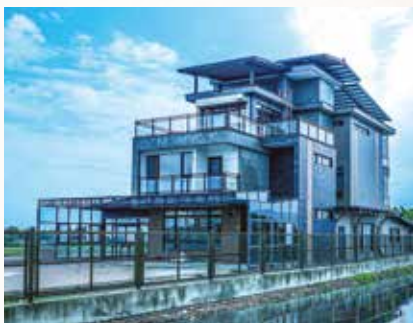
▲宜蘭~正德志工會館

感憂心。原估算土地及工程費為 20 億元，然近日尋覓高雄市内各區土地，每坪地價平均佰萬以上，1000 坪土地款須約 10 億元；而 S.C. 鋼構每一建坪工程費約 20 萬，10,000 建坪蓋建費用約 20 億元，土地及工程費將超過 30 億元。但佛教城大樓募款至今僅 1.8 億元，離 30 億元目標甚遠，不知何時方能購地蓋建？令和尚深感煩惱！希望大眾發心護持募款，期待能早日完成佛教城大業，廣度眾生離苦得樂，功德無量！