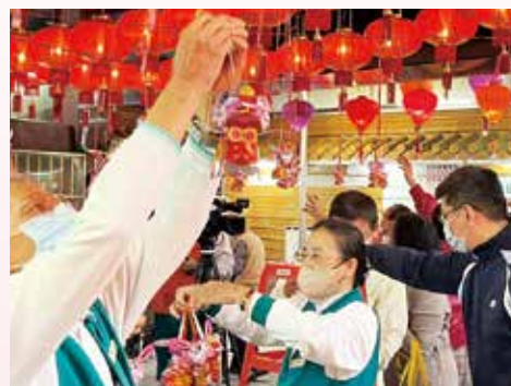
▲可愛兔年造型燈籠與現場小菩薩結緣。