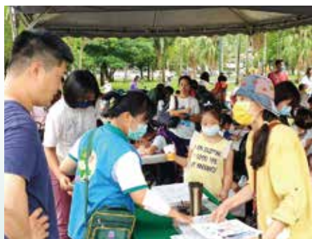
▲家長陪同小朋友參與著色比賽，場面熱絡。