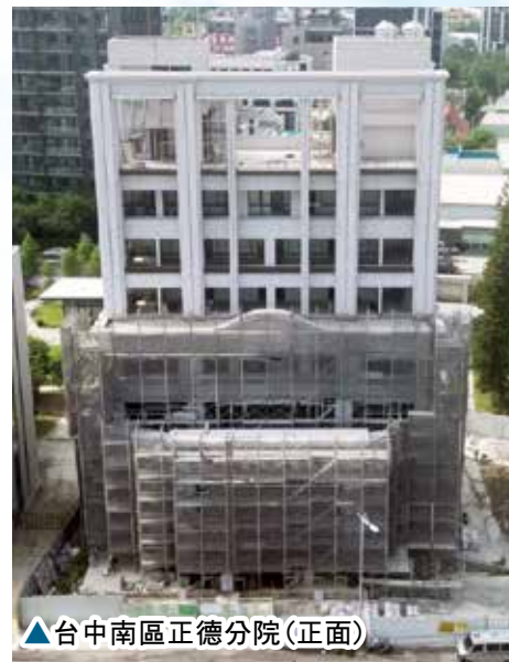
▲台中南區正德分院(正面)