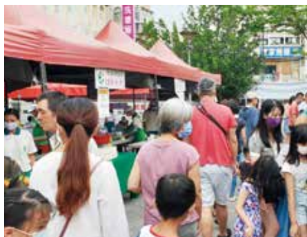
▲園遊會現場民眾扶老攜幼熱情參與。