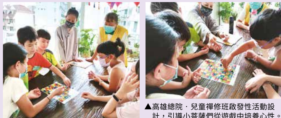
▲高雄總院·兒童禪修班啟發性活動設計，引導小菩薩們從遊戲中培養心性。