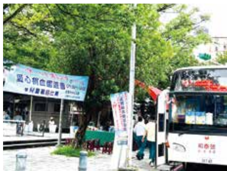
▲愛心園遊會宣導捐血助人，利人又利己，募集熱血、愛心義賣，共襄善事。