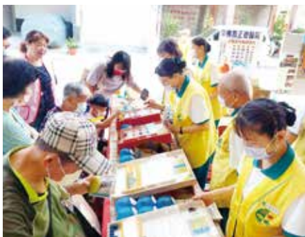
▲彈珠遊戲讓人童心大發，童年回憶樂無窮。