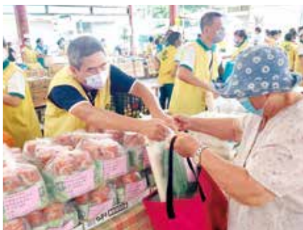
▲園遊會活動，同時發放物資關懷弱勢。