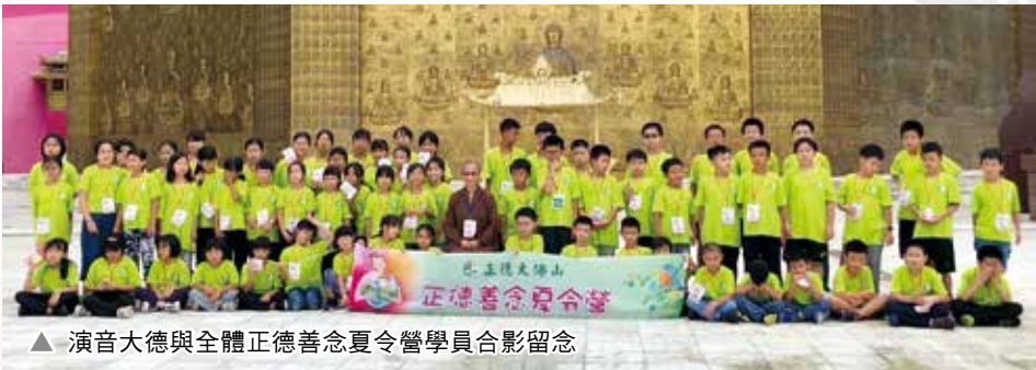
▲ 演音大德與全體正德善念夏令營學員合影留念