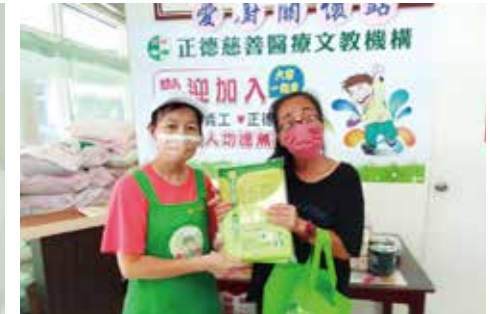
▲羅東愛心廚房-設有愛廚關懷站，物資結緣有需求的民眾。