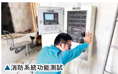
▲消防系統功能測試