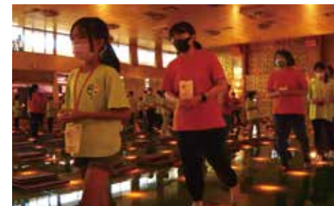
▲晚課-淨心念佛行禪。