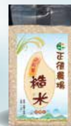
(圖1)正德農場正能量糙米