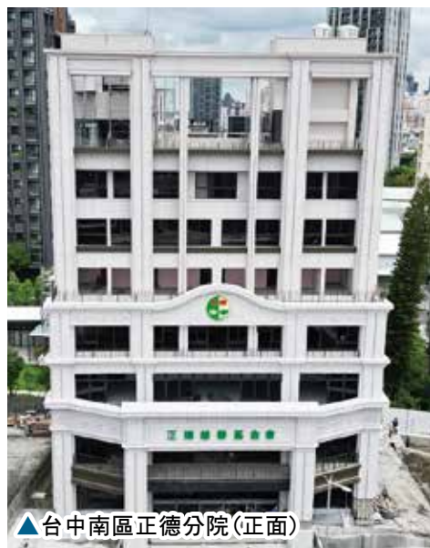
▲台中南區正德分院(正面)