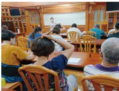
▲養生保健課程-學習經絡保健撥筋術，以簡易撥筋手法就可達到舒緩經絡自我保健課程。