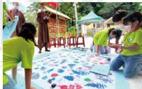
▲課程-手作植物拓染。