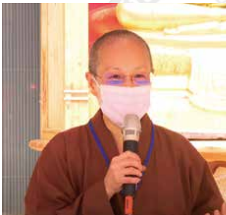
▲演音大德-破冰儀式精神喊話並勉勵學員。