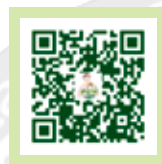
正德善念夏令營活動影片(下)

活動最後，安排頒獎表揚表現優良的小隊，並播放這幾天精采的花絮回顧影片。愛心媽媽以及小朋友們在柔和燭光及悠揚的心靈佛樂伴隨中，一一感性分享參加營隊的點點滴滴，現場有歡笑，有感恩，氣氛感人。活動就在充滿歡笑及依依不捨的離情中，大家互道珍重，為此次的善念夏令營活動畫下圓滿句點。