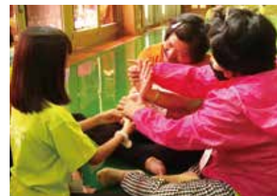
▲破冰遊戲-學員互相自我介紹。

活動安排有別於以往，雖仍依循佛門作息晨鐘暮鼓的按表操課，但除基本的佛門禮儀之外，更透過多元的遊戲引導，以及法句經故事的啟發，讓學員在輕鬆愉悅的學習過程中，將微妙的法意自然融入日常生活。學習團隊合作，培養同理心與耐心，讓學佛變得可親可近，而不再是枯燥無味，遙不可及！熏習成為一個具足慈悲善念，能獨立思考，也能關懷他人的人。有別於一般世俗對佛法生硬刻板的學習印象，相信學員們都受益良多，也是本次活動的主要目的。