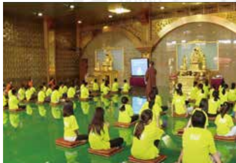
▲課程-佛陀故事講述。