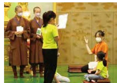
▲朗誦法句經，學員並透過肢體表演，演譯法句經故事，深刻體會故事內容。