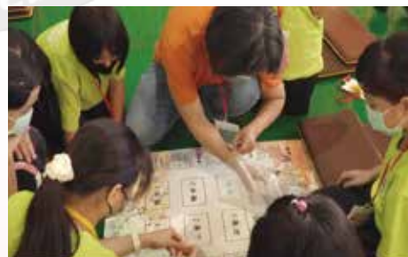
▲課程-有趣的輪迴大富翁遊戲感受其中妙趣。