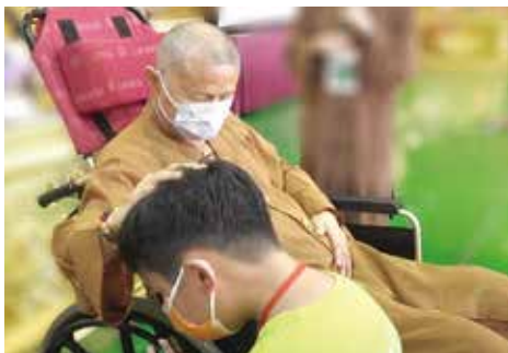
▲開山老和尚大德特蒞臨活動現場勉勵開示並一一為學員加持灌頂。