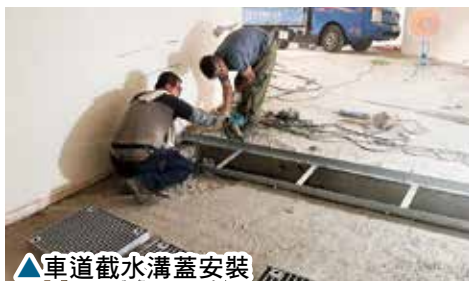
▲車道截水溝蓋安裝