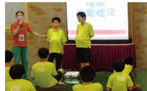
▲課程-透過扮演母親懷孕育兒之苦並學習感恩。