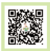
正德善念夏令營活動影片(上)

開山常律老和尚大德特別蒞臨活動現場，慈悲為每一位學員加持；並開示佛說，一個從小聽從父母師長教導的孩子，將來必是健康、長壽、聰明、財富、好名聲。鼓勵大家回去要當個聽話的孩子，未來福報無量。