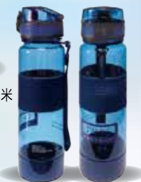
(圖2)太和工房運動水瓶