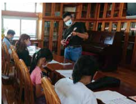
▲烏克蘭麗麗彈奏教學-學習簡單容易上手，音樂曲風輕快的烏克蘭麗麗彈奏，讓生活更有節奏。