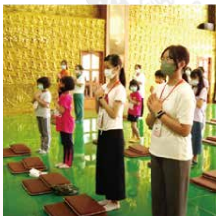
▲第一天學員報到分組整隊並學習禮儀規矩。