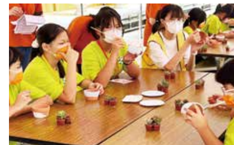
▲課程-手作淨心植栽趣。