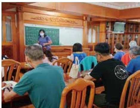
▲日文課程-透過不同語言與文化，延伸學習觸角，樂活人生。