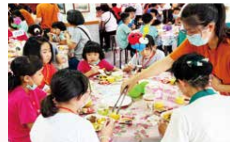
▲午餐饗宴-入營第一天，學員在愛心媽媽陪同下享用美味素食餐點。