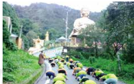
▲虔敬朝山，感受禮佛一拜的殊勝莊嚴