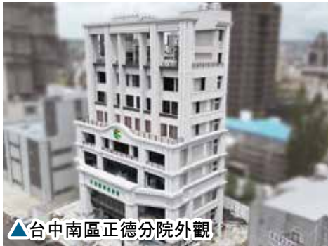
▲台中南區正德分院外觀