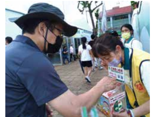
▲彰化分院-利用國慶連假前往人潮踴躍的竹山茶博物館行動勸募。