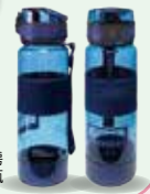
太和工房運動水瓶