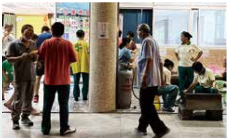
▲宜蘭分院-中秋素烤大啖美食。