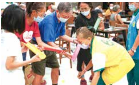
▲台中分院-珠行萬里團康遊戲。