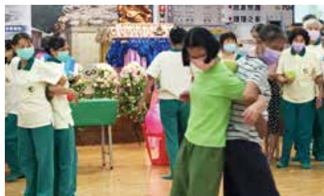
▲高雄總院-柚子接力團康活動。