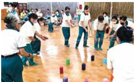
▲高雄總院-合力建城團康遊戲。