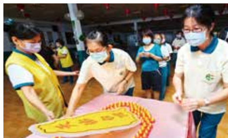
▲高雄總院-中秋點燈為台灣祈福。