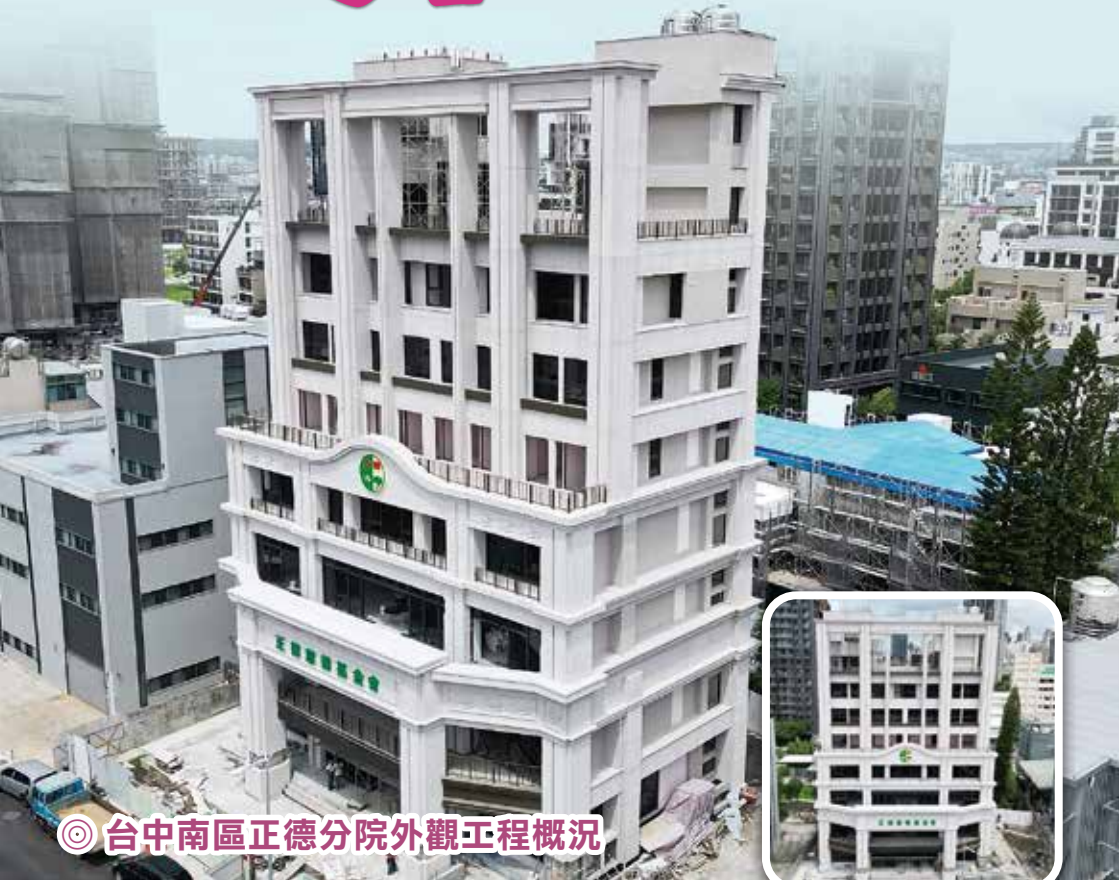
◎ 台中南區正德分院外觀工程概況