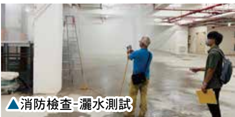
▲消防檢查-灑水測試