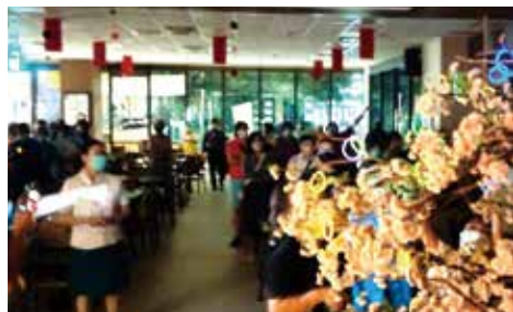
▲台中分院-中秋祈願點燈。