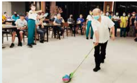
▲台中分院-趕小豬團康遊戲。