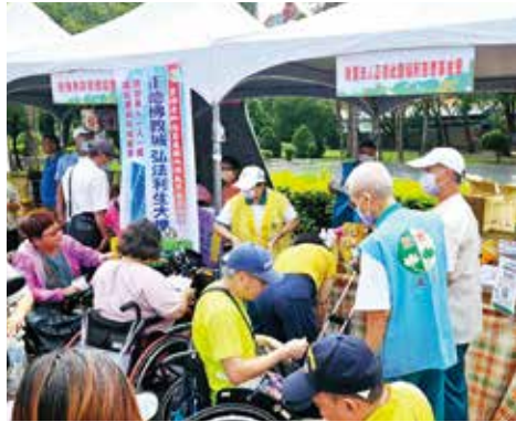
▲高雄總院-中秋暖心義賣活動，推廣正德佛教城弘法利生大樓理念並籌募建樓基金。