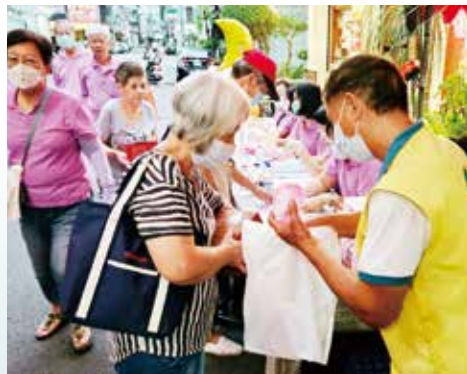
▲高雄總院-參與高雄市浩然里中秋晚會活動推廣蓋建正德佛教城弘法利生大樓理念，並提供物資發放予社區弱勢民眾。