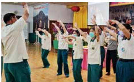
▲高雄總院-活潑的手足舞蹈帶動唱歡樂滿堂。