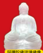
阿彌陀佛琉璃佛像