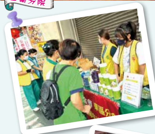
▲ 學生實際參與社區義賣勸募活動。