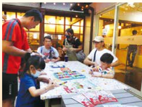
▲創意塗鴉著色，小朋友盡情揮灑，樂在其中。