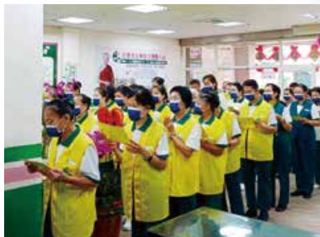
▲活動開始持誦大悲咒，祈圓滿順利。