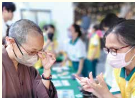
▲演音大德蒞臨園遊會現場嘉勉志義工的辛勞。