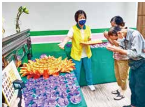
▲禮佛供燈--引領信眾親近三寶。