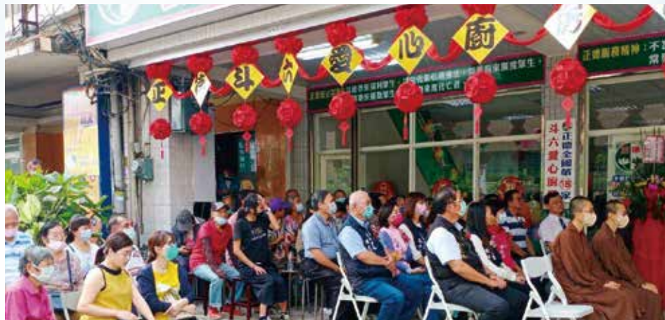
▲雲林地方政要賢達及信眾參與正德斗六愛心廚房喬遷開幕儀式，共襄盛會。