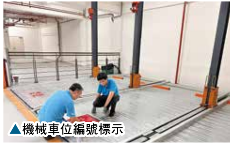
▲機械車位編號標示