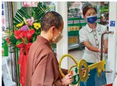
▲演音大德主持開鎖儀式。