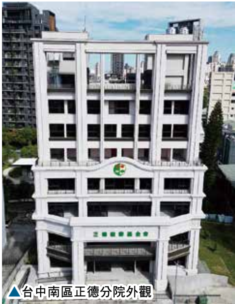
▲台中南區正德分院外觀