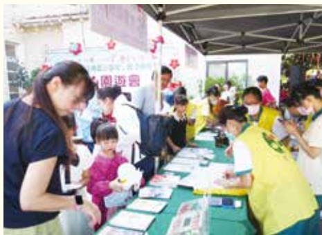
▲現場展示正德常律老和尚大德著作，以及正德相關志業資訊，提供大眾認識正德。