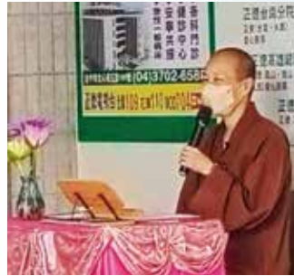
▲演音大德慈悲開示。

斗六愛心廚房 107 年於火車站後面以承租店面方式開辦，期間每每歷經租約到期是否續約的困擾，因期中要考量諸多內部設備及裝置成本等問題，還是得有屬於自己的地方比較能安心。於是慈悲的和尚非常用心的尋找，又要考量不能太鄉下，擔心食客用餐交通不便；市區地價成本負擔等等。但和尚堅定指示，無論如何一定要克服困難，讓斗六愛心廚房能繼續供餐，讓當地有需要的民眾人人有飯吃。終於菩薩保佑，五年後的今天，我們終覓得今天的場地，總算能安心的定安下來。