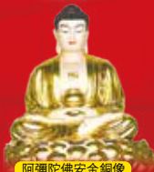
阿彌陀佛安金銅像