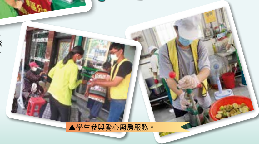
▲ 學生參與愛心廚房服務。