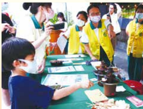
▲繽紛趣味闖關遊戲，小朋友開心兌換禮物。