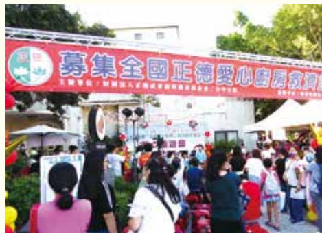
▲絡繹不絕的人潮，穿梭會場，熱鬧非凡。

11月11日 正德台中分院於台中不老夢想市集舉辦愛心園遊會，活動有樂活輕食、創意小點、美食饗宴、二手義賣、才藝表演、樂團演奏、趣味著色、創意show、趣味闖關遊戲等，精彩有趣，吸引民眾扶老攜幼熱情參與。