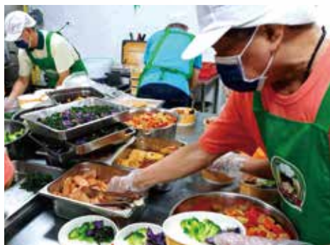
▲喬遷開幕喜洋洋，歡喜備餐迎佳賓。