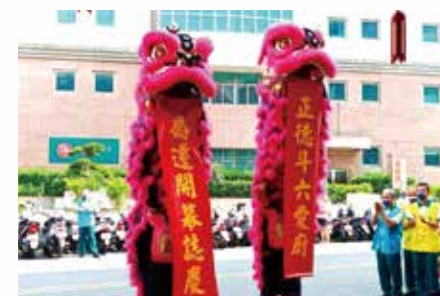
▲斗六愛心廚房喬遷開幕，祥獅獻瑞。