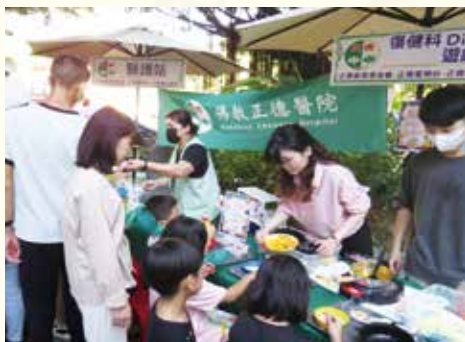
▲正德醫院提供DIY體驗遊戲，吸引小朋友參與。