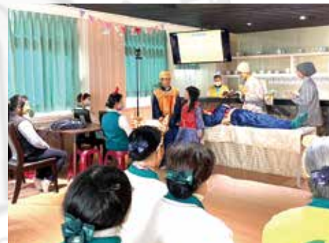
▲巴利藏兒童班小朋友生動活潑的佛教故事表演。