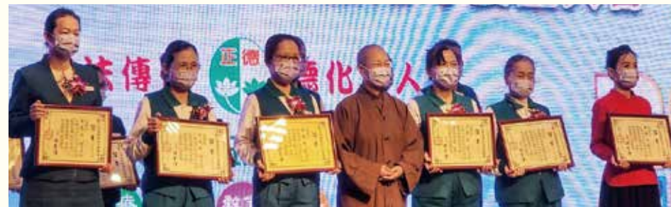
▲演音大德頒發年度榮董護持圓滿證書並合影留念。