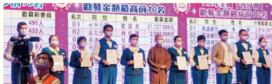
▲表揚年度各分會勸募金額最多前10名分會。