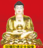
阿彌陀佛安全銅像