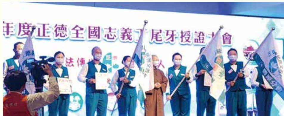
▲演音大德授證新成立分會。