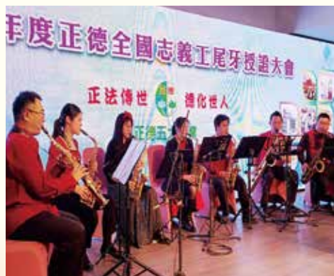
▲高素質的薩克斯風樂團表演，精采的演出，帶動全場歡樂氣氛，博得滿堂彩。