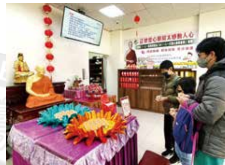
▲參加週年慶大眾虔敬供燈。

113年1月7日正德新竹分院設立6週年舉辦系列活動，活動有帶動唱、志義工特殊貢獻表揚、愛廚食客感恩話、巴利藏兒童班佛教故事表演、搓湯圓、冬令物資發放，活動多元有趣，吸引民眾扶老攜幼熱情參與。