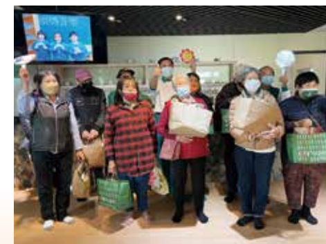
▲冬令愛心物資發放，讓食客過好年。