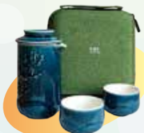
(圖2) 乾唐軒梅花泡茶器