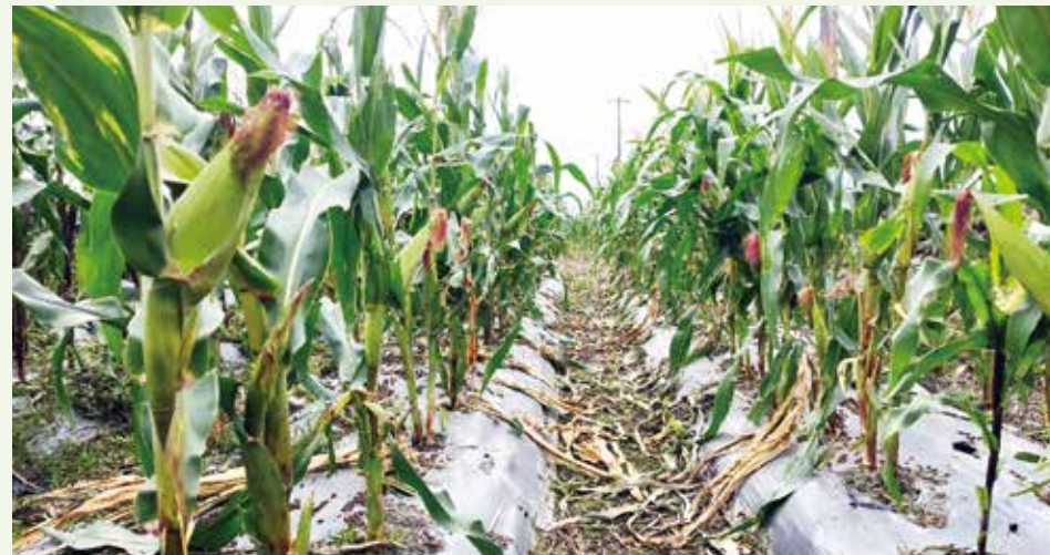
▲正德北區農場-所栽植玉米結實累累，成果豐碩。