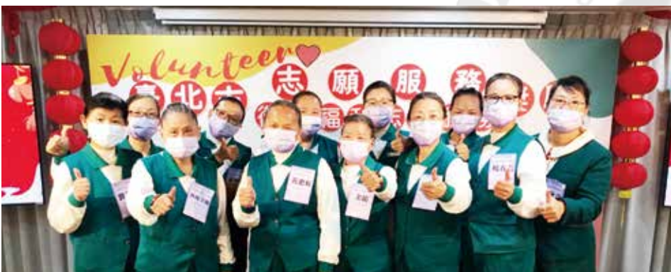
▲台北分院共計20名志工，分別榮獲金銀銅質獎殊榮。