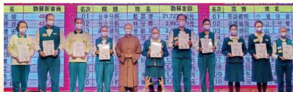
▲表揚年度招募新會員最多前10名發心志義工。