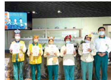
▲表揚特殊貢獻志義工，他們無私奉獻時間及體力，維持正德新竹分院及愛廚的運作。