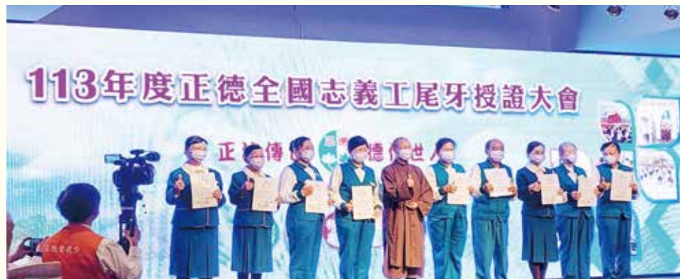
▲演音大德表揚發心護持30年以上資深志工，讚嘆他們長期護持的精神！