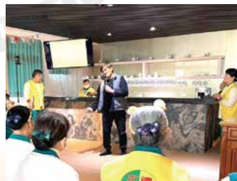
▲愛心廚房食客溫馨分享，感動人心。