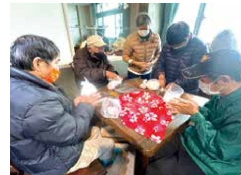
▲食客們團聚搓湯圓歡慶週年。