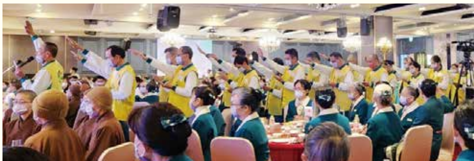
▲113年度來自全國各院共47名新進合核志工，進行隆重的授證宣誓儀式。