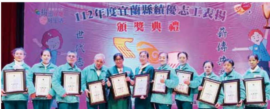
▲宜蘭分院共計11名志工，分別榮獲金銀銅質獎殊榮。

衛福部為鼓勵長期投入社會公益的志工，每年分別於各縣市舉辦表揚活動，藉以嘉勉善行，激勵更多人投入，互助互愛溫暖人間。