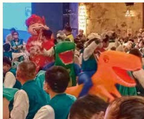
▲財神來了，全員嗨起來！