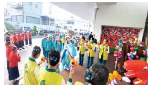
▲大會巧思安排可愛的恐龍布偶扮演迎賓角色。

一年一度的全國志義工大會又再次揭開序幕，主辦單位的用心策畫，精彩的展現於每一個細節。當天透過活動，表揚年度表現優良的志義工，讓大家感受到付出與奉獻的真正涵義，也是對全體正德人的鼓舞與回饋。因為付出，所以快樂；因為參與，所以幸福。一切的一切，都是全國志義工展現「真、善、美」的公益宗旨，源於全國志義工的無私與真情。