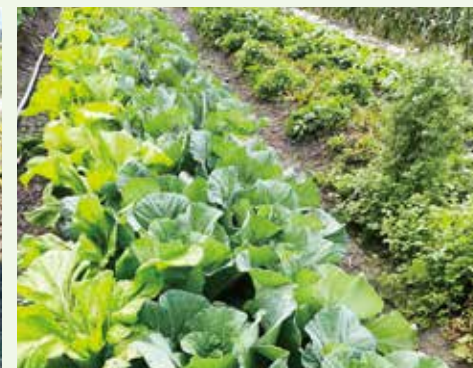
▼▲正德北區農場-志義工栽植各葉菜類農作有成，滿園菜香，即將收成。