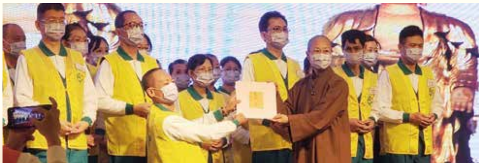
▲授證志工自演音大德手中領受證書，正式成為正德弘法利生志業的生力軍。