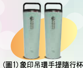
(圖1) 象印吊環手提隨行杯