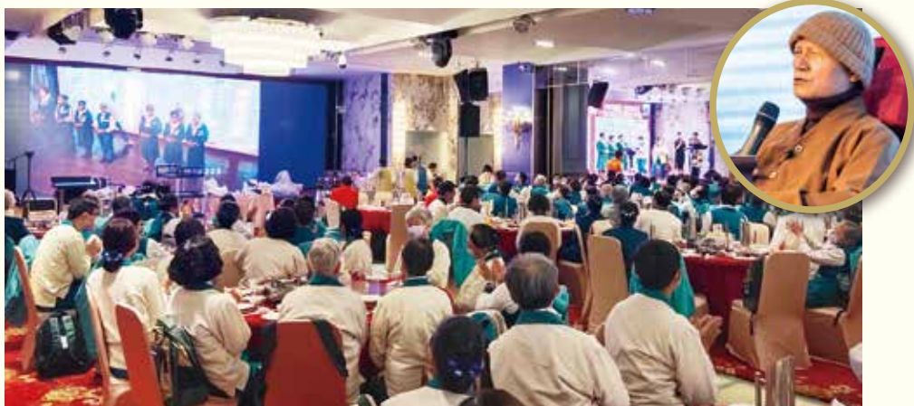
▲老和尚關心志義工，親臨現場慈悲開示，期勉大眾保重色身，精進不懈，成長自己，成就道業。

113年元旦，正德全國志義工大會於彰化全國麗園大飯店隆重揭開序幕，來自各院近千名正德人齊聚一堂，藉由歲末餐會，彼此感恩與祝福，亦象徵薪火傳承，共赴未來。