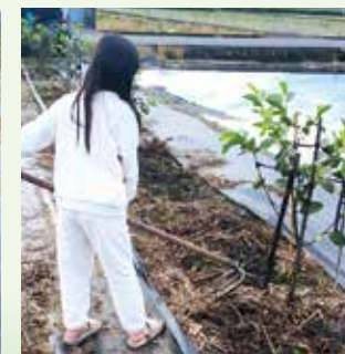
▲正德北區農場-小小義工荷鋤體驗田園之樂的可愛身影。