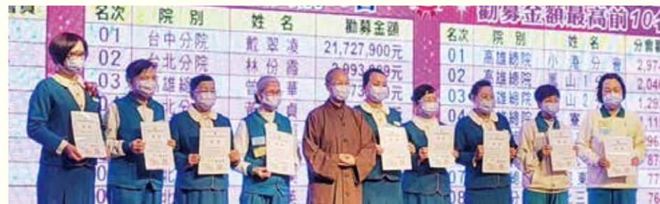
▲表揚年度個人勸募金額最高前10名發心志義工。