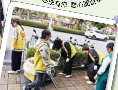
▲學生參與社區街道環境清潔服務。