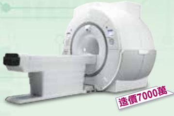
MRI 磁振造影掃描儀 與台大醫院同等級