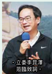
立委李昆澤蒞臨致詞。