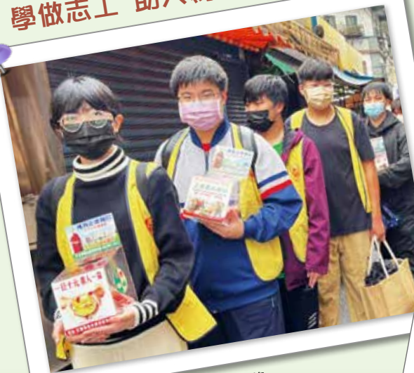
▲學生實際參與街頭行動勸募。