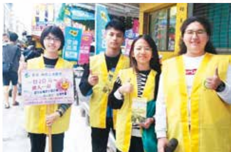
▲學生參與行動勸募，鼓勵布施行善，助人為樂。