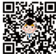
▲掃描QR觀看更多學生 真情心得分享。

感謝老和尚這次特別親臨現場，為我們開示解惑；感謝正德基金會給予多次服務機會及珍貴獎學金；非常讚嘆正德獎學金以「取之社會，更回饋社會」的服務連結，讓我們得以適度回饋。之後偶遇在各角落辛苦募款的正德師兄姐，總會開心自發地隨喜布施，並微笑向師兄姐們道一聲「辛苦您們！謝謝您們！」感受交會期間的暖意，也期願未來有能力繼續傳送這份溫暖，讓它遍及各地，阿彌陀佛！