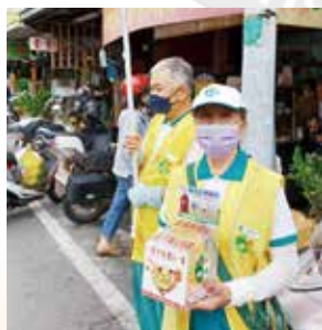
▲新營分會-六甲市場行動勸募