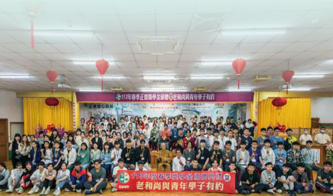
◎113年正德春季獎學金頒贈典禮 常律老和尚大德偕同前來觀禮的許智傑立委與全體受獎學生合影