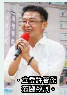
立委許智傑蒞臨致詞。