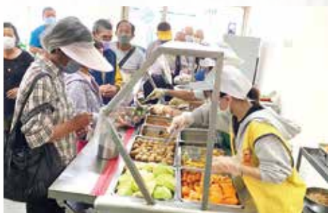
▲學生至愛心廚房服務，實際參與社會公益。

前二次的服務是發送慈音月刊與人結緣、鳳山愛廚備料發餐；本次其中一日分發至三民愛廚協助，緊湊的備餐過程如一場韌性十足的戰役，師兄姐默契十足相互調配，目的無非是讓食客們享用最豐盛安心的佳餚。參與其中的我深深