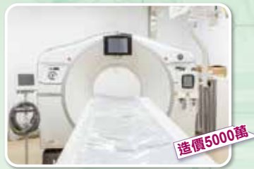
CT 電腦斷層掃描儀 與台大醫院同等級