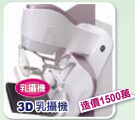
目前中部地區只正德醫院與中國醫藥學院購置同機型