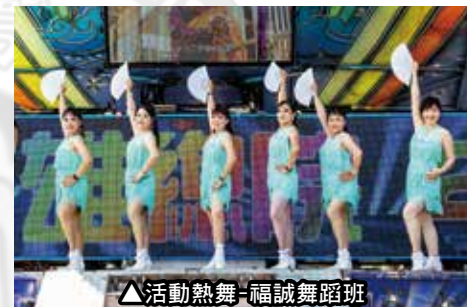
▲活動熱舞-福誠舞蹈班