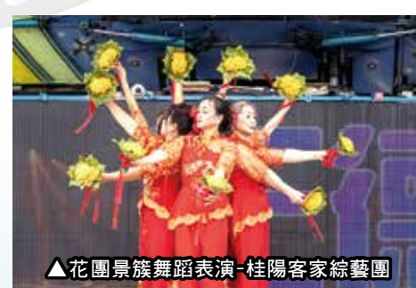
▲花團景簇舞蹈表演-桂陽客家綜藝團