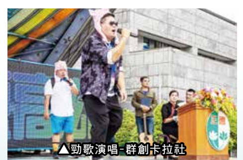
▲勁歌演唱-群創卡拉社