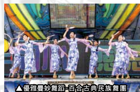
▲優雅曼妙舞蹈-百合古典民族舞團