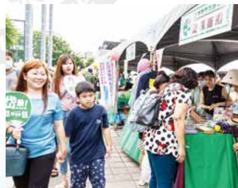
▲現場民扶老攜幼熱情參與各攤位活動，玩得不亦樂乎。