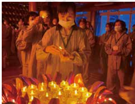
▲佛前供燈，照破黑闇，迎向光明。