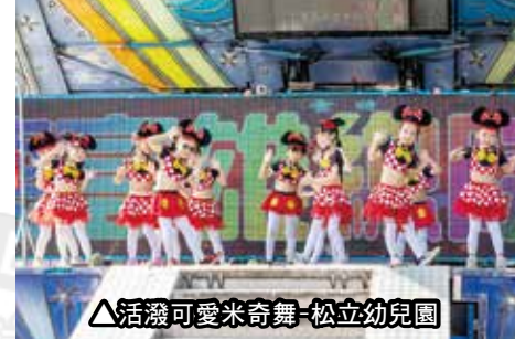
▲活潑可愛米奇舞-松立幼兒園