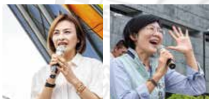
▲立委李昆澤(左上)、立委許智傑(右上) 立委邱瑩瑩(左下)、立委林岱樺(右下) 蒞臨致詞。