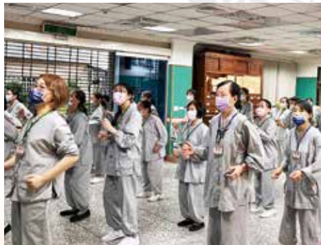
▲晨起暖身，舒展筋骨，元氣滿滿。