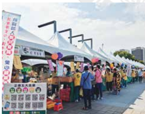
▲園遊會共有71個各具特色攤位。