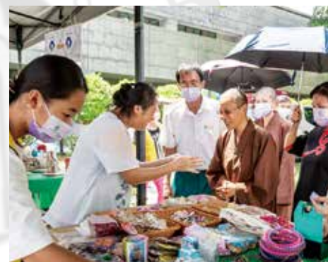
▲演音大德親臨各攤位，嘉勉志義工辛勞。