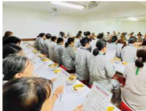
▲受食前恭誦供養發願偈。