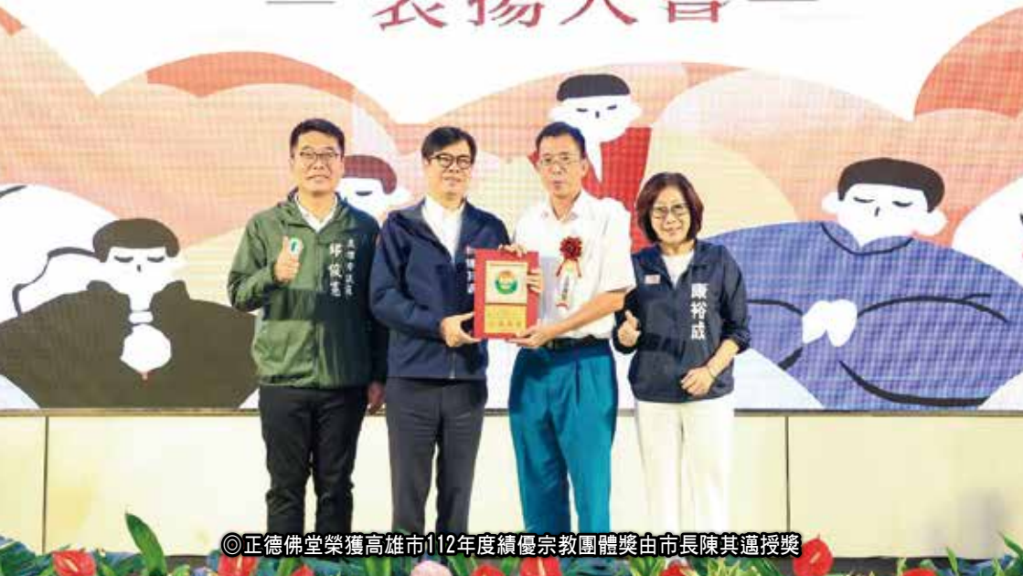
◎正德佛堂榮獲高雄市112年度績優宗教團體獎由市長陳其邁授獎