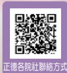
正德各院社聯絡方式