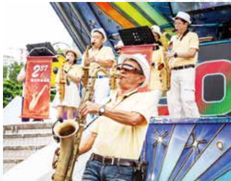
▲動人旋律演奏-237薩克斯風樂團。