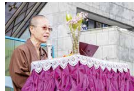
▲正德社會福利基金會董事長演音大德開示