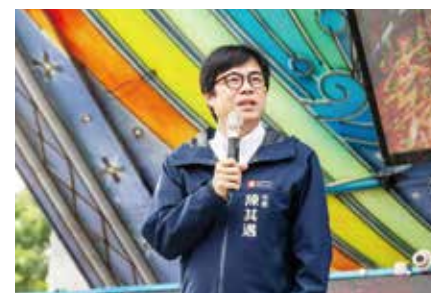
▲高雄市市長陳其邁 蒞臨致詞