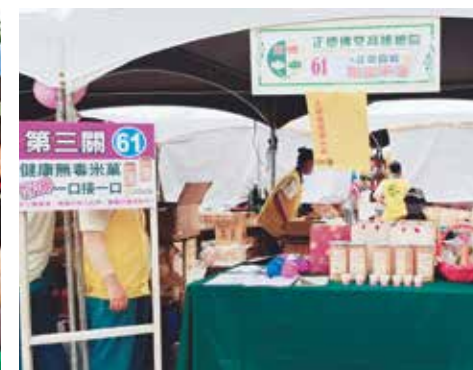
▲正德農場 - 正能量蘭星米菓義賣。