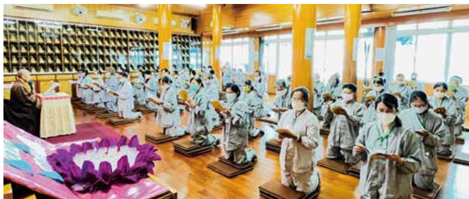
▲莊嚴的授戒儀式，戒子虔心領受