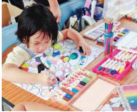
▲色彩繽紛彩繪著色趣-兒童專注彩繪作畫。