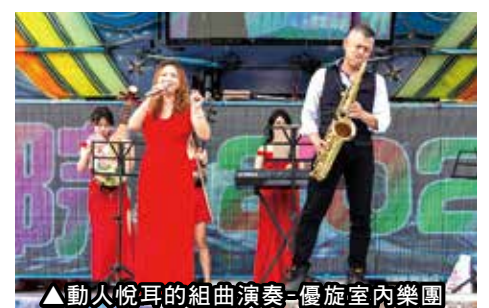
▲動人悅耳的組曲演奏-優旋室內樂團