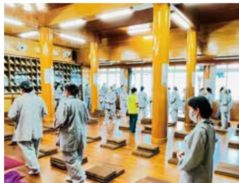
▲念佛繞佛，收攝六根，專注當下。