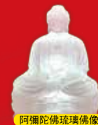
阿彌陀佛琉璃佛像