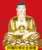
阿彌陀佛安金銅像