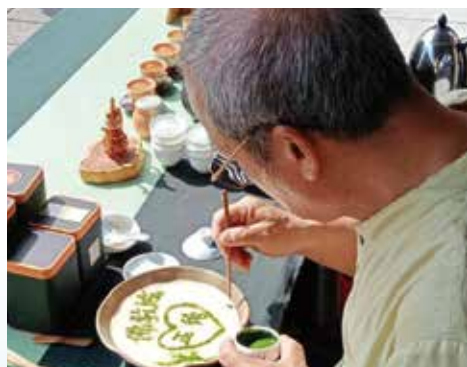
▲桂花園展示的宋代點茶藝術。