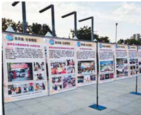
▲正德五大志業簡介展示。