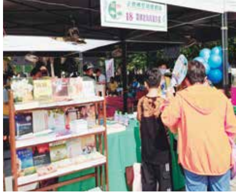
▲開山常律老和尚著作展示區。