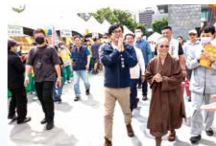
▲高雄市長陳其邁市長親自出席，展現對公益志業的支持。