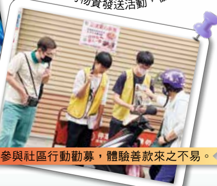
▲學生參與社區行動勸募，體驗善款來之不易。