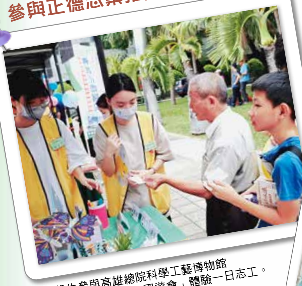
▲學生參與高雄總院科學工藝博物館「感恩有您 愛心園遊會」體驗一日志工。