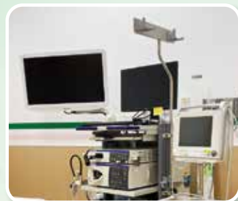
大腸鏡檢測設備/一台