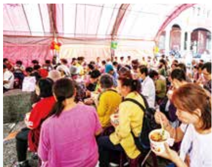
▲開幕典禮，宜蘭鄉親熱情參與。