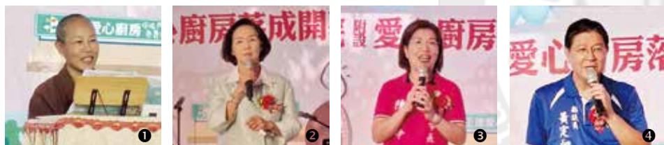
①演音法師開示及②宜蘭縣縣長林姿妙、③宜蘭市市長陳美玲、④宜蘭縣縣議員黃定和致詞