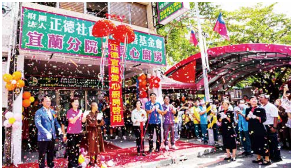
▲正德全國第25家宜蘭愛心廚房開幕儀式，正德基金會會董事演音法師親臨現場與與會佳賓及宜蘭鄉親，共同見證這歷史性的一刻。