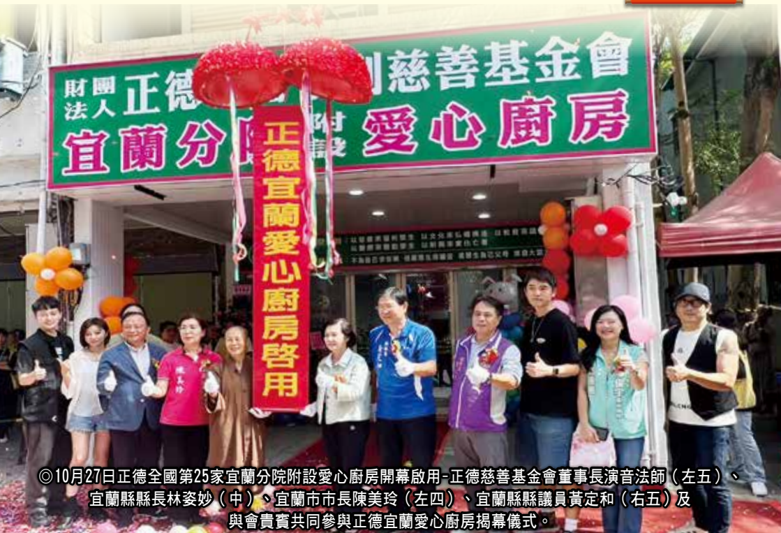
◎10月27日正德全國第25家宜蘭分院附設愛心廚房開幕啟用-正德慈善基金會董事長演音法師（左五）、宜蘭縣縣長林姿妙（中）、宜蘭市市長陳美玲（左四）、宜蘭縣縣議員黃定和（右五）及與會貴賓共同參與正德宜蘭愛心廚房揭幕儀式。