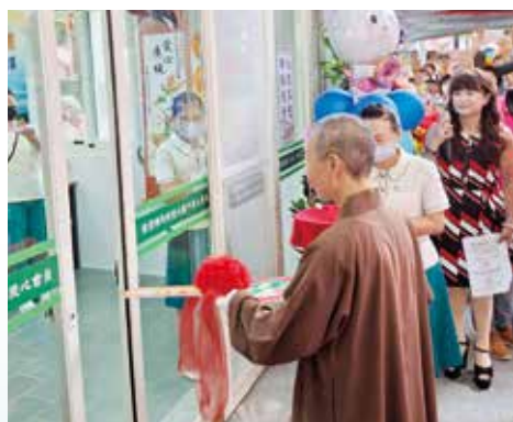
▲宜蘭愛心廚房簡單隆重的開鎖儀式。