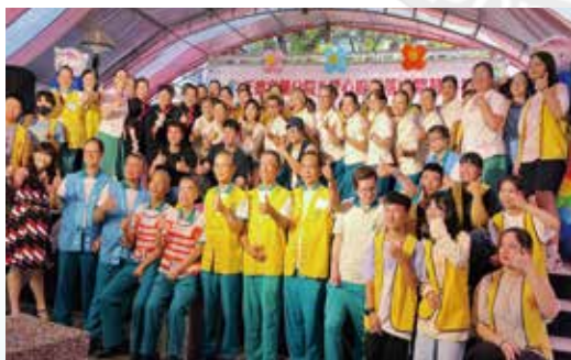
▲活動圓滿，現場志義工與藝人大合照留念。