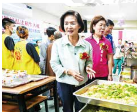
▲與會貴賓實際參訪了解愛廚運作及設施。