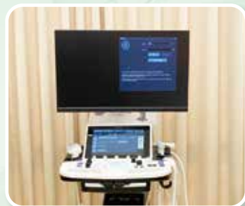
高解析全數位彩色超音波掃描儀/一台