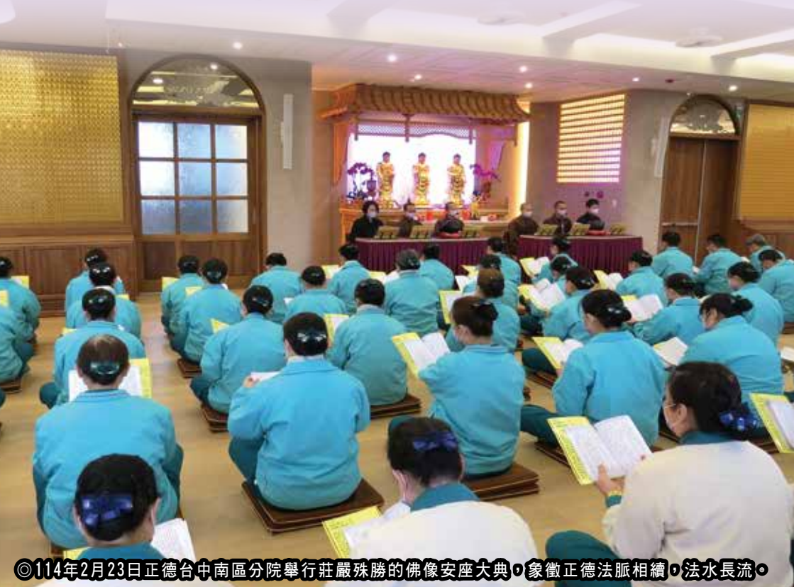
◎114年2月23日正德台中南區分院舉行莊嚴殊勝的佛像安座大典，象徵正德法脈相續，法水長流。