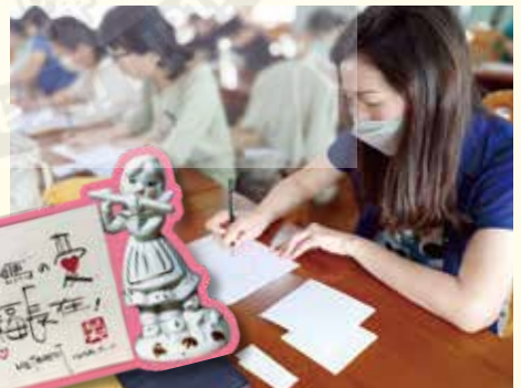
▲手寫藝術研習課程／社區民眾學習手寫藝術感受生活美學，適逢5月母親節，學員書寫賀卡感恩並祝福母親。