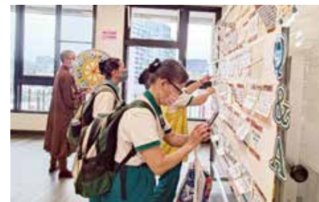
▲福慧增長-法句經體驗。