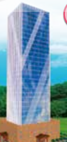
正德佛教城弘法利生大樓藍圖