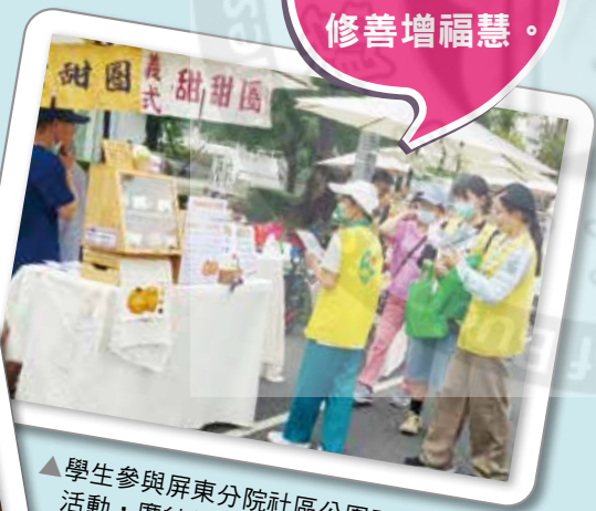
▲學生參與屏東分院社區公園正德志業推廣活動，廣結善緣，體驗一日志工。