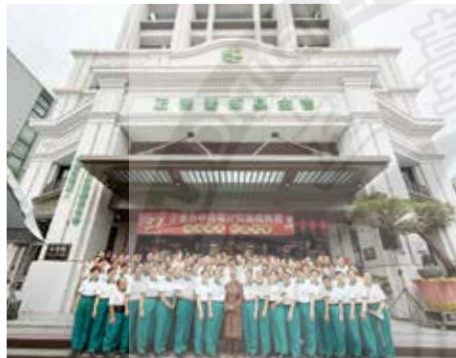
▲演音大德和與會志工們於南屯分院前合影留念。

隨著活動的開始，我們陸續被引導參與主辦單位精心設計的各樓層活動。首先於二樓佛堂的三寶佛前恭誦《大吉祥經》，隨後每個人都得到一只和尚大德親自加持的御守，感覺非常的有福報，也非常的感動！因為這是來自老和尚慈悲的祝福，希望大家都能夠健康、長壽、平安。