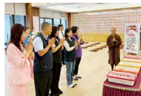
▲【五根香遇·禮佛心香】演音大德為貴賓說明活動內容並引領禮佛。