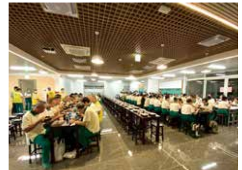
▲【五根相遇·烘焙香】地下一樓五觀堂-供眾用餐。