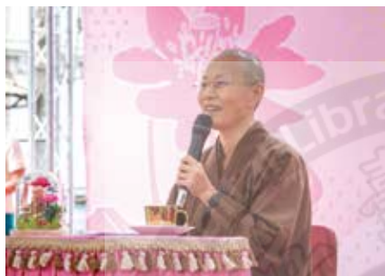
▲演音大德蒞臨會場慈悲開示。