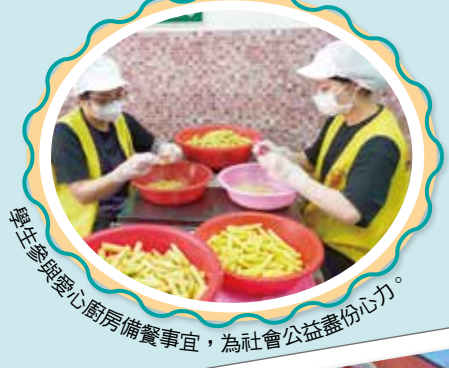
學生參與愛心廚房備餐事宜，為社會公益盡份心力。