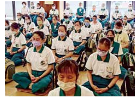
▲【五根香遇·禪香】三樓禪堂靜坐體驗。

在此，非常感恩主辦單位——南屯分院，以及我們老和尚大德帶領整個正德團隊，非常的用心，讓我覺得今天真的是一個療癒而且是幸福滿滿的一次旅程。感謝各位！阿彌陀佛！