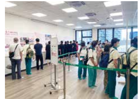
▲【五根香遇·歲月香】四樓展覽室。