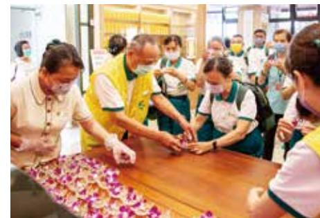
▲【五根香遇·花香】虔敬供花。

未來，正德南屯分院將延續老和尚大德「慈悲濟世、關懷生命」的一貫理念，結合正德醫院醫療資源與各項慈善道業，並陸續開辦各項健康講座與樂活長青等多元課程，提供大台中市民及弱勢民眾一處身心靈依止的場所，為南屯地區注入更多正向關懷與醫療能量。歡迎民眾多加利用！