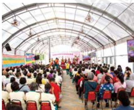
▲來自北中南山志義工及貴賓見證南屯分院落成典禮。

從 B1 烘焙香、1 樓花香 & 咖啡香、烘焙香、2 樓禮佛心香、3 樓禪香、最後走進「4 樓歲月香」時光廊道，讓大家可以細品正德發展足跡。與會人員依序體驗，由一樓大廳的供花禮佛開始，依指引逐步走向二樓殿堂恭誦《大吉祥經》；接著上三樓淨坐；再上四樓抽籤體驗法句經；最後到地下一樓五觀堂享用午膳，並領取一份點心。完成每一關卡體驗並蓋章後，再持集章卡到一樓服務台兌換精美好禮。