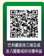
巴利藏受持三皈五戒及八關齋戒的功德利益