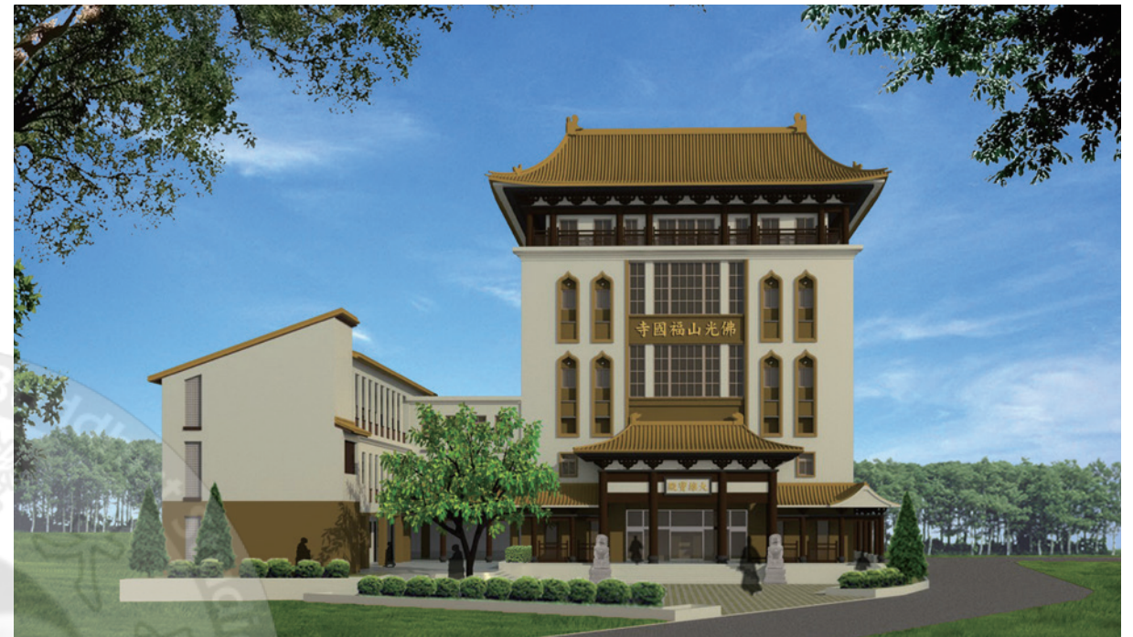
福國寺重建示意圖

網址： http://web.fgs.org.tw/index.php?ihome=D51200