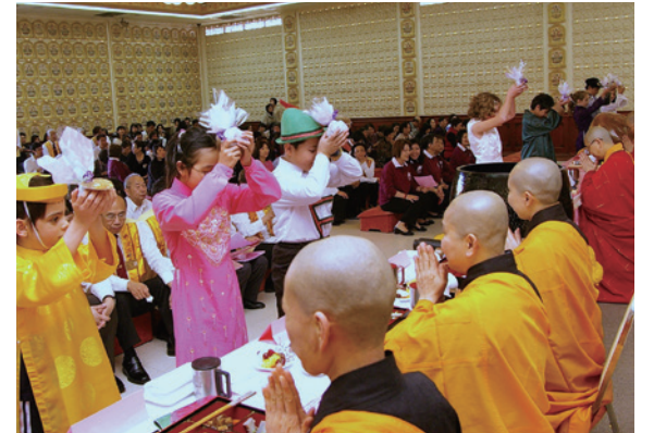
國際佛光會昆士蘭協會主辦的盂蘭盆供僧法會溫馨感人