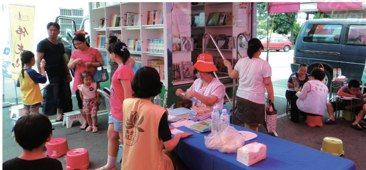
厝邊相招，親子一同來看書

福安宮廟宇建築巍峨雄偉，香火鼎盛，信徒遍佈全省，福安宮以奉祀天上聖母媽祖為信仰中心，至今已有300多年的歷史，每年的3、4月媽祖進香期間，常有進香遶境的活動。佛光山「雲水書坊—行動圖書館」結合伸港鄉社區宮廟，推動文化教育工作，四處播種書香閱讀的種子，期待成就書香氣息的社會。