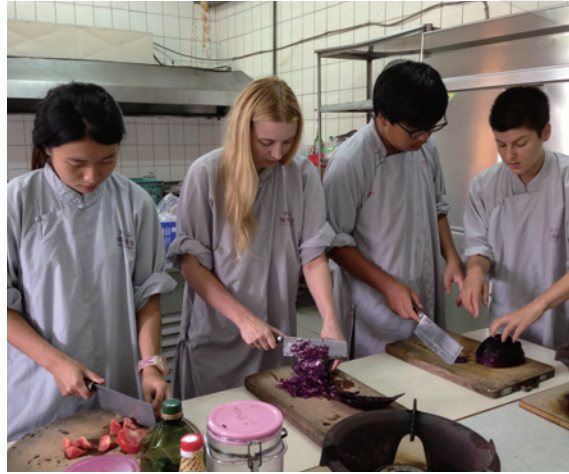
青年學習素食烹飪