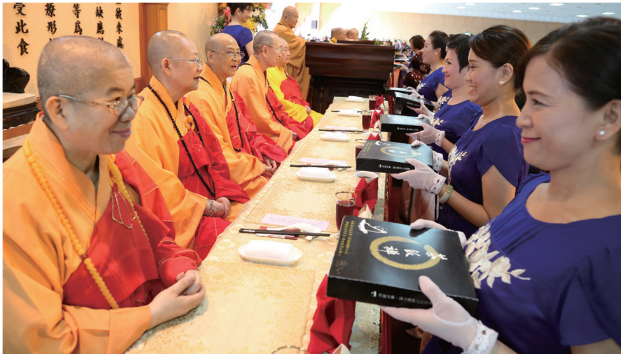
佛光山每年舉辦「供僧法會」，廣邀佛教界長老、大德前來應供