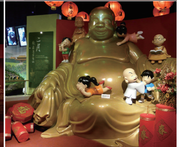
佛教節慶館內呈現佛教一年四季分別舉辦的各種節慶

念小學的女兒，遠遠看到觀世音菩薩的祈願區即欣喜不已，他們來到慈悲的菩薩跟前，站在此區特別設計的位置，讓觀音淨瓶裡的甘露水灌注灑下，祈願能得清淨智慧。