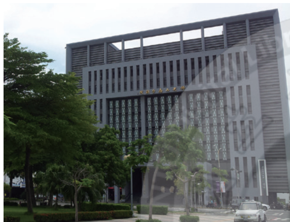
南台別院建築外觀