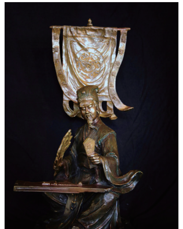
決勝千里—孔明 銅雕 林韋龍