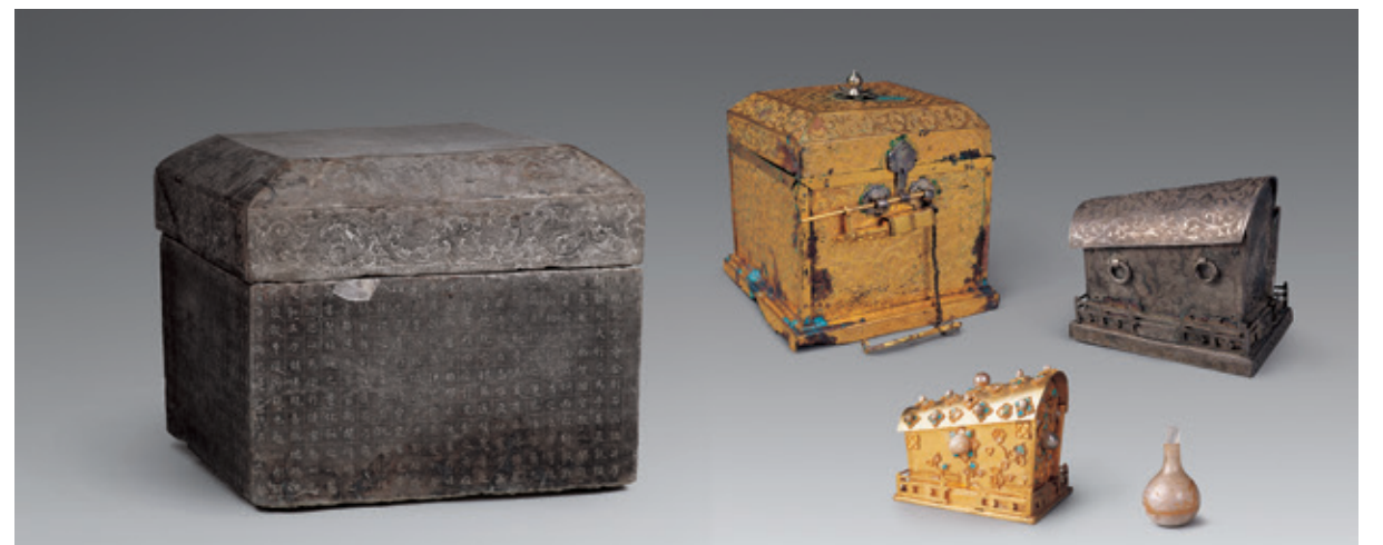
迄今發現紀年最早的唐代舍利棺與舍利函，將於佛光山佛陀紀念館展出

正如前述，西漢張騫通西域開闢中西交往的絲路，成為佛教始而傳入中土的便道，同時的造像使甘肅河西走廊成為佛教石窟寺的聖地，構成絲路風景輪廓線，且是極度重要的歷史文化遺產。此次甘肅省博物館的精彩藏品盡出，例如，十六國的〈銅鑲金傘蓋佛像〉、〈北涼石塔〉、常常聽聞的北魏〈曹天護造像石塔〉、