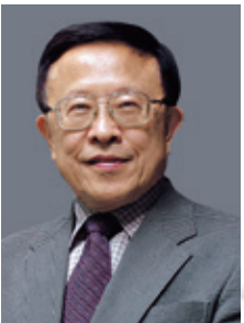
高希均 遠見・天下文化教育基金會創辦人

本書是莫言獲諾貝爾文學獎後的首部作品。全書十餘萬字，按時間順序排列，真實記錄了莫言在瑞典期間的每日活動、演講、採訪及感想，包括日記十三篇，演講實錄七篇，採訪實錄八篇。並從莫言瑞典行的五千多張照片中，精挑細選六十餘幅彩色照片，以圖文並茂的方式，讓讀者也能身歷其境，跟著這位諾貝爾文學獎大師，一同參與這一年一度的盛事。