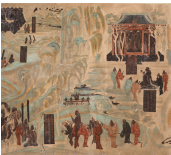
張騫出使西域圖（摹本）/ 敦煌研究院