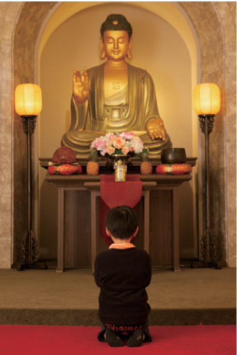
A 組 銀牌 佛祖！我很乖！（邱翁頡）

時 間 / 2013 年 9 月 22 日下午 14:00 頒獎地點 / 佛光山佛陀紀念館本館大廳 展出地點 / 佛光山佛陀紀念館禮敬大廳二樓