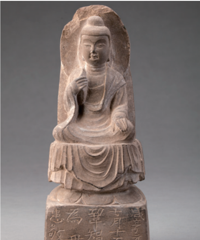
唐代鞏智才石佛坐像 / 西安碑林博物館