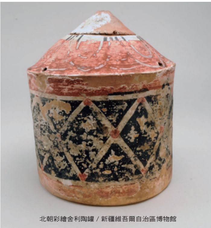
北朝彩繪舍利陶罐 / 新疆維吾爾自治區博物館