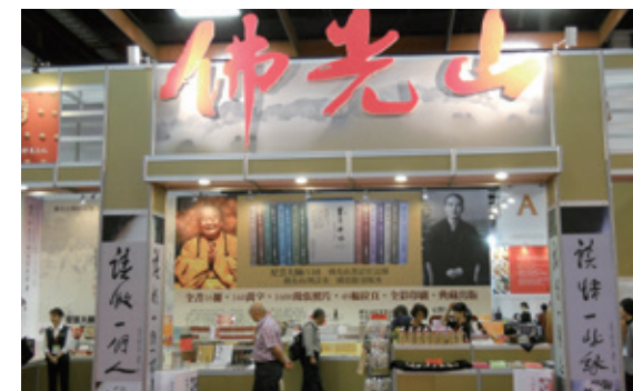
佛光山出版社展出眾多書籍

到2011年，已有6部書車巡迴各地，服務成效卓著。2012年6月，書車擴增至50部，到目前為止陸續設立近800個站點，將書香傳送到每個需要的地方。