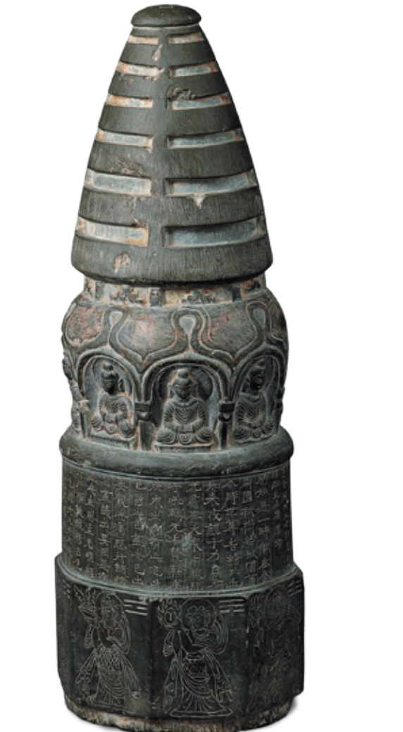
北涼石塔 / 甘肅省博物館