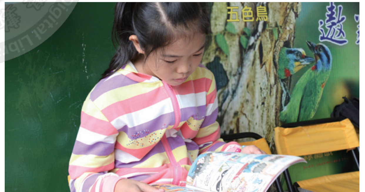
佛光山「雲水書坊—行動圖書館」將書帶到偏遠地區，小朋友認真閱讀手上的書籍