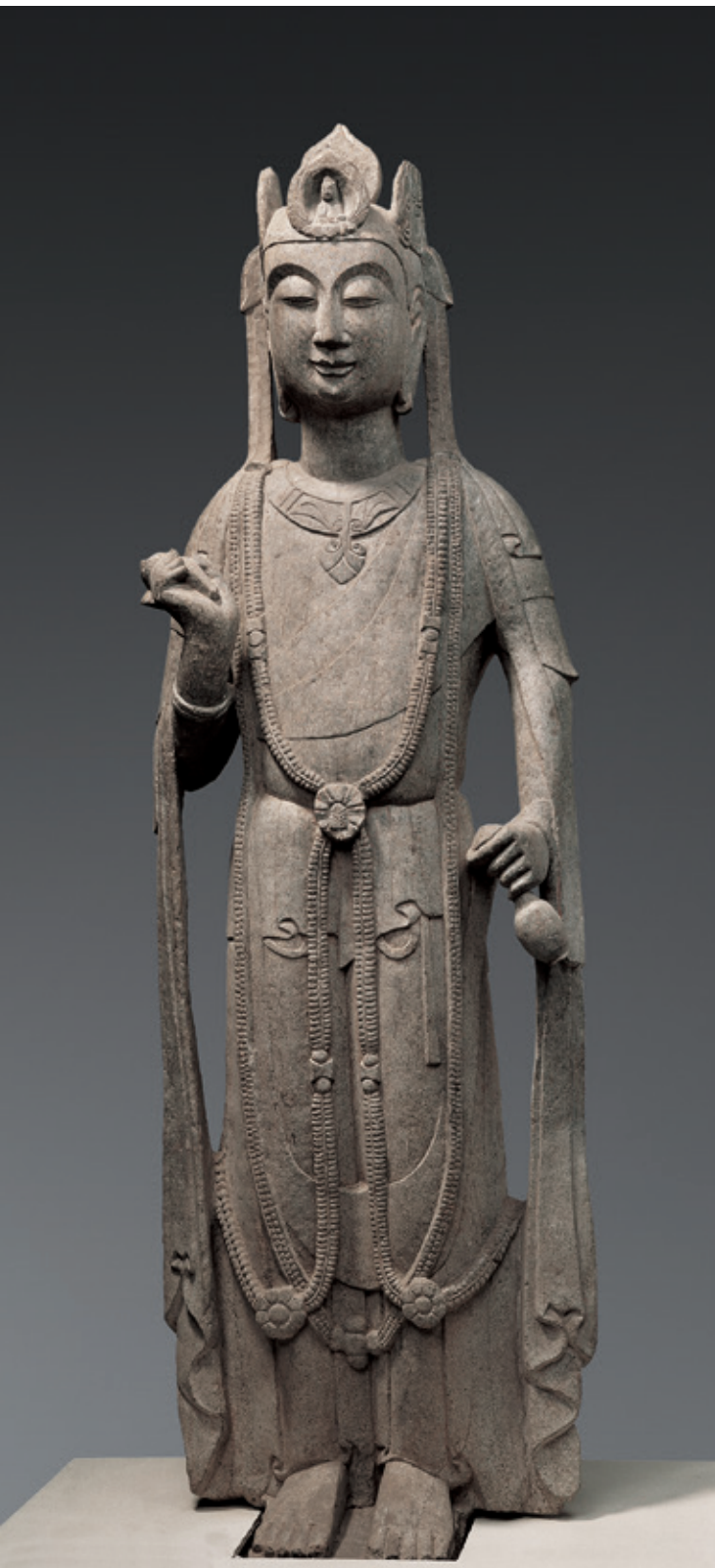
隋代石觀音立像 / 甘肅省博物館