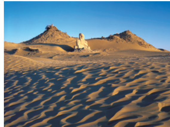
絲路上的尼雅佛塔遺址