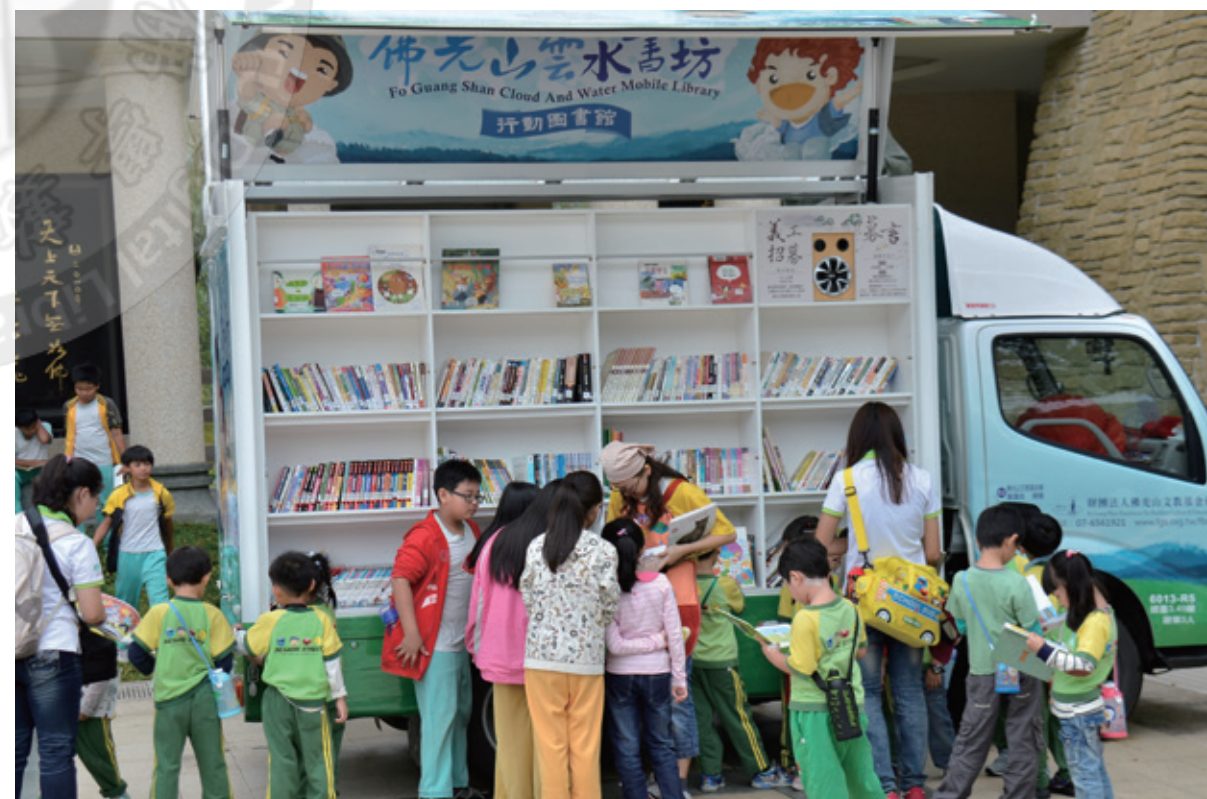
說故事媽媽所到之處總是受到學童的包圍

9月14日至22日一連九天的佛光山 2013 國際書展，願讀者能收穫滿滿，福慧雙全。