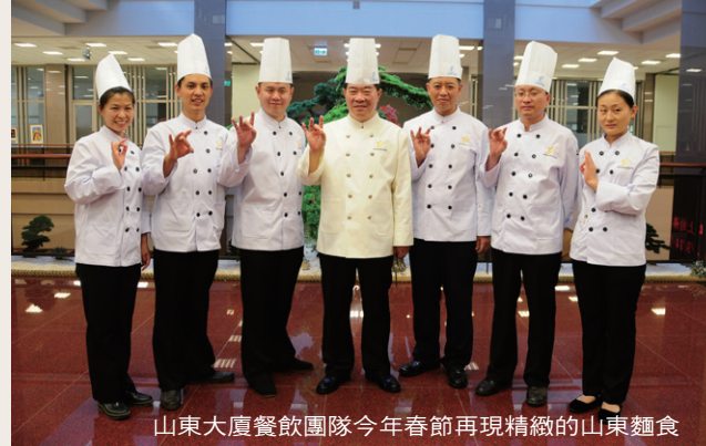
山東大廈餐飲團隊今年春節再現精緻的山東麵食