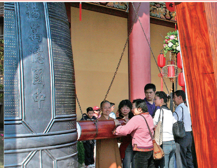
民眾很喜歡在佛光山大雄寶殿叩鐘祈願