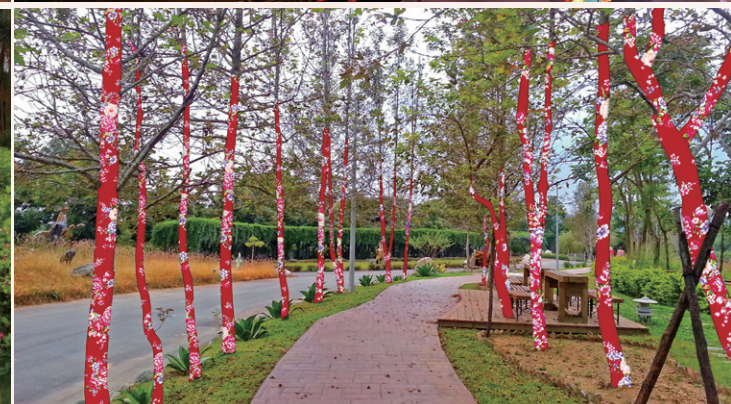
（上）喜氣洋洋的花燈區 （下）黑面山羊，得意洋洋