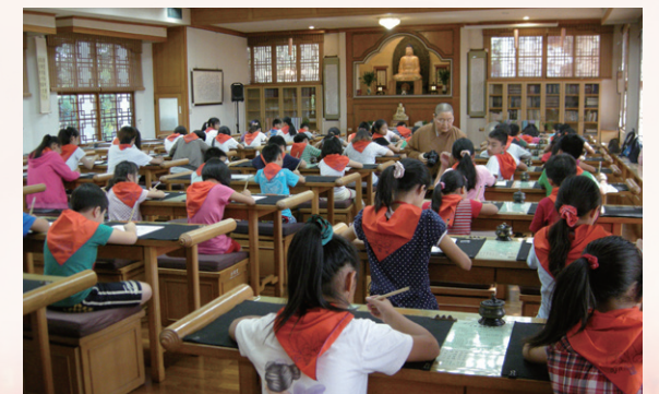
新春在佛光山抄經淨化心靈，多麼棒