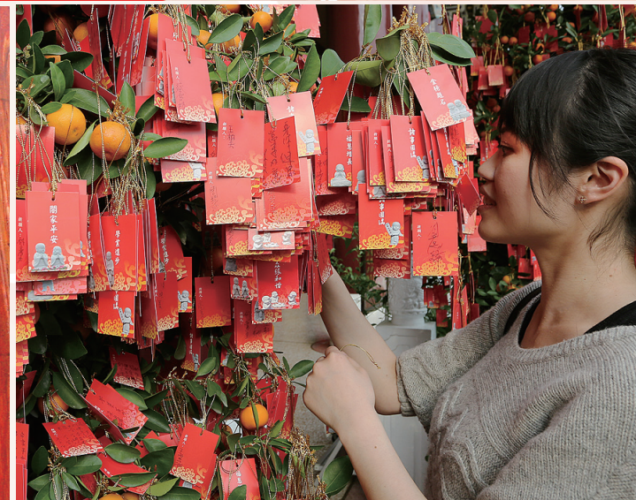
新的一年，祈願卡掛滿樹梢，喜氣洋洋