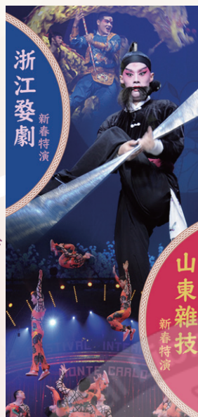
山東雜技及浙江婺劇