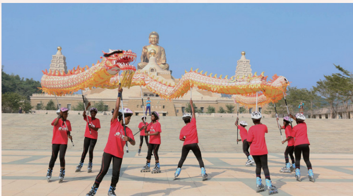
南非天龍隊穿著直排輪在佛館舞龍

佛館各區的綠地上，喜氣洋洋—洪易地景裝置藝術展和高通通地景裝置，色彩繽紛的卡通式雕塑，在新的一年散播歡樂與吉祥來為社會大眾祝福。