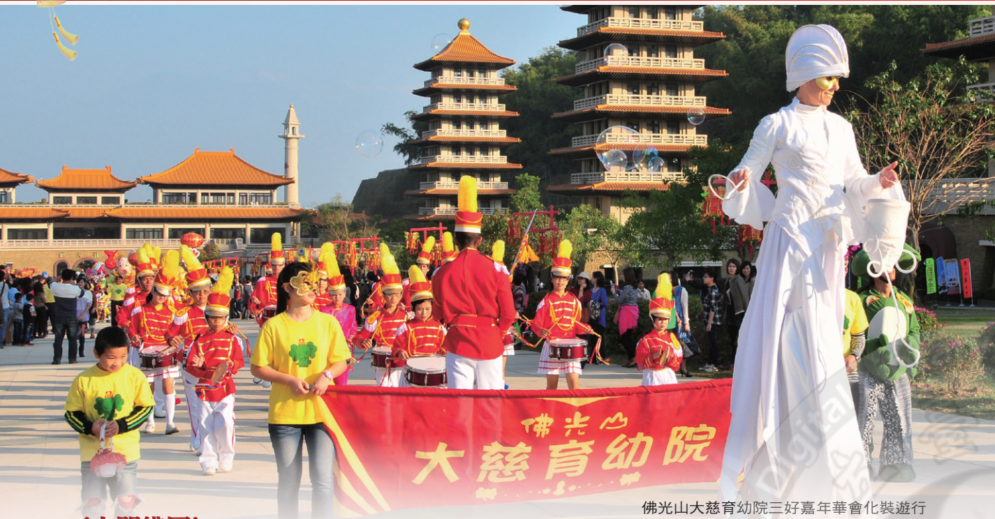
佛光山大慈育幼院三好嘉年華會化裝遊行