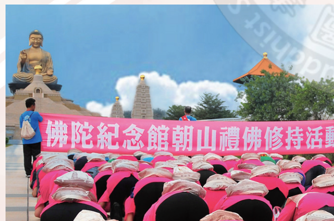
歡迎來佛光山及佛陀紀念館朝山禮佛

佛光山滿山高掛平安燈，祈願平安喜樂，讓訪客沐浴在祥和的氛圍中。您可以參與上燈法會、禮千佛法會、大悲懺法會、叩平安鐘、殿堂參拜、朝山禮佛等活動，為身心注入新能量，為國家祈安定，為世界祈和平。點燈祈願、抄經念佛、與佛接心，希望人人點亮慈悲智慧的心燈，照破黑暗，散播光明與美善，獲得平安與和諧的力量。