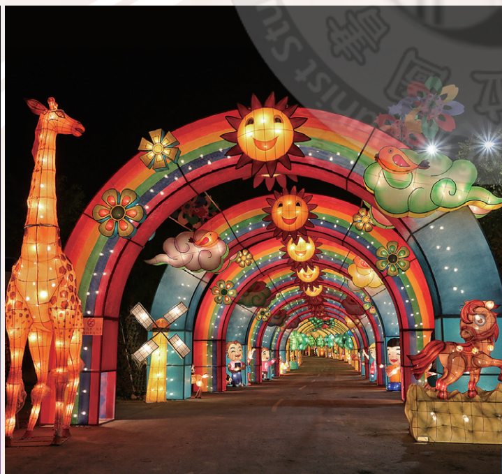
200 公尺長的「天堂在哪裡」光環隧道