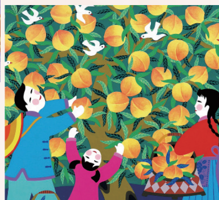
(上) 金山農民畫 (下) 邱建國《采桃樂》