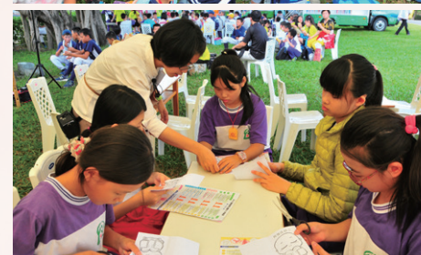
(上)小朋友認真聆聽故事劇情的表情可愛極了