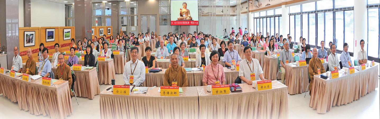
第二屆玄覽論壇來自兩岸300餘位專家學者，一同推廣閱讀、深化經典