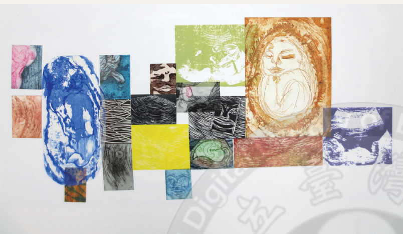
期待系列1 張維婷 79X109 併用版