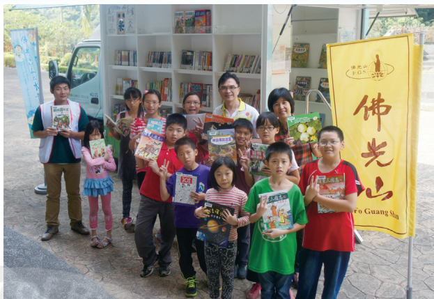
雲水書車的到來是育樂孩子最期待的日子

因為一個月一次，書車到訪都會提醒孩子們要好好用功，從書上多拿點兒知識回來。育樂的孩子很有福氣，能與書車結緣，他們讀的書量也在日日提昇，智慧更時時增長。有雲水書車，真好！