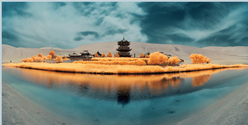
月牙泉系列—四季 2 (秋)