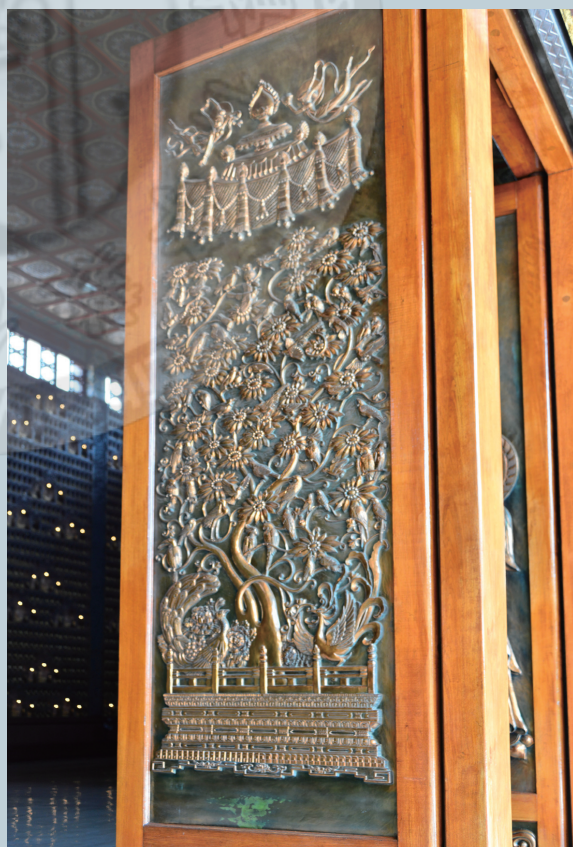
佛光大雄寶殿大門的鑲刻藝術

從大雄寶殿屋檐上的圓形瓦當、金龍、神獸，入內望向穹頂壁畫的佛像、蓮花、藻井，以及四周梁柱上的飛天圖像，跳脫時空，歡喜讚嘆，以樂音及曼妙舞姿供養諸佛，有的吹笛、有的彈箏、有的獻花，快樂歡喜誠心讚美佛的無量功德，遍及三千大千世界。