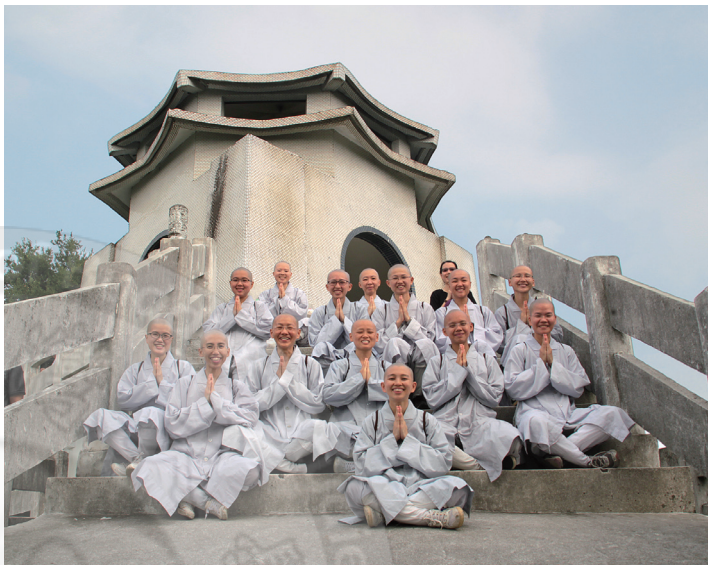
叢林學院學生於旗尾山頂合影

下山後師生一行前往佛光山旗山禪淨中心，住持永餘法師親自為大家煮茶，更以佛法開示教導大家：這一套茶具原是一套精品，因有細微的瑕疵而棄置在工廠險遭淘汰，後來終以優惠的價格被買回來。住持強調：生活用品的價值在乎於「用」，所謂的瑕疵品，並沒有失去它「用」的功能，未必每樣東西都要用最好的，可以有替代的選擇，要懂得節儉持家之道。同學們感謝師長的教導，從一個茶壺中體會到佛法在生活中的實踐。