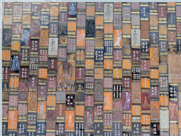
上／佛光山東禪樓上的敦煌壁畫一景