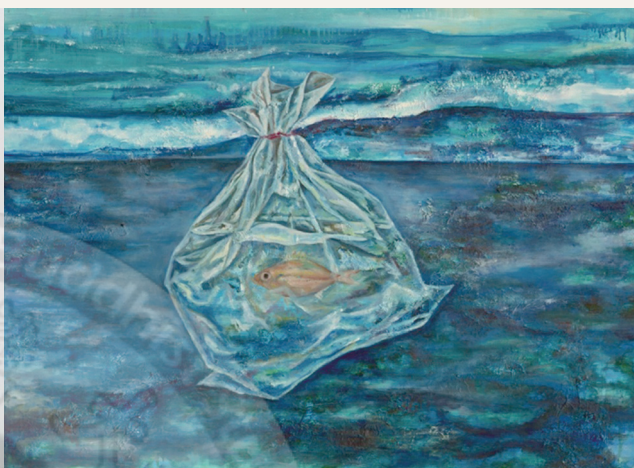
海平面 詹琇媛116.5X91cm 水彩

「菩提本無樹」是由四位正就讀研究所的學生共同舉辦的展覽，在別人眼中或許他們只是學生，但藝術這條路對他們的生活卻是充滿了驚奇與幻想，透過作品讓觀者感同身受這奇妙的夢想。