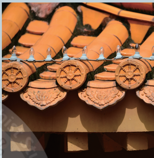
佛光大雄寶殿屋檐上的瓦當

隨風飄響的駝鈴，從遙遠豐富多彩的敦煌石窟藝術傳聲而來，以佛光山開山星雲大師的願力，將現代佛教藝術結合中國傳統建築，時空相會且韻味和諧。早在1991年佛光山排除萬難，展出「中國敦煌古代科學技術展覽」三個月帶來熱潮，也開啟了兩岸敦煌文化的先聲。2013年，在佛陀紀念館「光照大千—絲綢之路的佛教藝術特展」，也讓很多人的思想昇華，淨化生命了。