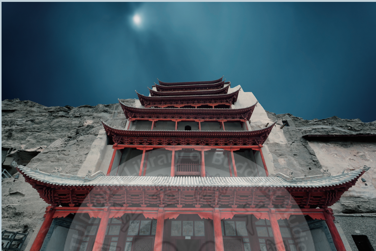
莫高窟系列一洞窟

流淌在她身上的敦煌藝術文脈；「流」就是因應時代生活創新與發展的藝術設計。她，宛如敦煌圖案解密人，在人民大會堂宴會廳、民族文化宮、首都機場、燕京飯店等建築的裝飾設計都出自於她手。