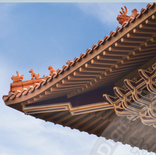
佛光大雄寶殿屋檐上的神獸