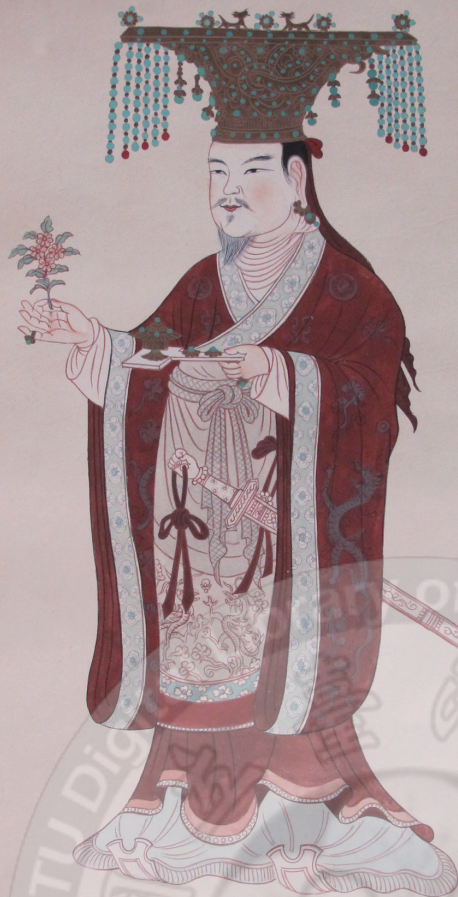
于闐國王李聖天服飾 五代98窟