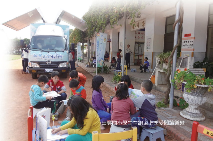
田豐國小學生在跑道上享受閱讀樂趣

閱讀為孩子打開一扇通往世界的窗。雲水書車開進來，讓田豐的孩子視野跨出去，雲水書車的到來，田豐的孩子多了一項閱讀管道，也多了一份閱讀的幸福。