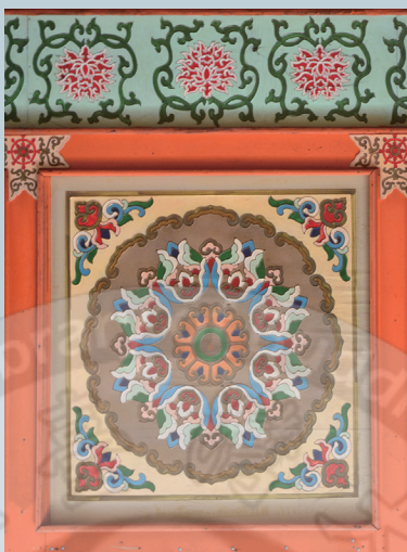
佛光大雄寶殿—藻井