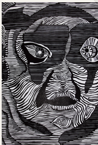
面紋 林孟樺109X78.6cm 木刻版

參展作品，各有自我的思考模式與理念，因此在主題的選擇與媒材運用上亦有所不同，使其作品展現豐富性與多元性，也因為每個作品理念都不同，藉由展覽空間發表發想，讓觀者在觀看時有相當大的想法〈空間〉，他們也從多次展覽及艱難藝術中找出空隙，脫穎而出！共同體現對於藝術的熱情與生命力，讓眾人皆知，創作是無時無刻、突破自我，並找尋自我風格，使我們勿忘喜愛藝術的創作，再次的尋回純真的感動。