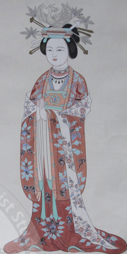
于闐國皇后曹議金服飾 五代98窟