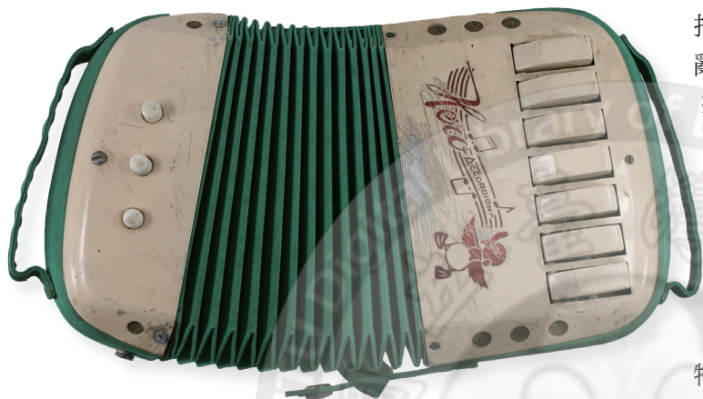
民初進口迷你手風琴