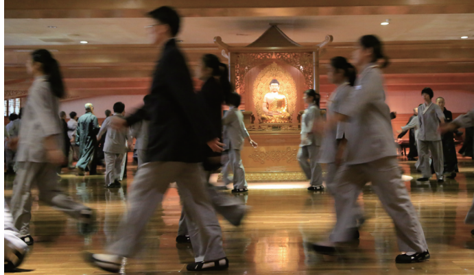
叢林學院學生於佛光山禪堂，禪修跑香

第二次，望著前面的背影，腦袋一聲「追過去！」當下驚醒自己，此次慢慢地跑著，沒有第一次的衝勁，歸位打坐，不斷詢問自己：「到底在追什麼…」想要立刻找到答案。「追什麼…」沉澱後有了解答，原來是內在的瞋恨心、是不耐煩別人的