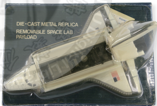
美國航空暨太空總署太空梭模型機

捐贈者之母親於1984年前往美國時，恰逢太空梭第三艘發現者號出廠，以紀念航空歷史，個人購入此模型作為珍藏。時隔數十年，太空梭已走入歷史不再執行任務，現代人們也逐漸淡忘曾經扮演著地球往來太空的交通工具。因應佛陀紀念館地宮珍寶徵集，特將此一具有歷史性的模型機捐贈出來，盼後代子孫更能體會二十世紀人類的太空科技發展。