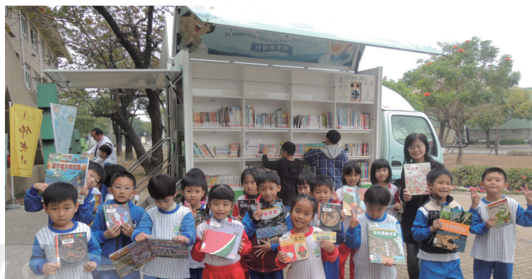
要拍大合照囉！誰還這麼認真在看書啊？