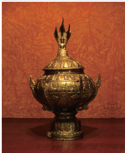
(上)龍王拜觀音(下)泰國水鉢—佛光山寶藏館典藏