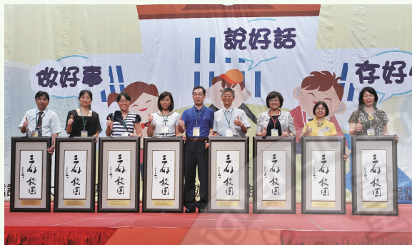
2011年第一屆三好校園實踐學校表揚在佛館大覺堂舉行

星雲大師歷年來倡導三好運動—做好事、說好話、存好心，在校園扎根品德教育均見其成果，海外如曼徹斯特、菲律賓、多倫多、韓國也曾向佛光山取經。