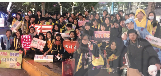
景文高中學生跨年夜「減」垃圾，將愛地球的心化成實際行動