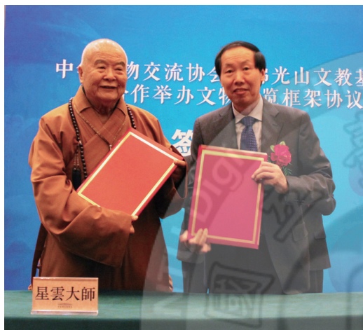
星雲大師與國家文物局局長劉玉珠共同簽訂五年合作計畫

佛首回來的意義，不但說明海水隔斷不了兩岸的文化、歷史，隔斷不了我們的血源關係；當然，也隔斷不了佛首、佛身的合璧。——星雲大師