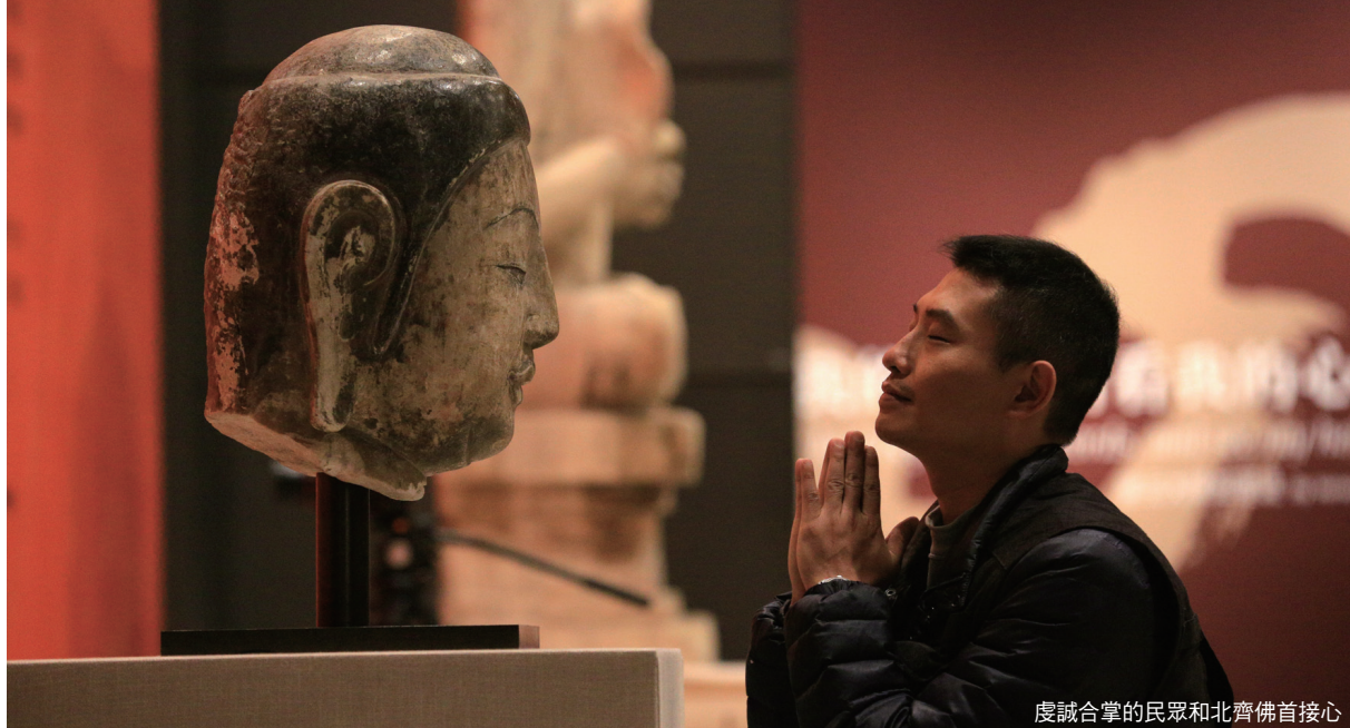
虔誠合掌的民眾和北齊佛首接心

「我可以」，充滿對自我的信心。「希望這一次金身合璧，不但讓佛像合璧，也讓兩岸因緣更加和平。」