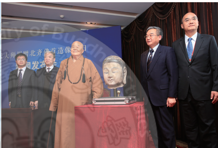
星雲大師親自護送北齊佛首回歸，並於北京首都國際機場舉行記者會

「星雲大師捐贈北齊佛首造像回歸儀式」3月1日在中國國家博物館舉行，佛光山開山星雲大師、中國文化部部长雒樹剛、中央台辦主任張志軍、國家文物局局長劉玉珠、國務院僑辦副主任譚天星、國家宗教局副局長蔣堅永、河北省副省長姜德果、中國佛教協會會長學誠法師等出席回歸儀式。此外，中華文物交流協會亦與佛光山再續前緣，簽定未來5年將再於佛陀紀念館展出更多中華文物珍寶。