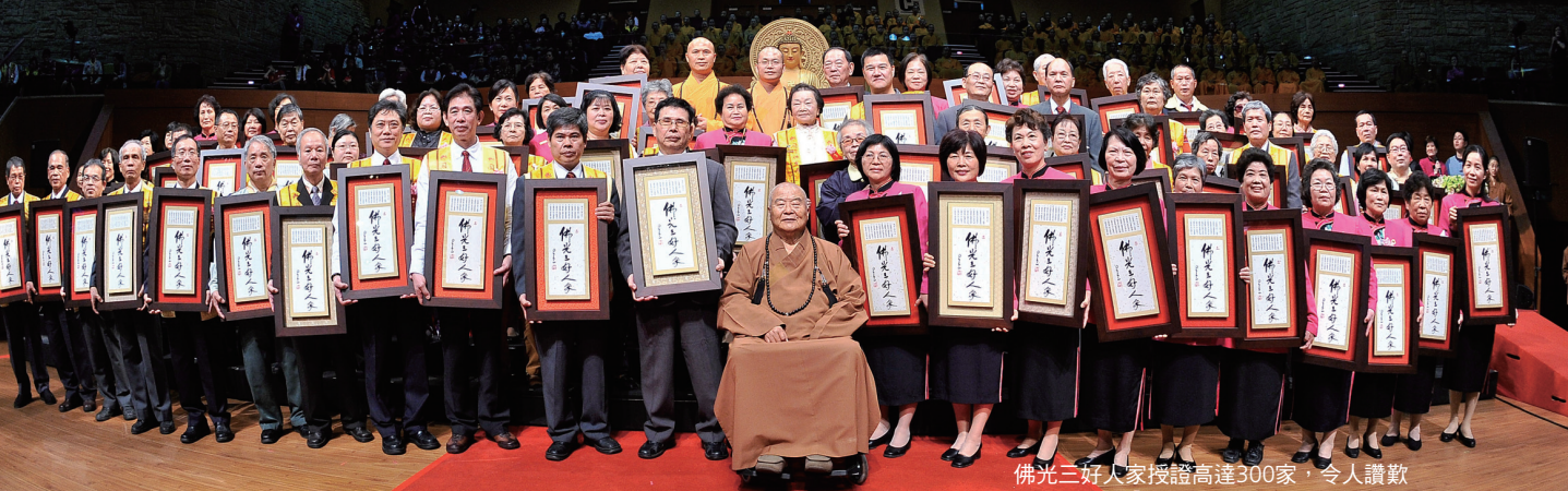
佛光三好人家授證高達300家，令人讚歎