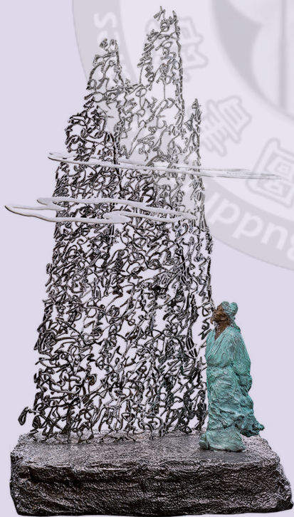
行雲 許文融／不鏽鋼・青銅