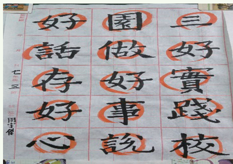
瑤公國中開設書法課，讓學生從三好修身養性

臺南南台科技大學舉辦〈南台校歌〉暨〈三好歌〉創意演唱比賽，學生多才多藝，組成樂團，透過歌唱快速連繫情感，不但有導師相伴，台下學生也頻頻舞動。參賽學生表示：「透過練習與比賽，重複體會歌詞意涵，了解『做好事、說好話、存好心』對學生的好處，感謝學校舉辦這類活動。」