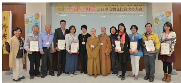
「人間三好」2015華文徵文比賽評審團

1998年，星雲大師首次與全民共同宣誓「三好運動」，推廣至今，廣受社會大眾肯定，繼而2011年推動三好校園及三好人家。如何做到身口意三業清淨？大師說：「第一好是說好話，從心中讚歎別人，每天至少要對家人、朋友說幾句讚歎的話。第二好是做好事，結善緣。第三好是大家存好心，做自己的貴人。」十多年來，從佛光山及全球各道場、國際佛光會乃至深入社區，諸如舉辦了夏令營、徵文徵畫、體育活動等翻轉教育的實踐，而今「三好」已成為全民運動了。