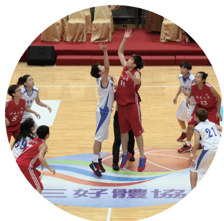
三好體協透過比賽推廣優質的運動精神

1998年，星雲大師首次與全民共同宣誓「三好運動」，推廣至今，廣受社會大眾肯定，繼而2011年推動三好校園及三好人家。如何做到身口意三業清淨？大師說：「第一好是說好話，從心中讚歎別人，每天至少要對家人、朋友說幾句讚歎的話。第二好是做好事，結善緣。第三好是大家存好心，做自己的貴人。」十多年來，從佛光山及全球各道場、國際佛光會乃至深入社區，諸如舉辦了夏令營、徵文徵畫、體育活動等翻轉教育的實踐，而今「三好」已成為全民運動了。