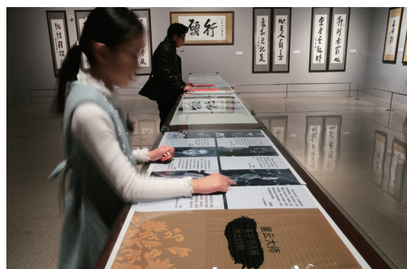
民眾駐足細觀，感受星雲大師一筆字的意涵

隨後，大師與雒樹剛、張志軍共同為回歸的釋迦牟尼佛佛首造像揭幕。劉玉珠局長也頒發國家文物局感謝狀，感謝大師無相布施，雙方分別代表中華文物交流協會與佛光山文教基金會，共同簽署《關於合作舉辦文物展覽的框架協議》，延續過去5年良好合作基礎上，未來5年雙方合作將繼續深化。從2017年至2021年展覽主題含蓋佛教、文化、藝術、建築、民俗等多方面，交流合作的空間將更廣闊，增進臺灣民眾對中華文化共同的參與性。