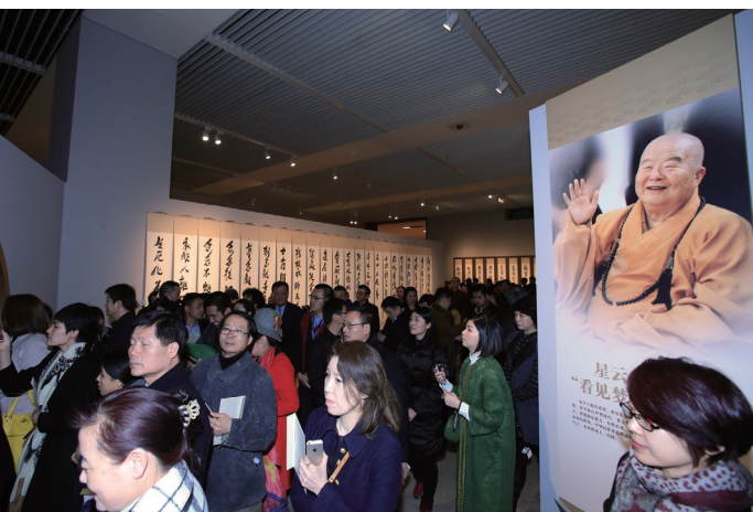
中國國家博物館展出「佛光菜根譚—星雲書法展」看展人潮絡繹不絕

此展將中華傳統文化的書法藝術，結合佛法義理，傳達普世認同的道德觀，252幅作品，幾乎都是對聯、長卷，希望觀眾藉由展覽，從書法中體會佛法為人生帶來的智慧，字字句句皆是星雲大師一生至真至善至美的展現。