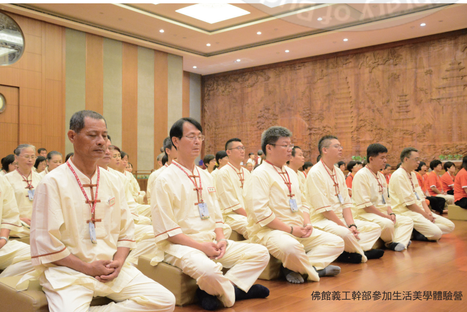
佛館義工幹部參加生活美學體驗營

一年來擔任義工期間，為自己創造了許多人生中的第一：第一次感到在佛館服務的日子如此多采多姿；第一次擔任導覽工作（雖然有些手忙腳亂）；第一次瞭解如何學佛成佛（我是佛）；第一次可以