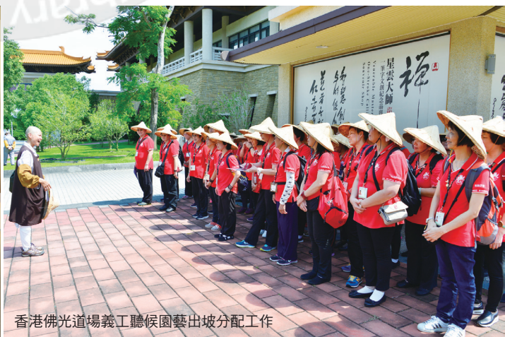
香港佛光道場義工聽候園藝出坡分配工作