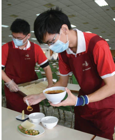
青年義工行堂做得很歡喜