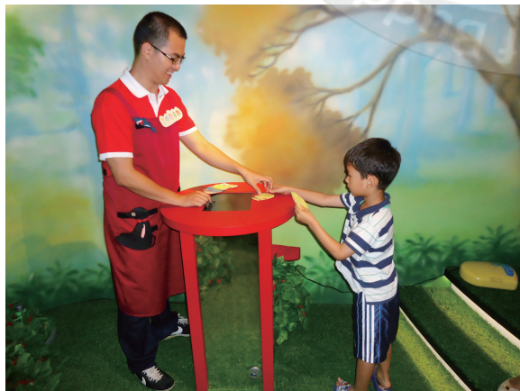
用心服務，彼此沒有距離

從佛光會分會卸任會長後，接受義工團義工培訓，選擇到佛館值勤服務大眾，館方也開辦各種專業課程，讓我們學習更多，諸如開幕、展覽布卸、