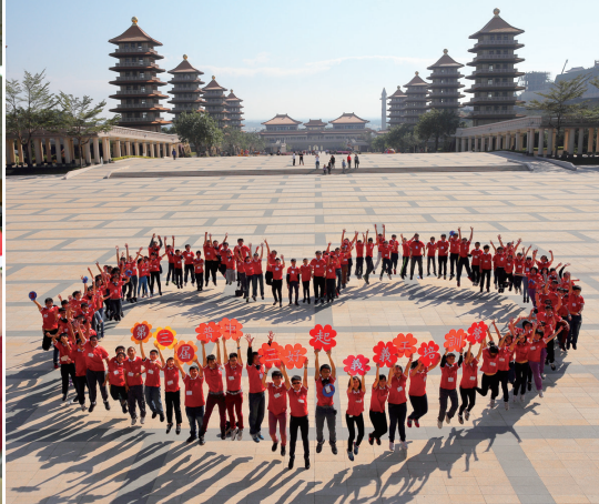
三好起義義工培訓營在佛館大合照