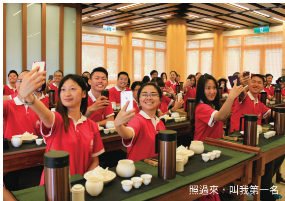
照過來，叫我第一名