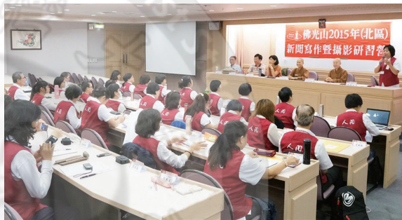
透過分區舉辦新聞寫作暨攝影研習營，增強義工記者專業知能

為落實星雲大師「廣作文宣」的宏願，成就「網路就是道場」的使命，人間社招募社會各界人士及分布全球各地的佛光人，擔任全球義工記者團隊，透過文字般若或圖像拍攝及舉辦各項活動為弘法利器。每年聚會舉辦培訓課程，期以「文字有力量，下筆有分寸」為圭臬，讓義工記者提供深具專業知能、堅守客觀專業的優質報導，傳遞即時、豐富、契合真善美的新聞，讓世界看到台灣，同時也帶領民眾拓展國際視野。