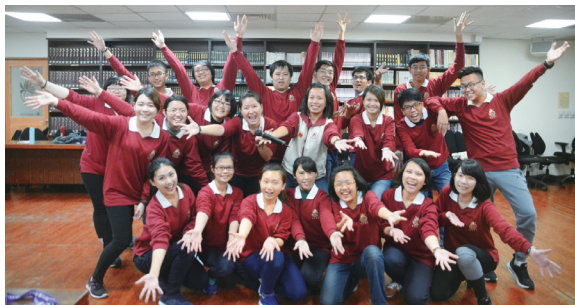
中華佛光青年總團主辦2016佛光祖庭宜興大覺寺菩薩義工行

另外，佛光會中華青年總團義工在春節期間飛往佛光祖庭宜興大覺寺，帶著台灣佛教青年的熱力，與大陸各省份的青年共慶新年。擔任義工期間，青年們分別支援各單位出坡、投入雲水書車整理及三十三觀音像布展、十供養布置、除夕圍爐晚會表演及主持，花車及布偶遊行、接待、香燈、典座、行堂、洗碗等工作，青年義工在彼此合作下同為兩岸佛教的交流注入新世代的泉源。