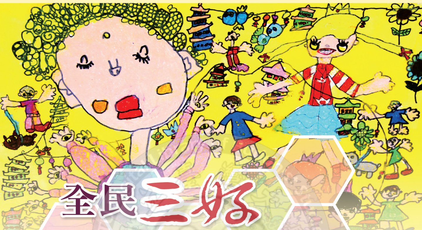
佛光心花開 幼兒組 佛光獎 林鈺書