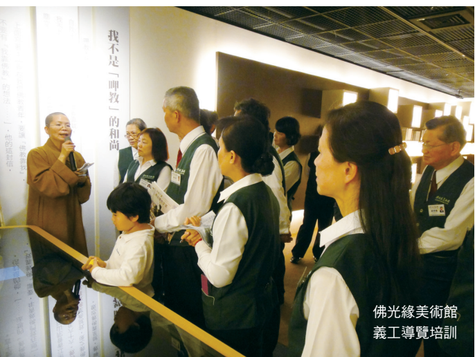
佛光緣美術館 義工導覽培訓

學子在義工服務過程中，眼裡不再只是時數認證，而是從服務中學習養成良好習慣、建立正確知見、促進家庭和樂、增進人我和諧，在服務中不斷力行三好，而學得感恩他人、改變自我，讓公益的人生從此化為成功的資糧。