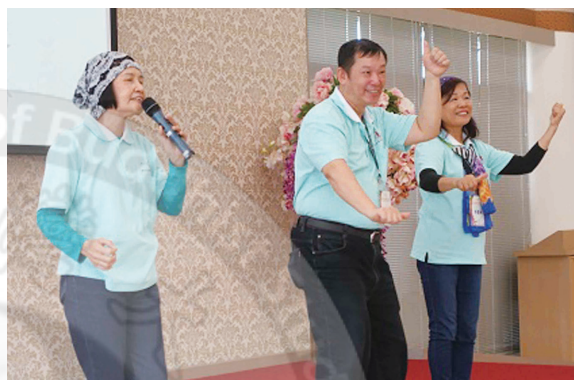
慈悲義工參與活動中不分年齡，表演活力十足

9月10日佛光山港澳總住持永富法師帶領「香港義工尋根之旅」280多人，在佛館各區大展身手服務奉獻，歡喜無限，這支團隊也是人間佛教的義工表率。另在佛光山慈悲社會福利基金會，