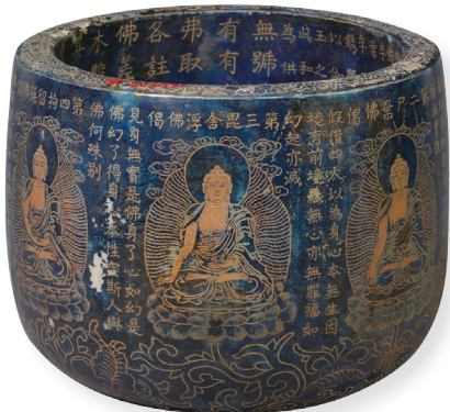
清 銅 座長12釐米、座寬9.1釐米、通高20.2釐米 承德市外八廟管理處藏

此尊無量壽佛銅鑲金製成，頭戴花冠，束髮高髻，兩縷髮辮隨肩臂而下。寬額豐頤，眼瞼略低垂，高鼻薄唇，面容和熙，雙耳綴花形耳璫垂及雙肩。上身半裸，細腰，佩飾瓔珞、釧鐲。下身著長裙，衣褶處理轉折起伏流走自然，頗為灑脫生動，上飾蓮花，富有很強的裝飾性。雙手結禪定印，上托一長壽寶瓶，全跏趺坐於台座之上。台座為覆門形，中間鏤空，四角飾變形蓮花紋，平穩秀雅。像後有葫蘆狀火焰紋背光，銅鑲金厚重敦實，金碧輝煌，頗顯皇家氣派。