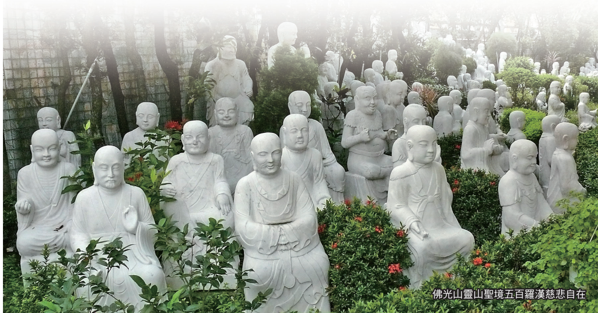
佛光山靈山聖境五百羅漢慈悲自在