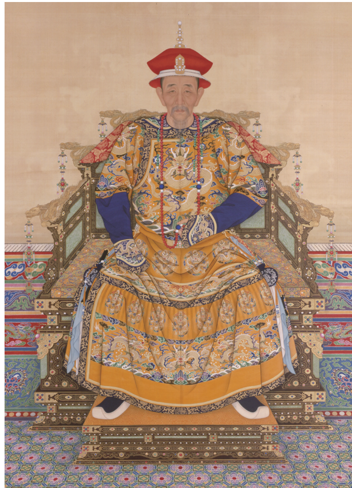
清人畫玄燁朝服像軸

在清朝的皇帝中，康熙最開放，對於宗教是寬容的，從漢傳佛教或滿洲的藏傳佛教、薩滿教、道教，也常聽天主教傳教士講道，因皇子信仰基督作為爭權奪利的工具，遂有抵制而爆發中國禮儀之爭。康熙也是學貫中西的一位皇帝，代數、幾何、天文、醫學等方面的知識頗有著述。