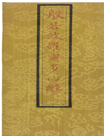
清光緒三十年 紙 縱22.7釐米、橫9.5釐米、厚1釐米 北京故宮博物院藏