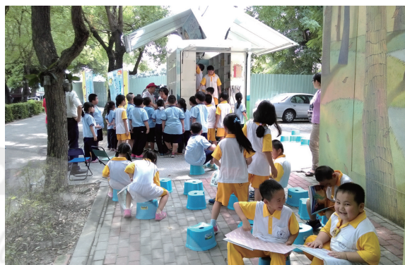
書車來到村東國小，增加學童閱讀的樂趣

當天的最後一堂課，一位原本雙手握拳、面帶怒色，顯得坐立不安的小男生，由班導師陪伴著靠近書車。當他開始翻閱他人生中的第一