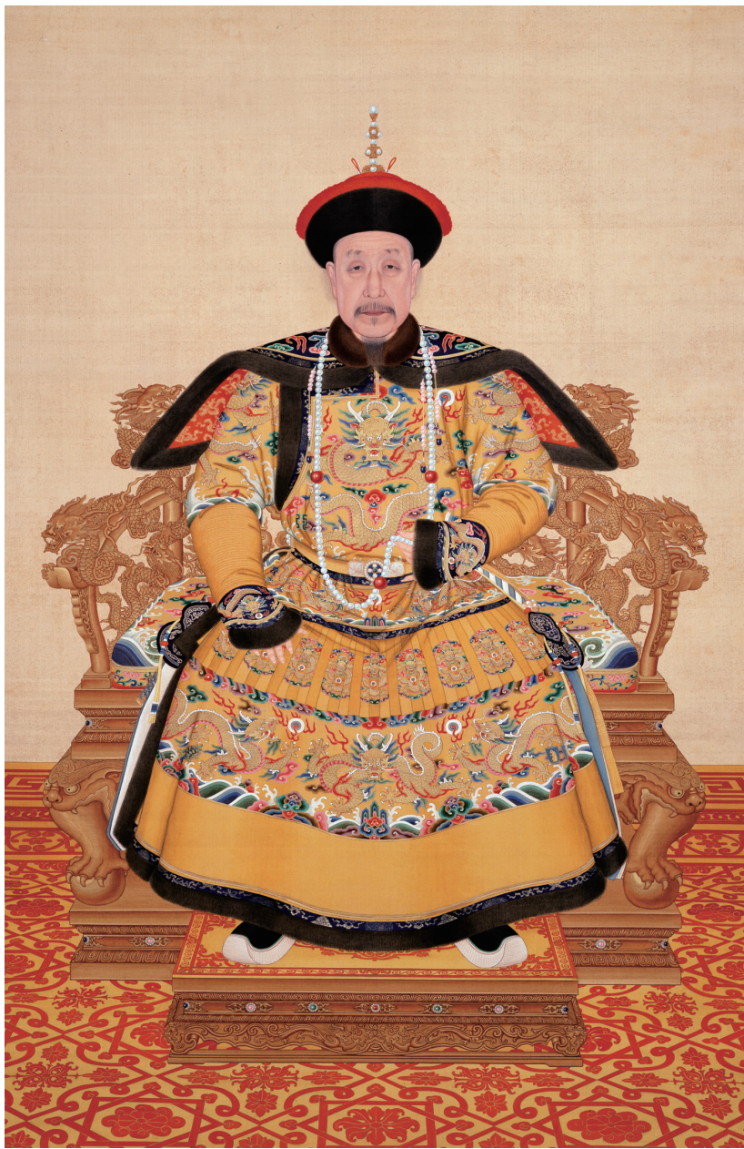
清人畫弘曆朝服像軸

坐落在紫禁城東北角的寧壽宮花園，俗稱乾隆花園，是清朝乾隆三十七年（1772年）到乾隆四十一年（1776年）改建寧壽宮時，乾隆皇帝給自己退位做準備，親自指揮修建的宮中之園。從樓閣、假山、亭台、曲水、佛堂、書屋、戲台等都能感受到乾隆皇帝追求文雅生活、信仰佛教的精神世界。走進了這座花園，映入眼簾的是《清人繪弘曆朝服像軸》，這是乾隆皇帝晚年時期的肖像，他端坐在龍椅上，老邁的面容依然保持著沉穩睿智和威嚴靜穆的氣度，讓人彷彿穿越時空，走進了乾隆皇帝的內心世界。