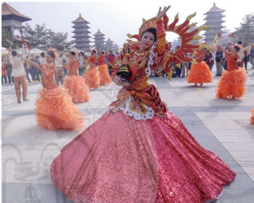
Filipino representatives with the statue of Santo Niño at “When Buddha Meets the Gods” event in 2015

“When Buddha Meets the Gods” event is held on 25th December every year at the Buddha Museum. Last year,