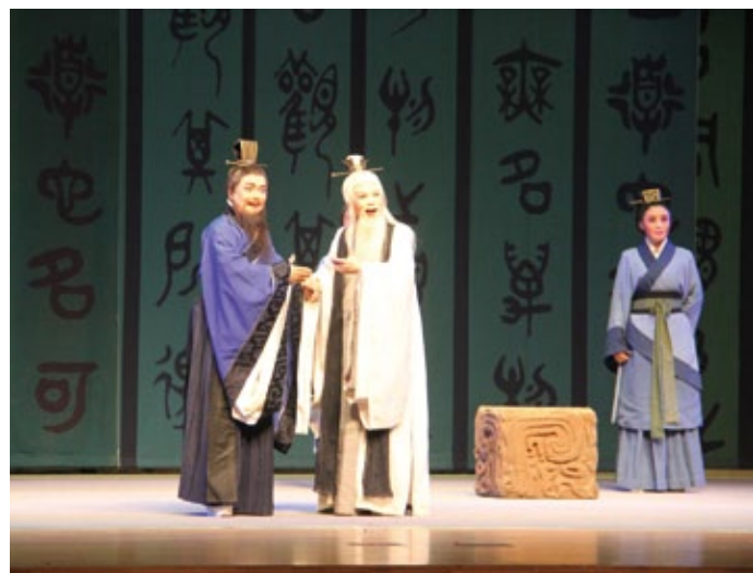
第六亮點—河南越調劇團《老子》演出

七、配合世界神明聯誼會，佛館本館展出「遇見・修鍊・重現—臺灣宗教遺產保存修復特展」，文化部文資局運用科學方法與修復技術，對宮廟建築、神明、彩繪