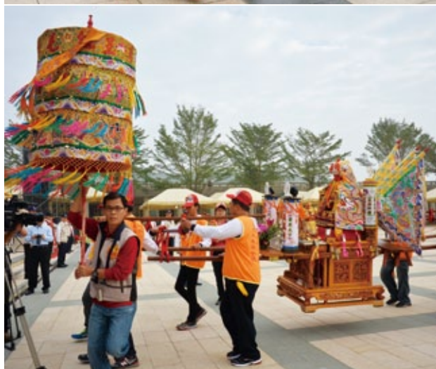
第五亮點—精彩的陣頭表演

四、12月25日世界神明聯誼會當天，佛館推出禮敬諸佛巡禮（集印點：觀音殿／金佛殿／大佛平台／玉佛殿禮拜佛牙，領取平安符）。