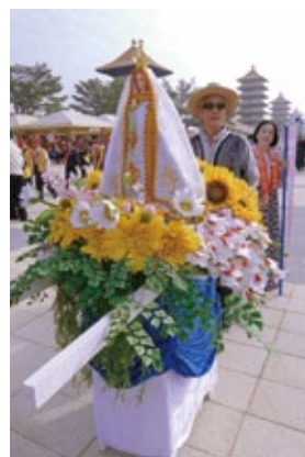
菲律賓 Santo Nino Church 聖母

我主張「同中存異、異中求同」。在「同」的裡面，宗教的目標一致，都是勸人向善；但是「同」中也有「不同」，各個宗教各有教義，彼此說法也有不同。如同你要到台北，可以搭乘不同的交通工作，不論坐飛機、高鐵、火車、汽車，都能抵達，但功能性不同，宗教也是一樣。