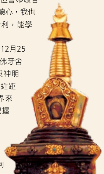
佛陀紀念館鎮館之寶－佛牙舍利

2016年世界神明聯誼會12月25日，當天上午六點將迎請佛牙舍利下來，為期七天讓參與神明聯誼會的信眾，都有機會近距離瞻仰佛牙舍利，全世界來到佛館的遊客都要好好把握這珍貴的因緣。