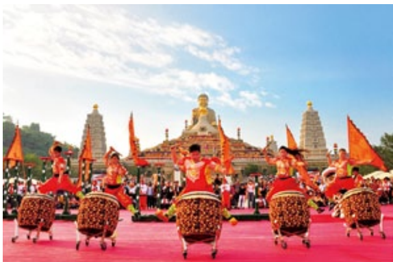
神明聯誼會之美—鑼鼓喧天

除了神尊、宮廟、陣頭表演與隨香信眾的殊勝，神明聯誼會當天中午，至少有二萬五千人用餐，如果加上慕名及擁護活動的遊客，總人數恐怕要衝過五萬人，光是用餐數人數就刷新歷年紀錄。