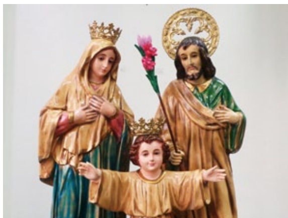
菲律賓天主教堂的聖嬰、聖母瑪利亞、聖父耶穌一家

神尊超過二千尊，兩岸世界級的媽祖廟、大陸關聖帝君祖廟以及諸多祖廟主祀神尊都會法駕佛館會香，玉皇上帝、玄天上帝、神農大帝、三官大帝、天上聖母、瑤池金母等諸多神