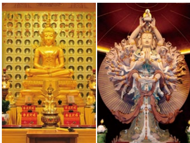
第四亮點—禮敬諸佛巡禮—金佛殿、觀音殿