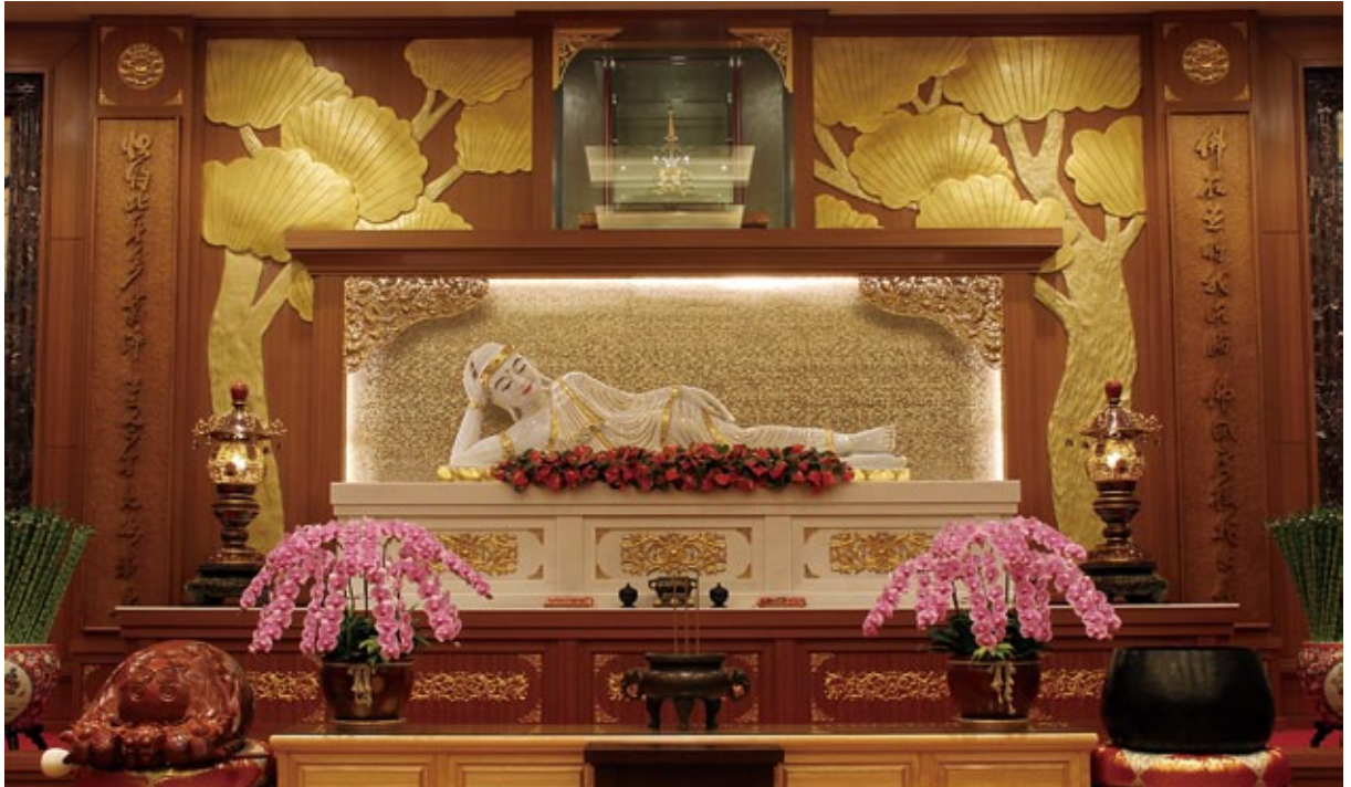
第一亮點—玉佛殿的佛牙舍利迎請下來供社會大眾瞻仰禮拜

除了神尊、宮廟、陣頭表演與隨香信眾的殊勝，神明聯誼會當天中午，至少有二萬五千人用餐，如果加上慕名及擁護活動的遊客，總人數恐怕要衝過五萬人，光是用餐數人數就刷新歷年紀錄。