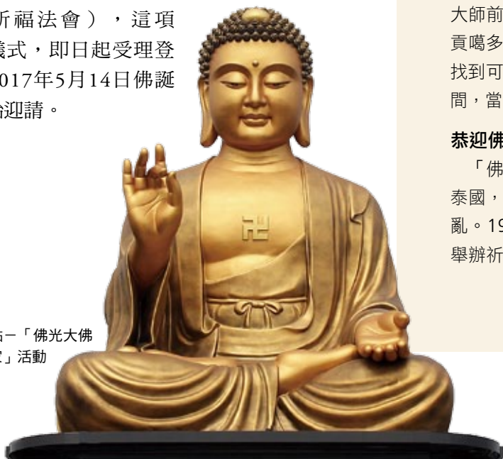
第三亮點－「佛光大佛分香我家」活動

三、「佛光大佛分香我家」活動（每年於農曆2月1日為期一週，佛光山信徒香會時，將分香的佛像請回佛館，參加祈福法會），這項分香儀式，即日起受理登記，2017年5月14日佛誕節開始迎請。