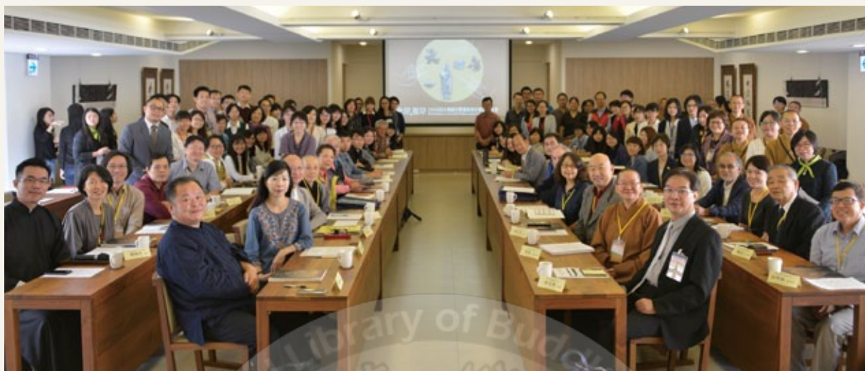
此岸・彼岸—亞太地區宗教遺產保存修復研討會之大合照

做得更細化。可移動的文物，溫濕度可以慢慢研究，但不可移動的文物，才是要去保護的，用現代科學檢測以比例、量化、多少克，記錄下來更精準供後人參考。