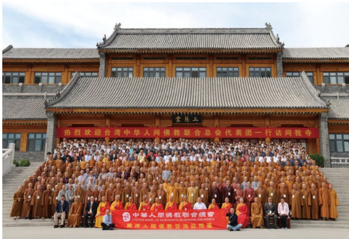
中華人間佛教聯合總會造訪北京龍泉寺，交流寺院管理與弘法經驗，於龍泉寺三慧堂前合影

教派要尊重、佛教界應該共尊男女平等的主張、對重視青年培養人才的共識、對信仰傳承要有共識……在開放上，如：佛教的門戶要開放、思想見解要開放、在家眾弘法講說要開放、對於各宗派人事要開放、開放兩岸佛教交流……。