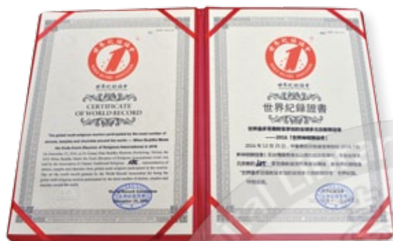
世界紀錄證書／ 世界最多宮廟教堂參加的全球多元宗教聯誼會