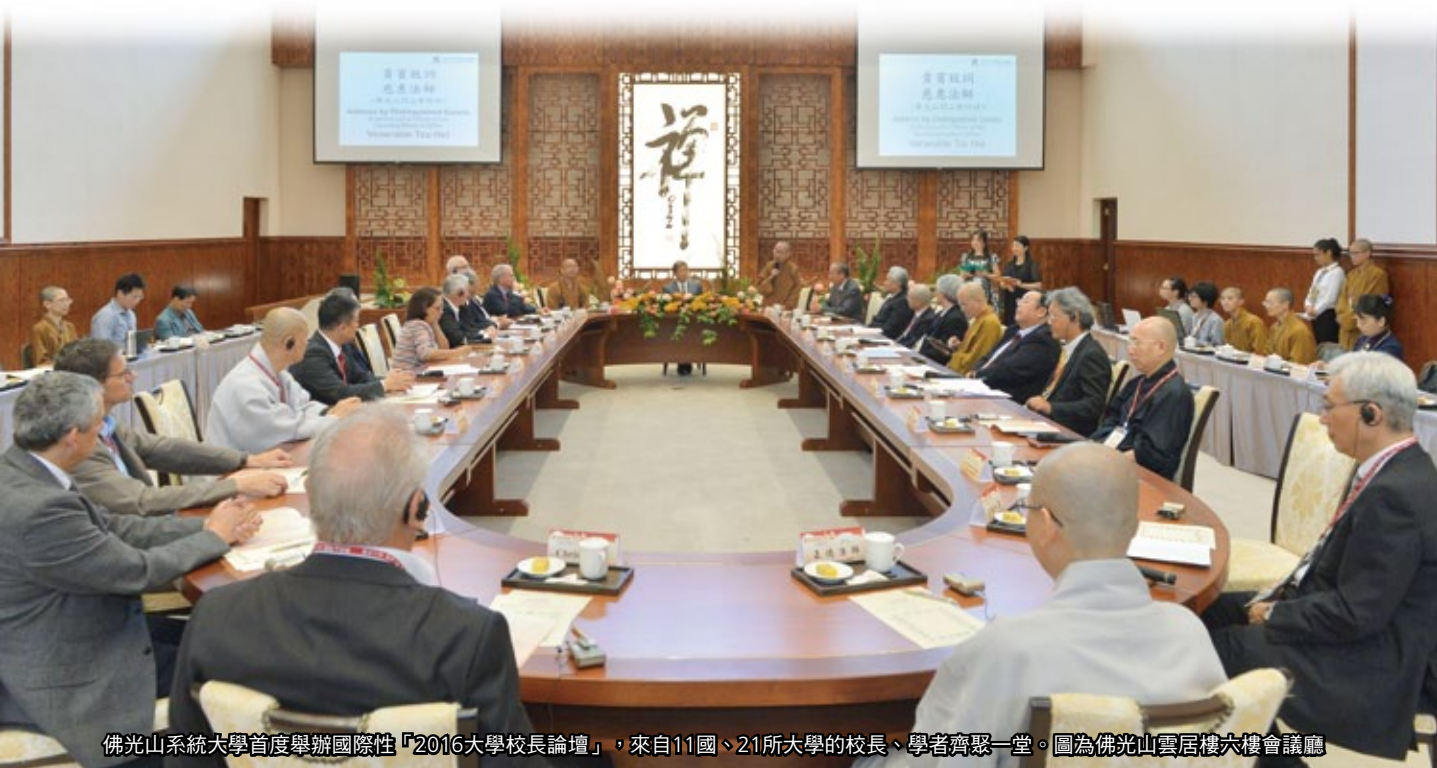
佛光山系統大學首度舉辦國際性「2016大學校長論壇」，來自11國、21所大學的校長、學者齊聚一堂。圖為佛光山雲居樓六樓會議廳

兩岸的文化交流，依然熱絡不減。二〇一五年，北齊佛首金身合璧之後，在佛光山供奉半年，於二〇一六年二月將佛首捐贈回歸大陸。在北京首都機場，大師對出席記者會的國家文物局副局長劉曙光、河北省文物局局長張立方等領導及兩岸三地近三十家媒體、六十位餘記者說：「佛首在海外流浪二十年，現在經由台灣回歸大陸，意義很重大。中國人要記住，我們的文化、歷史、血緣關係是分不開的，如同虛空欣不斷，海水難隔離……。」