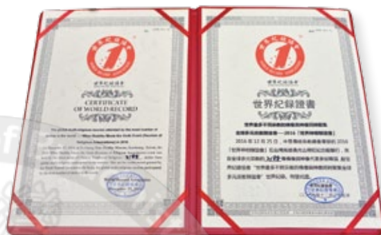
世界紀錄證書／ 世界最多不同宗教的佛像與神像同時聚集全球多元宗教聯誼會

創世界紀錄！由中華傳統宗教總會主辦、佛光山佛陀紀念館承辦的「2016世界神明聯誼會」12月25日在佛陀紀念館舉行，現場不只吸引海內外逾10萬名信眾參與這場有史以來最盛大、多元的宗教嘉年華會，更經過「世界紀錄協會」正式認證，創下685間宮廟、教堂參加；2188佛像、神尊共襄盛舉的世界雙紀錄，寫下2項世界第一，締造難能可貴的「宗教奇蹟」。