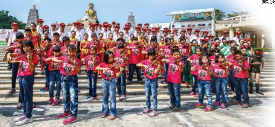
「雲水書坊—行動圖書館」與海鷗叔叔陪同南希望弦的小朋友共同迎向未來

另外，佛光山人文教基金會還配合教育部推動的「生命教育推動方案」融合三好理念，規劃一系列「三好生命教育教材」，未來會加強圖書的「人間性」、「時代性」及「生活性」來編製青少年讀物。這些照顧或選擇的提供，不只為減少社會問題，更可能在翻轉偏鄉孩子人生的同時，也翻轉這個社會的濁惡為清淨，為光明與富強國家的未來鋪路。