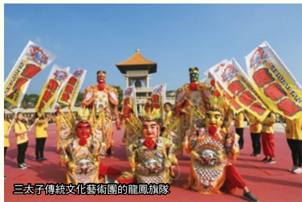
三太子傳統文化藝術團的龍鳳旗隊

各宮廟與陣頭隊伍集聚佛館以各式陣仗如哨角隊、鑼鼓隊、電音三太子的響亮樂聲，震天價響。菲律賓聖嬰團則精心準備〈We are one〉演奏及歌舞演出，多元的文陣、武陣的陣頭表演，綿延數公里，宛如一場熱鬧的宗教嘉年華會。