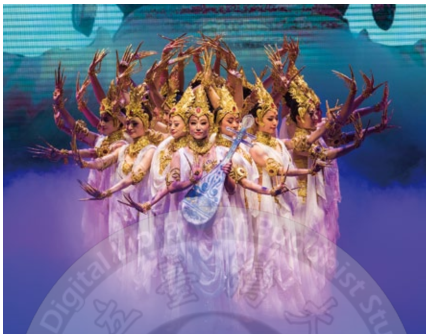
甘肅省歌舞劇院在佛館演出的中國經典舞劇《絲路花雨》

除此，文化交流上最具體的成果，則是於佛陀紀念館一季一季不斷舉辦的展演活動，如：京津冀佛光山文化月；吳韻漢風·精彩江蘇——江蘇非物質文化遺產精品展；北京技工院校中青年工藝美術大師——燕京八絕作品展；由甘肅省歌舞劇院演出的中國經典舞劇《絲路花雨》……。