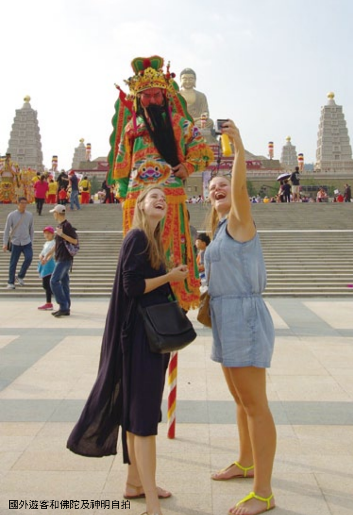
國外遊客和佛陀及神明自拍