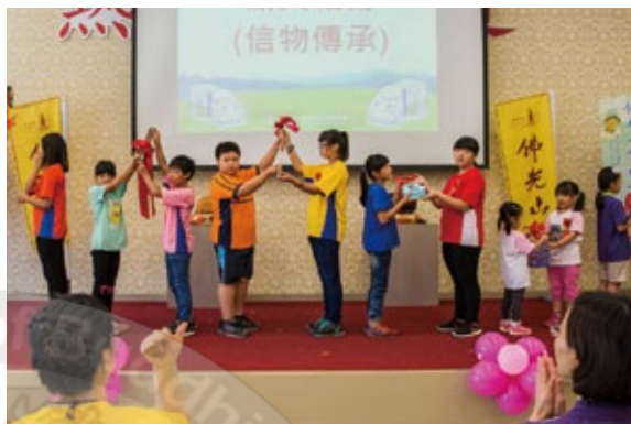
偏鄉學校聯合畢業祝福典禮「薪火相傳」

這些年來，雲水書車舉辦了各項可讓孩子因閱讀而看見幸福的活動，包括舉辦兩屆「我愛閱讀」的兒童徵文徵畫暨新詩創作活動、人間三好華文徵文比賽等，鼓勵孩子以文章、詩及繪畫展現他們因閱讀產生的想像世界。另外還為偏鄉學校舉辦夏令營來延續孩子的閱讀習慣，讓他們將書中的故事以口說出來，從而內化為他們的價值觀。許多孩子因此或者從書中獲得解決日常生活中的問題，或從書中找到未來的志願，至少也都能在海鷗叔叔表演的魔術裡得到快樂，從義工的身教上得到啟發。點滴光明，照亮偏鄉欠缺資源的晦暗。