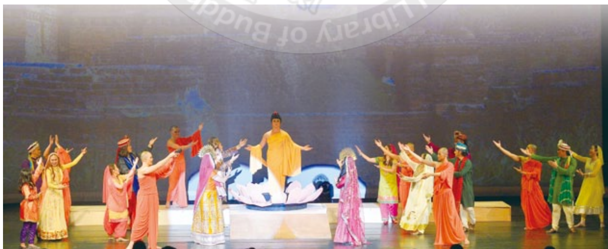
菲律賓藝術學院2015年在佛館大覺堂演出〈悉達多太子〉音樂劇

從一月開始，大師在《人間福報》陸續發表的《人間佛教佛陀本懷》的文章，也在五月結集，中英文一起出版，簡體字版也於八月於大覺寺發表，由大陸人民出版社、宗教文化出版社聯合出版。在這本書裡，大師以「佛陀的人間生活、人間佛教的根本教義、佛教東傳中國後的發展、