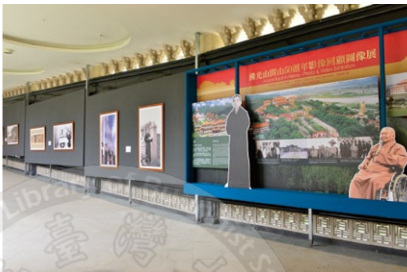
佛光山開山50週年影像回顧圖像展

還有，於本山、佛館、世界各道場同步舉辦「影像回顧圖像展」，展示五十年的弘法足跡，也是頗具歷史價值。另外，由宗委會主辦、佛光緣美術館策畫，將大師的一筆字書法，從七月一日起，在全球十九個國家、海內外七十三個展覽館、美術館、博物館同步展