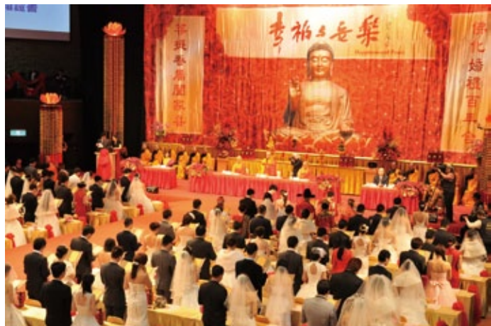
Mass wedding held annually at the Great Enlightenment Auditorium on the first of January

and birthday. Through these celebrations, ties between people in various circles, including families, schools, friends, and even the workplace, are cemented.