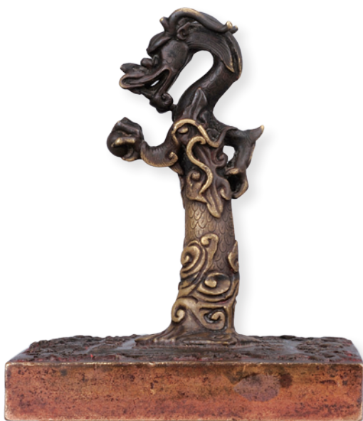
地藏菩薩龍鈕銅印