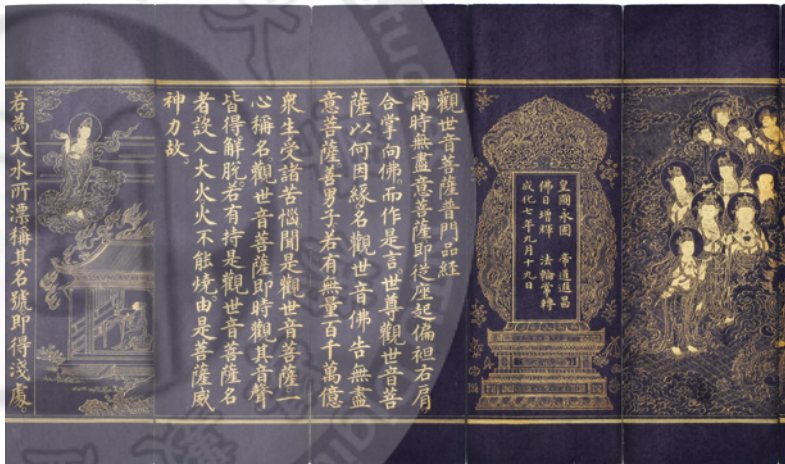
《觀世音菩薩普門品經》折

唐宋時期，安徽各地佛寺林立，嶽西資福寺塔、無為磚塔、壽縣報恩寺、潛山太平塔等，各地地宮出土的金棺、舍利子、玻璃瓶、瓷器、經卷等佛教聖物都反映了這一時期佛教的興盛和佛教藝術的輝煌。