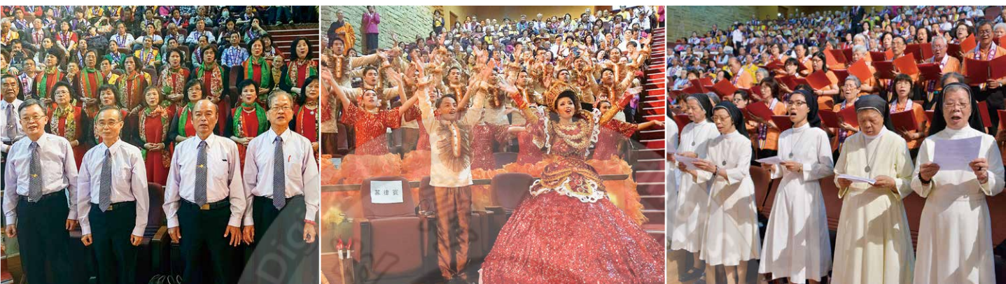
各個宗教演唱聖歌以表達愛與和平的精神