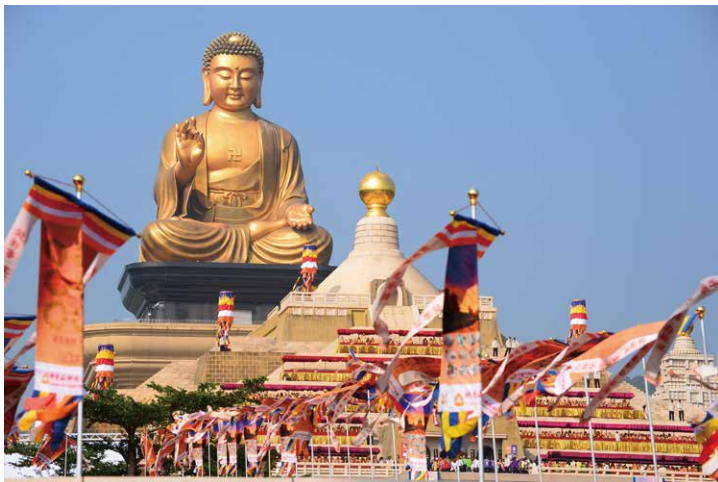
Humanistic Buddhism propagating love and peace

Prayers, they will express their enthusiasm toward world peace. This event will become a gathering where all religions can transcend borders through love and peace.