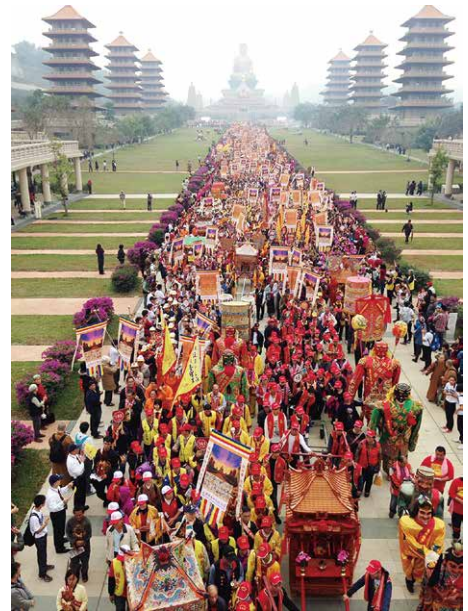
Over 10,000 devotees in attendance

This year, Catholic representatives from the Basilica of the National Shrine of Our Lady Aparecida and Roman Catholic Archdiocese of São Paulo in Brazil, as well as Taoist representatives from Jenjarom Ban Siew Keng Temple in Malaysia, Islamic leaders from the East London Mosque from the United Kingdom, and Jewish representatives from France will participate in the event. At the Love and Peace Concert of