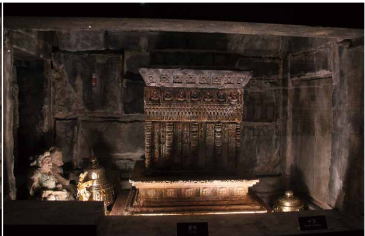
佛館地宮還原模擬