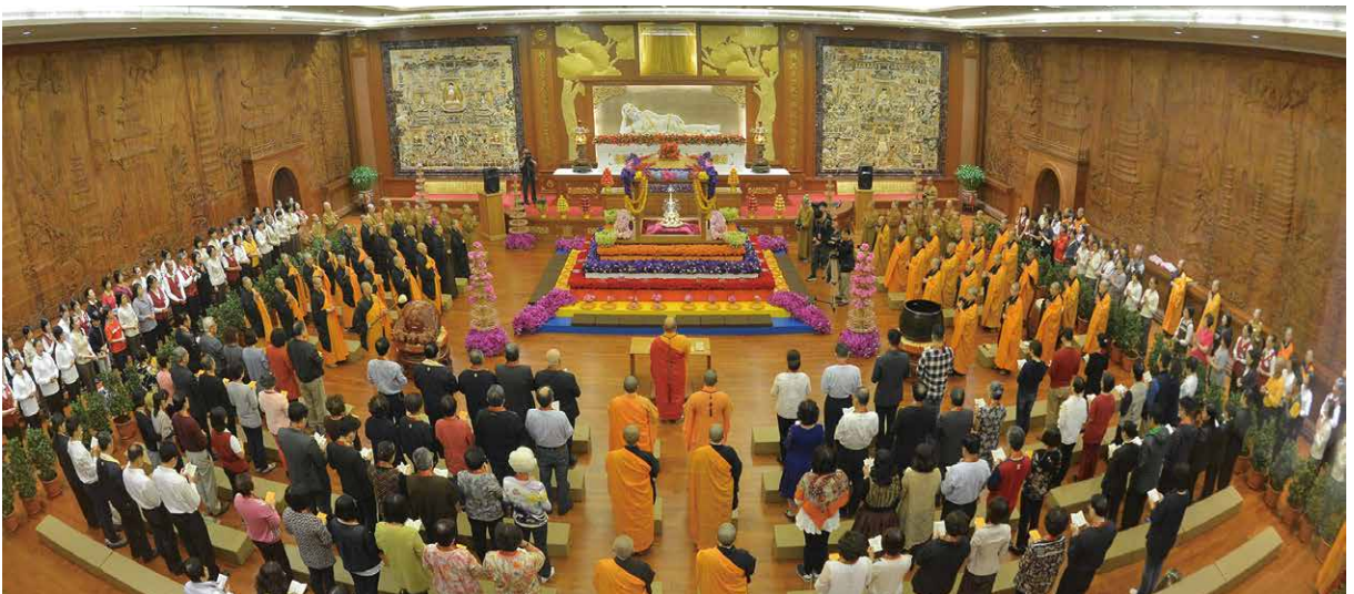
禮拜佛陀真身舍利

更為殊勝的禮佛亮點，12月25日當天在佛館玉佛殿07:00-18:00開放給社會大眾入殿「禮拜佛陀真身舍利」，可謂人身難得今已得，佛法難聞今已聞，大家可藉由此盛會給自己人生留下難忘的記憶。最後，13:30-14:30於菩提廣場舉行「國泰民安祈福法會」，在佛光山寺住持心保和尚偕同各大宗教代表及所有參與的數萬信徒民眾齊心虔敬祈福，在啟程回鑾時讓所有宮廟教堂將國泰民安、社會和諧、世界和平的願力帶回去，來年再共相聚、共祈願，共同聯誼。