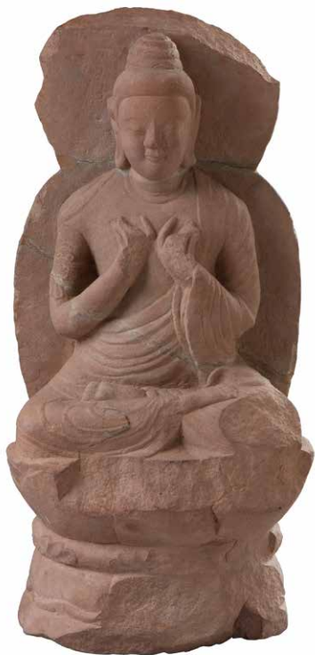
石雕釋迦牟尼佛坐像

以「建國聖源」阿嵯耶觀音為主角，講述佛教對於南詔政權的重要意義。結合史料和傳世文物，解讀了阿嵯耶觀音的身世之謎，認識到中原佛教文化對大理地區影響深遠。