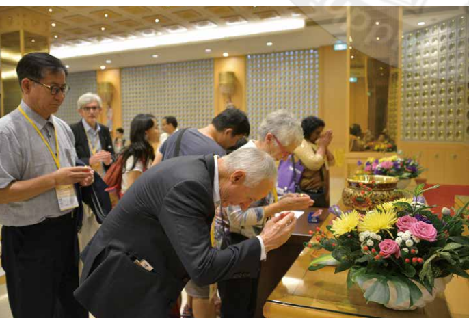
Lamp offering at the Golden Buddha Shrine

After the tour, the delegates were greeted by Venerable Master Hsing Yun at the International Conference Hall. Venerable Master said that he has come to know about Buddhism through his grandmother and has dedicated his whole life to monasticism. Though he has never received full education, he has a role model -- Confucius. The teaching of Confucius has a huge influence on his life. He compared all university presidents to Confucius, and encouraged all delegates to interact with one another in order to actualize the ideals of education.