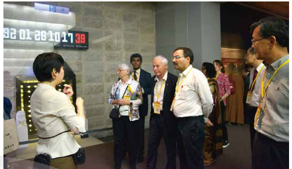
Introduction to the 48 Underground Palaces

隨後星雲大師也出席佛光樓國際會議廳，分享自小就與外婆學習佛法，至今一生所做就是和尚；雖然沒上過學，還是有尊敬的老師，那就是「孔老夫子」，孔夫子的理念、論著對他一生有極大的影響，並讚嘆校長如至聖先師孔子，希望來自各國的校長多能與山上互動，讓教育更能確實落實。