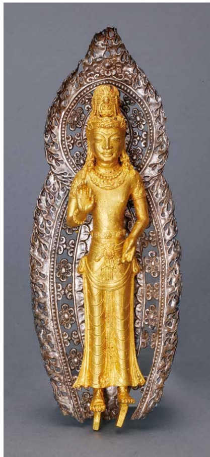
銀背光金阿嵯耶觀音立像

唐 南詔（738至902年）1990年巍山縣巍山圖山遺址發掘 殘高62釐米 寬30釐米 巍山南詔博物館藏 紅砂石質地。佛陀雙手於胸前結說法印。