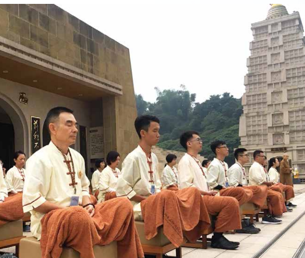
「心的旅程」新馬教師團戶外禪坐