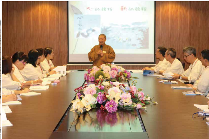
國際佛光會澳門協會參加「心的旅程」

是為了「利他」而工作，如果他也秉持這樣的理念去工作，也許有許多困難就不再是困難。他笑說「所謂修行，真的是要在人間。」