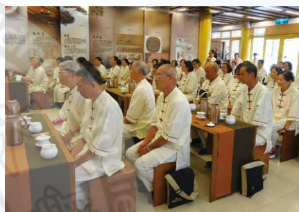
茶禪一味前的靜坐

心的聲音。「手機被收起來是好事嗎？」原來，那也是一種放下的學習。不僅如此，「呼班」、「排班」行進中，「照顧腳下，提起正念」都是自覺的表現。從放下手機的那一刻，就成功走出第一步。