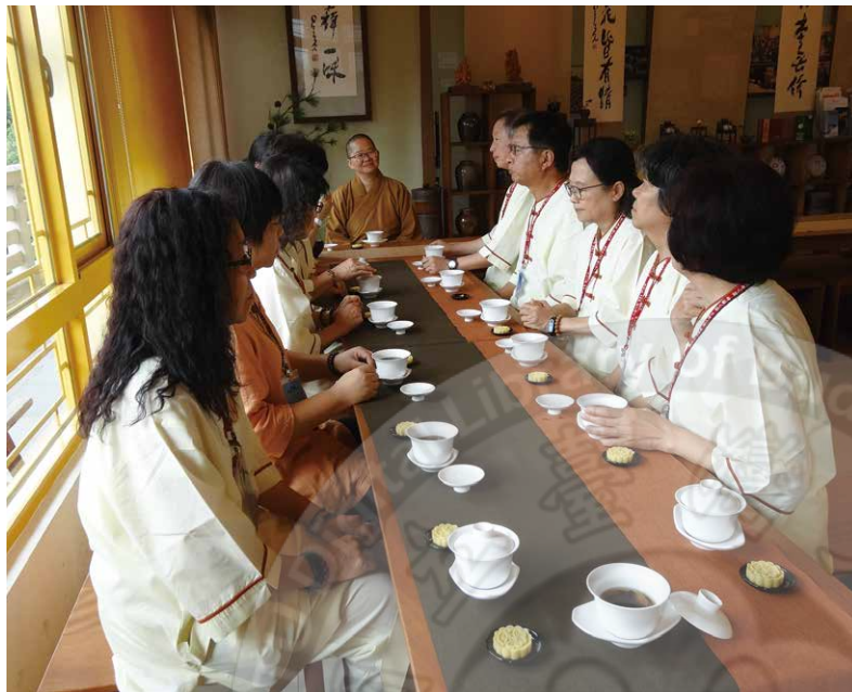
1969分會「心的旅程」體驗茶禪一味