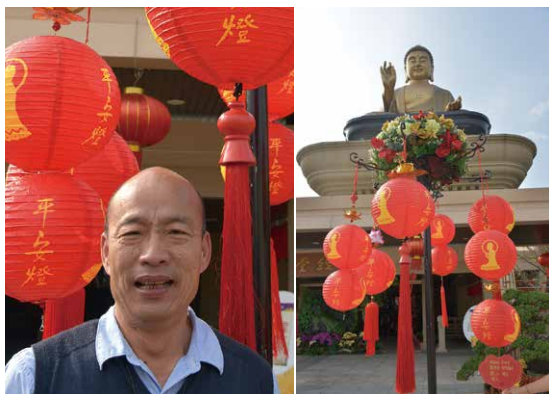
高雄市長韓國瑜與親筆簽名的紅燈籠合影

今年春節佛陀紀念館很不一樣，大門入口兩側佈置紅色大燈籠與星光燈，喜氣洋洋。夜晚燈光燦爛，一片燈海，如入佛國的景象，熱鬧非凡。走出禮敬大廳往成佛大道，8888顆燈籠呈現濃濃年味，其中「彩繪燈籠——畫一盞幸福平安燈」，由來自台中以南、高屏地區各級學校師生共同響應，尤以雲林縣石榴國小、高雄市中山國小、普門中學參與度很高，集體創作而成的創意彩繪的燈籠，有各式各樣可愛的圖案，繽紛多彩的顏色，也有民俗或工筆畫的造型，相當引人注目，元宵節前更有一顆高雄市韓國瑜市長親筆簽名，成了紀念性的紅燈籠高高掛。