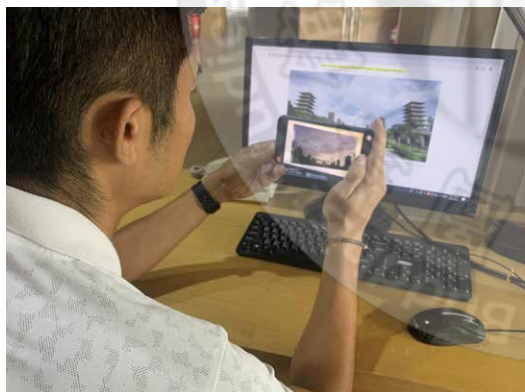
Buddha Museum AR

In April this year, Buddha Museum has partnered with Google Arts & Culture and launched an online exhibit. Online visitors can take a virtual tour of Buddha Museum and visit some of its exhibitions with Google Street View, and more than 130 images and videos are shown on the websites. Besides Buddha Museum Google Arts & Culture, there are also AR videos and audio tours available on the official website of the museum. By using the AR app of Buddha Museum with a smart phone, online users can easily scan the photo to see an introductory video of the place on their own device. In addition, the Buddha Museum launched a new 360-degree VR online tour of the exhibition "Buddhist Treasures from Shanghai Museum", whereby 284 pieces of rare archeological discoveries are put on display.