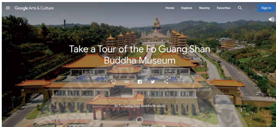
Buddha Museum Google Arts & Culture

◎文／Carly Straughan