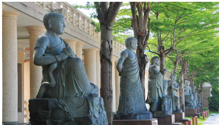
佛館菩提廣場十八羅漢

台灣國寶雕刻大師吳榮賜本土藝術很強，但中外人士都看見其深厚的人文素養與藝術之光。他所雕刻的佛、菩薩、護法像，透過千錘百鍊的藝術生命，爐火純青的刀工，徹底展現神準精湛的作品。