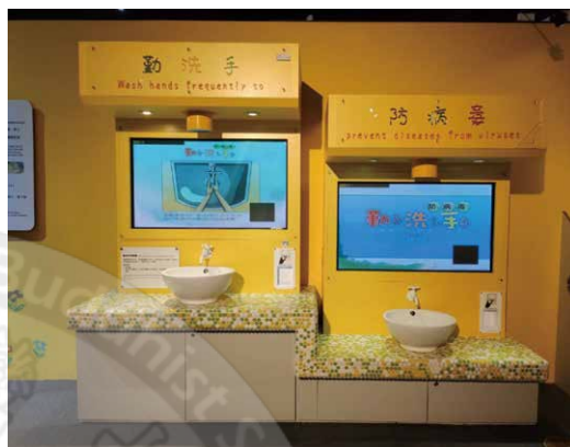
勤洗手防病毒互動體驗

本區主題意象為風調雨順、國泰民安為題之「廟宇」，以求籤方式用來了解疏散避難知識。此外，作為特展的尾聲，體驗民眾完成了所有關卡，能於此區進行體驗結算工作。