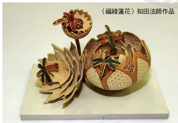
〈福祿蓮花〉知田法師作品