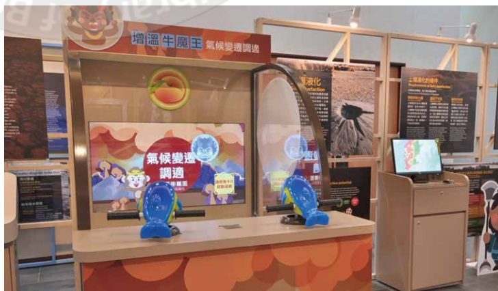
氣候變遷調適體驗(牛魔王單元)