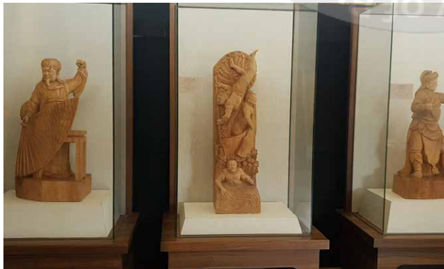
人物雕刻展示-雙閣樓三樓駐館藝術家工作室

木頭屑，風一吹就散」，那段落魄的日子，促使他改變自己，翻轉人生。在他三十一歲時，人生又有巨大的突破，遇到伯樂漢寶德的賞識，開啟他從「匠」到「藝」，通往藝術界的大門。1986年第一次的木雕個展，獨創「波紋」刀法，頓然呈現出時間與空間的流動，從此他的作品樹立起獨特的雕刻藝術風格。