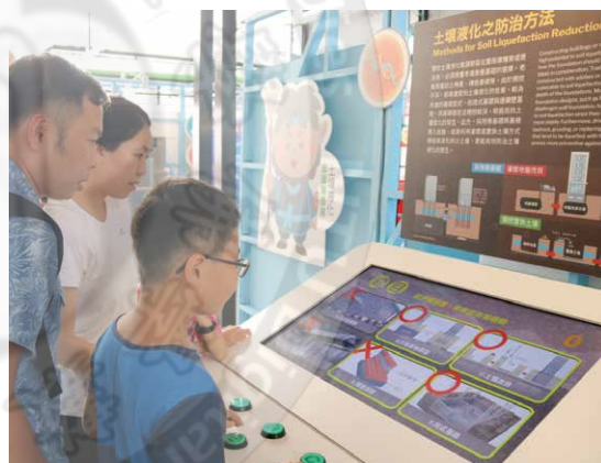
土壤液化防治演示

本區主題為有用的疏散避難之防災知識，介紹個人、家庭與社區之防災方法。除了利用圖文展板介紹之外，本區還有堆沙包體驗單元供民眾自主學習。互動單元包含疏散避難腳踏車學習單元以及勤洗手防病毒互動體驗學習單元。