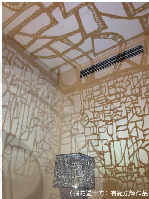
〈彌陀遍十方〉有紀法師作品