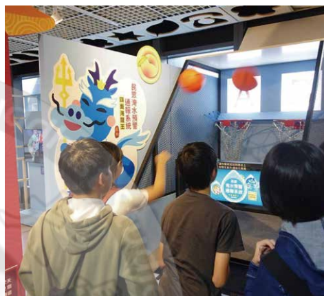
自動化淹水辨識系統展示（海龍王單元）

本區主題介紹我國各部會開發之災防科技監測技術。透過互動連線系統結合大型互動單元「過十關」，以寓教於樂方式進行整體全面之災防科技學習。