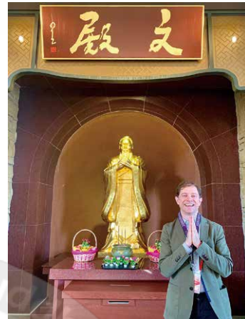
Professor Holloway poses with Confucius

The first thing I noticed was the diversity of those who attended. There were elderly members, which I expected, but also teenagers, including some with tattoos and piercings, and families with young children. It was beautiful to see people from different walks of life coming together to pray for peace. The prayer ceremony began around 2:00 pm, and that was when I realized just how special the day would be. Statues representing thousands of temples were all lined up together on altars, under a giant seated Buddha.