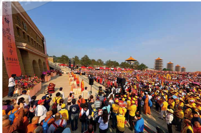
Representatives of diverse religions come together in prayer for world peace

Religion has been an increasing source of conflict around the world, particularly between 1945 and 2001, according to a 2004 study by Dr. Jonathan Fox. It is not that religion is the only source of conflict, but in the last decades of the twentieth century, it has become a