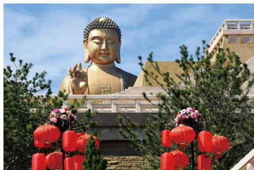
新春在佛陀面前祈願自己種下善美的種子吧

第三、施與肥沃的養份：花草樹木，因為施肥，而開出美麗的花朵；我們的身體，有了飲食的補充及適當的休息，就能健康運作。相同的，我們的心，也需要施與勤勞、發心、慈悲、忍耐等種種良善的養份，才會有豐碩的成果。好比想擁有聰穎、通達、靈巧，必須施與智慧、明理、判斷；祈願人緣有所收成，就必須主動、結緣、關懷，人際之間就能自在、順利。