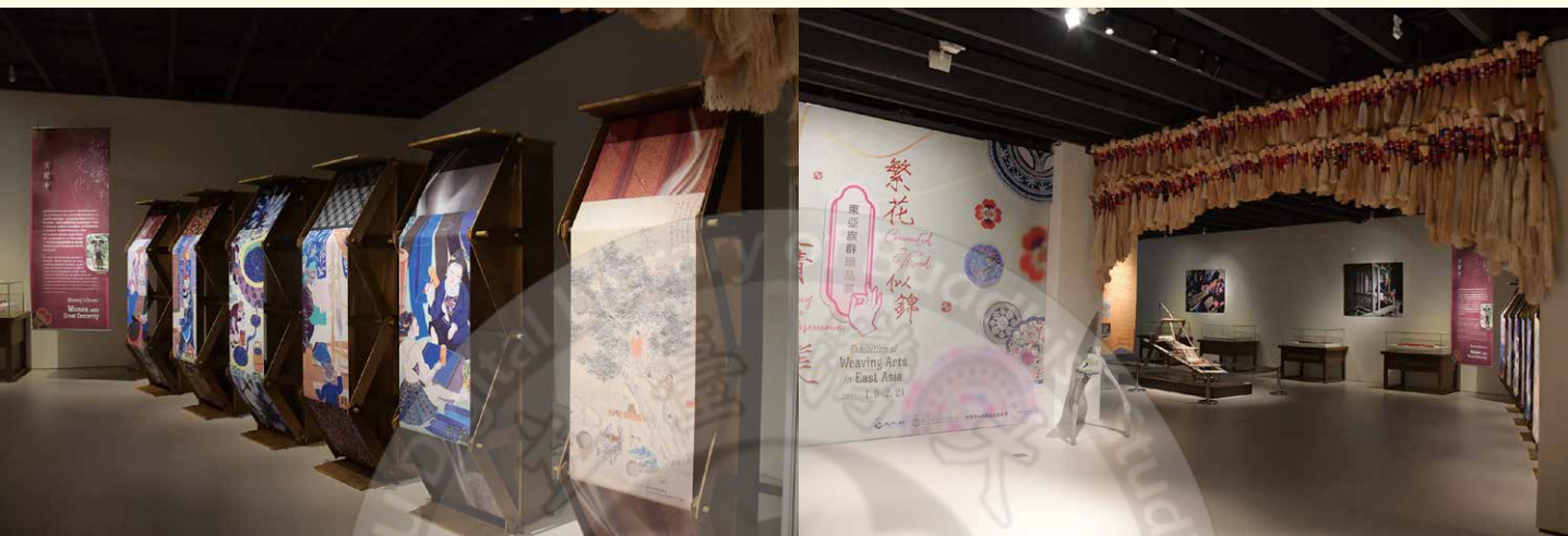
繁花似錦・人情之美—東亞族群織品展