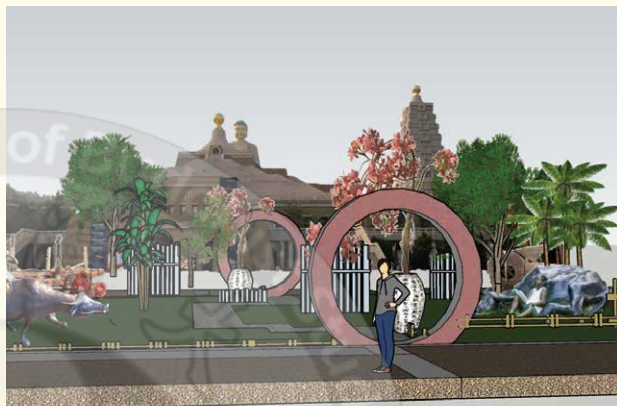
花開四季耕耘心田 牛年裝置藝術-示意圖