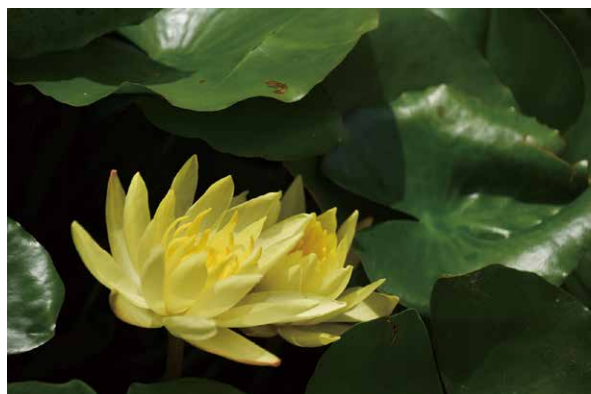
性地常開智慧花，要如池中蓮花之清淨無染

第二、灌溉懺悔的法水：衣服髒了，經過清洗，才能穿得舒服；身體污垢，也要沐浴，才能神清氣爽；環境汙穢，必須打掃，才能住得舒適。我們的心受到汙染，要以懺悔的法水洗滌，心地才能清明。《佛說未曾有因緣經》云：「前心作惡，如雲覆月；後心起善，如炬消闇。」犯錯不可恥，懂得懺悔改過，就能為自己找出一條光明大道。