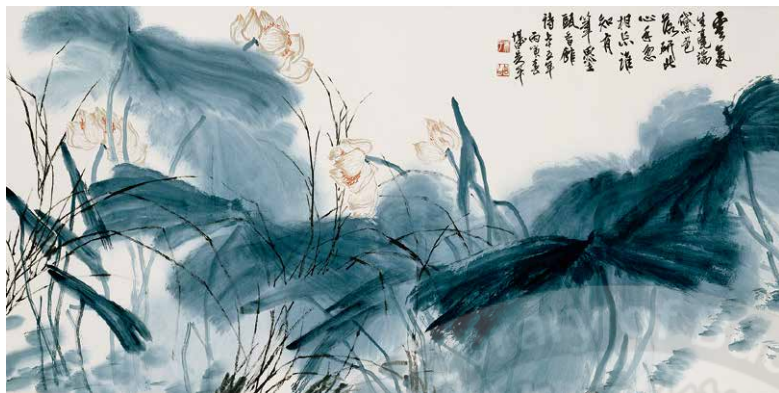
金石風格-吳平 花卉-國立歷史博物館典藏

一大千」之封號。大千先生識見深廣，為人豪邁，畫作呈現出一種磅礴之氣，詩、書、畫、金石並進，終能自成一格。潑墨原是中國畫的技法之一，須大筆飽飲水墨，以高速度落紙，一氣呵成。