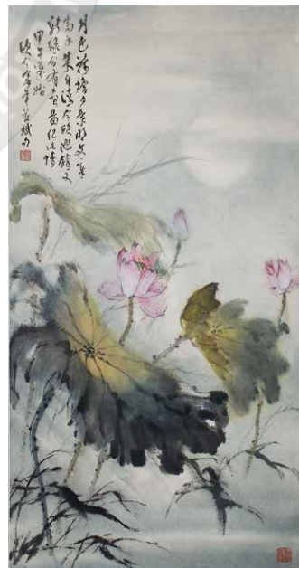
嶺南風光-歐豪年 荷塘月色 歐豪年文化基金會典藏