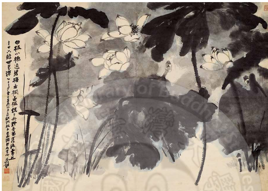
大千風采-張大千 墨荷-國立歷史博物館典藏

國立歷史博物館與佛光山佛陀紀念館，長期以來合作辦理多次重要展覽，以博物館美學教育推廣回饋社會大眾。在此全球心靈艱困的後疫情時代，兩館再次攜手，並邀請輔仁大學博物館所協力策劃，以豐富的荷花主題典藏作品於佛陀紀念館展出，為兩館合作再創新的里程與意義。5月18日開幕時，兩館將二度簽署友好博物館，也成為佛館十周年慶之始。