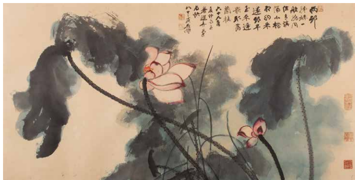
大千風采-張大千 荷花-佛光山典藏

張大千先生從小學畫及書畫鑑賞，年輕時昆仲於上海成立畫齋「大風堂」。大千先生長年吸取各家之長進而融合一體，在畫壇素有「五百年來