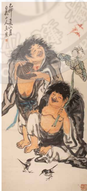
金石風格-王震 和合二仙 佛光山典藏

近代的中國水墨畫不斷求新求變，廣東嶺南地區的畫家們引西潤中、深入生活、重視寫生，因地域關係名為