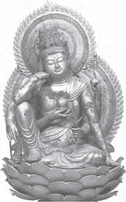
如意輪觀音菩薩坐像