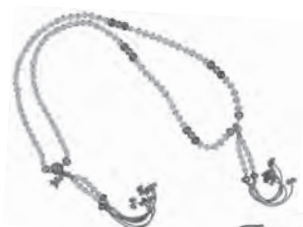
金念珠與飛行三鈷杵