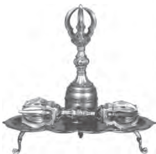
東寺所藏之密教法具