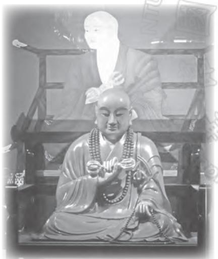
位於成都路天后宮裡的空海像

迦陵頻伽蒔繪冊子箱」、「蘇悉地儀軌契印圖」，大阪觀心寺的「觀心寺緣起資財帳」；以及「千手觀音菩薩立像」、「蓮華虛空藏菩薩坐像」、「業用虛空藏菩薩坐像」、「法界虛空菩薩坐像」、「如意輪觀音菩薩坐像」、「五大明王像」等。