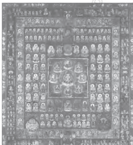
上：真言七祖像之一——不空金剛 下：兩界曼荼羅圖（西院）之一——胎藏界