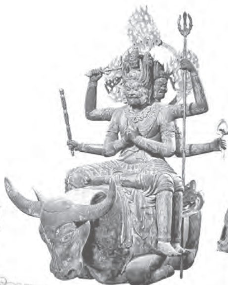
大威德明王騎牛像