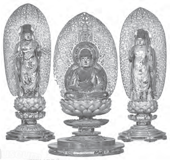
阿彌陀如來與兩脇侍像