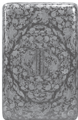
寶相華迦陵頻伽詩繪冊子箱

卷」、「兜跋毗沙門天立像」、「金念珠」、「三鈷杵」、「密教法器」、「板雕兩界曼荼羅」、「諸尊佛龕」、「釋迦如來與諸尊佛龕」等等，大部分屬於唐物。