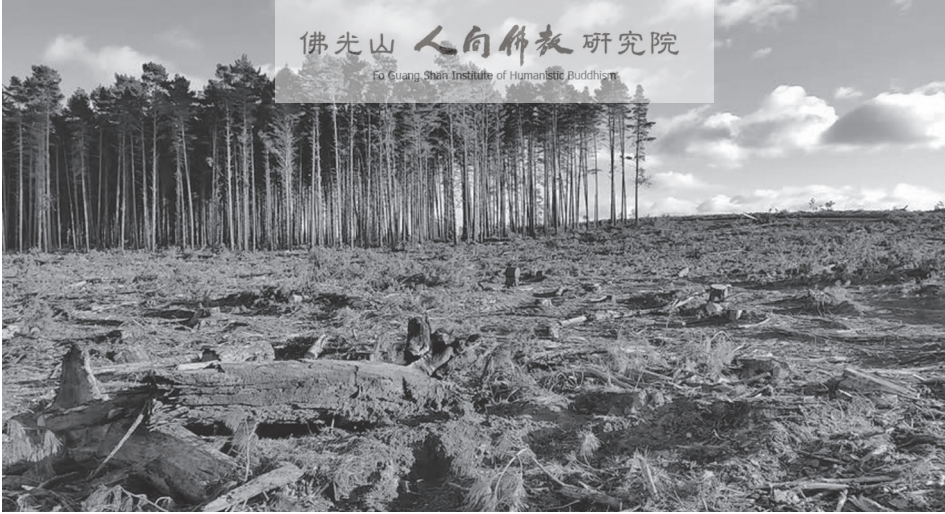
濫墾濫伐，嚴重破壞自然生態。

該像愛護有情眾生一樣愛護草木土石了。中國佛寺素有育林護山、綠化環境的優良傳統，至今尚可見寺院多是林木扶疏、景色可人，不少僧尼被政府部門評為護林育林模範。