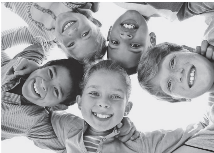
一切眾生在漫長生死輪迴中，彼此都可能曾為父母妻子眷屬。