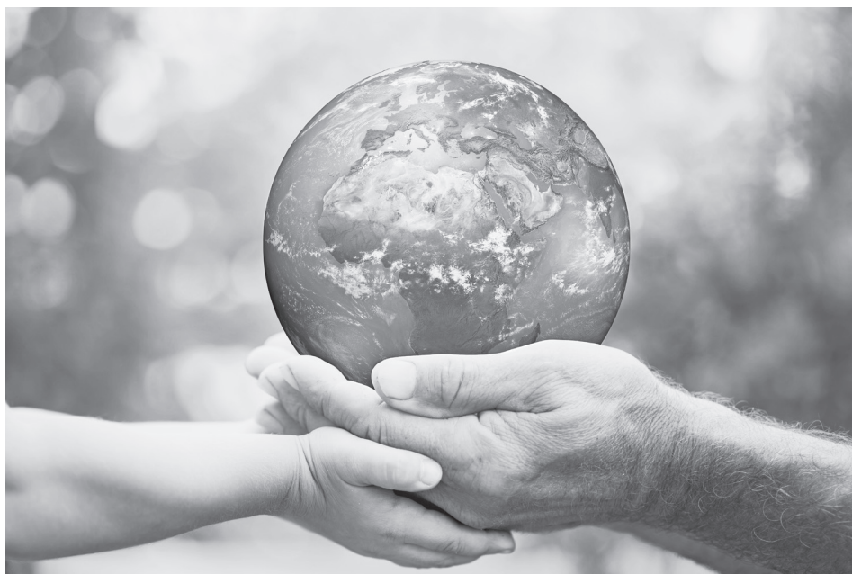
大家一起來守護美麗的地球！

在精神文明建設方面，佛法不僅有依正不二、心淨土淨等理論，而且有其價值觀念、行為規範和三學六度等淨化人心、莊嚴國土的操作技術，最為寶貴的是其作為佛法心要的「諸法無我」的智慧。這種智慧專治各種社會問題、精神疾病的根荖——以假我為中心的個人主義，這是佛法獨擅的特效藥方。以此藥廣施社會，再加上其他有益於世道人心的各種文化營養的滋補，扶正祛邪、助陽驅陰，以精神文明領先，帶動物質文明，則國土莊嚴有希望早日實現。