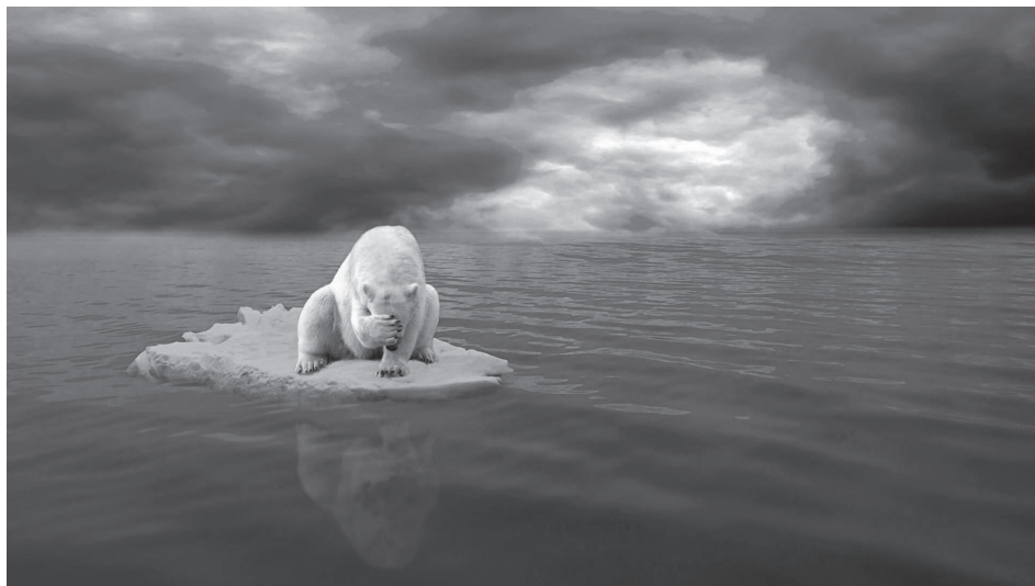
人類對生態環境造成的破壞，已危及其他物種的生存。