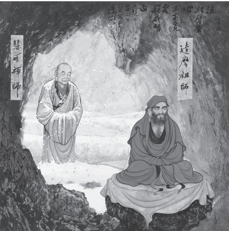
禪話禪畫。(高爾泰、蒲小雨/繪)

許多的禪師們，就這樣把一些參學者介紹到這裡、介紹到那裡，有機緣的就各有悟道因緣，可以說，過去尋師問道都不是那麼簡單。像「程門立雪」、「慧可斷臂」，六祖惠能去參學五祖弘忍，也要在舂米房裡舂米八個月；又好比雪竇禪師陸沉大眾之中，最後才得龍天推出。