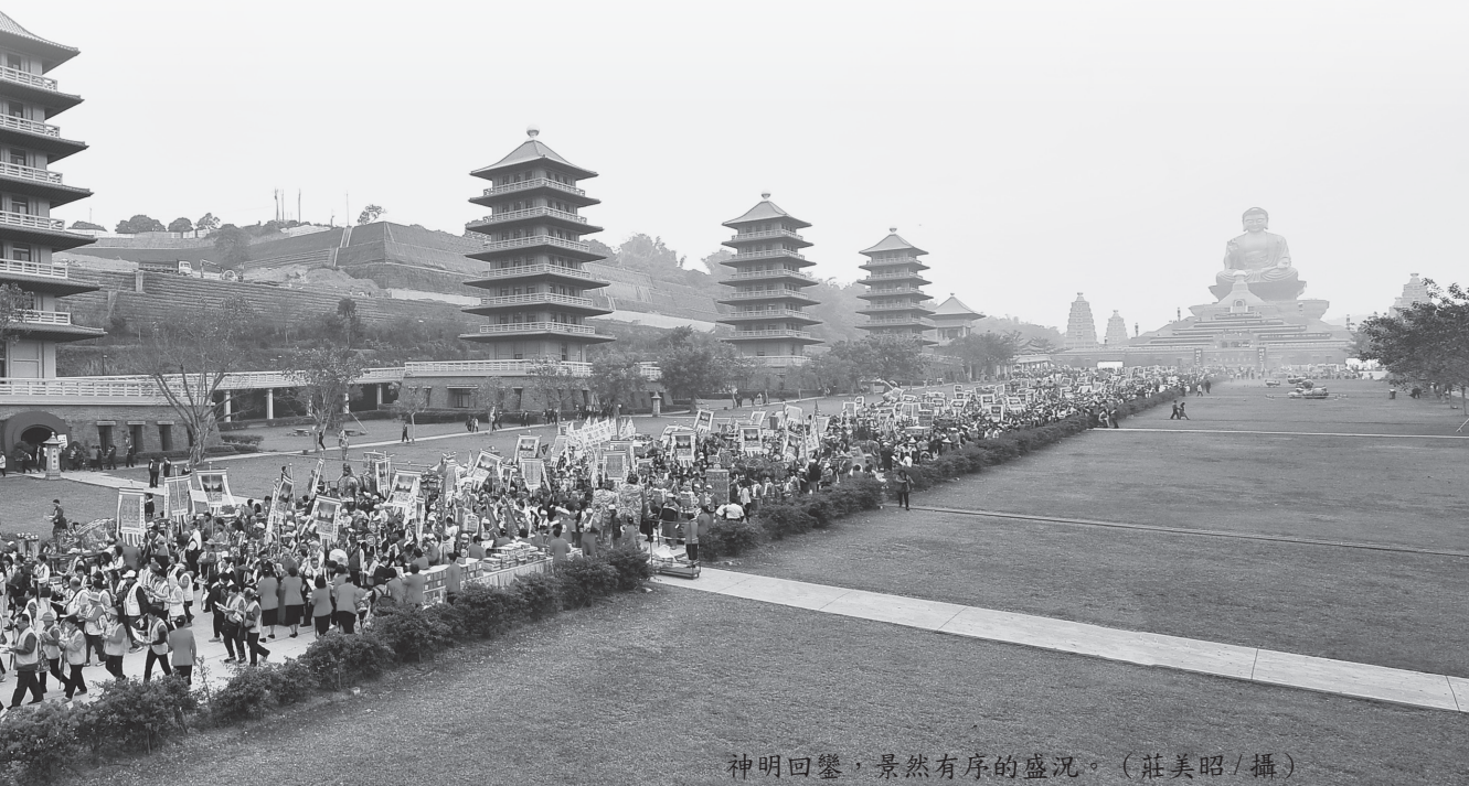
神明回鑾，景然有序的盛況。