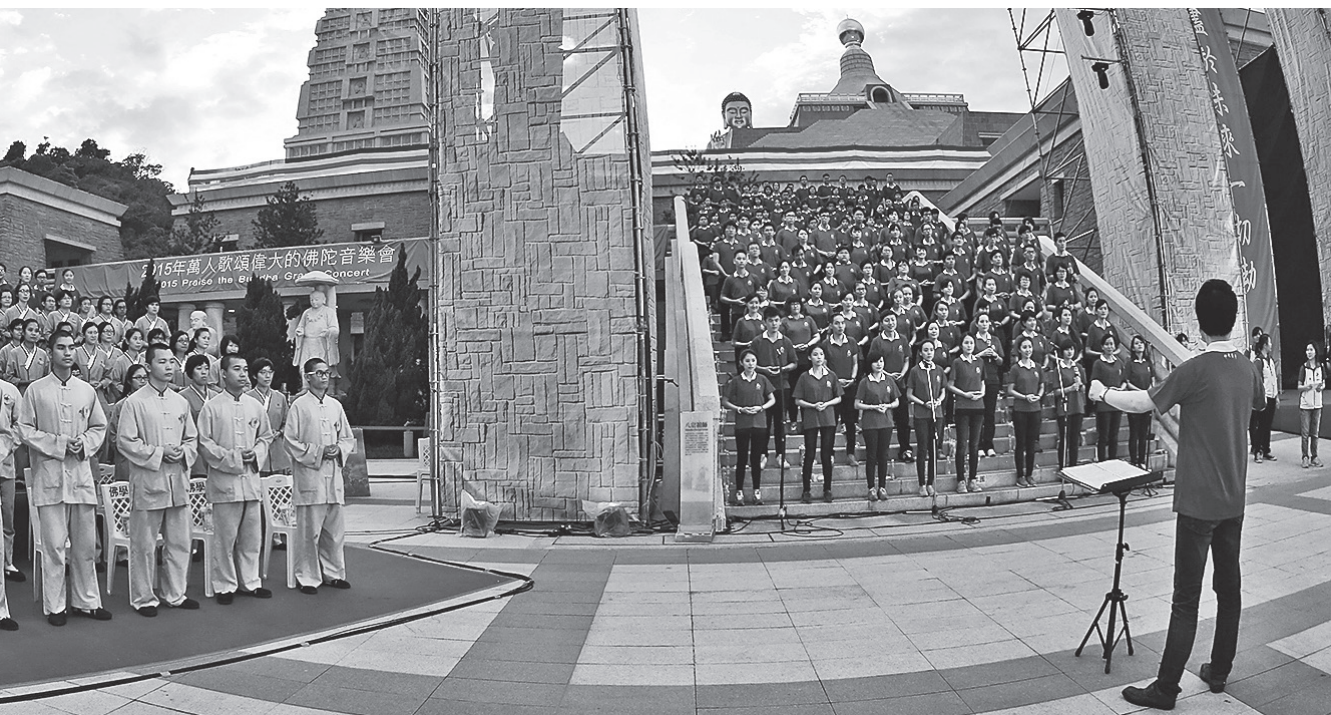
佛教青年唱出弘法的願心。

《普門品》裡，觀世音菩薩「應以何身得度者，即現何身而為說法」，就是人間佛教。人間佛教就是不捨一個眾生，不捨一個法門。所以我們提倡的人間佛教，就是多元化、多功能的弘化，就是依大家的根機需要，施設種種法門來實踐佛陀的「觀機逗教」，這就是人間佛教。 ——《人間佛教語錄》