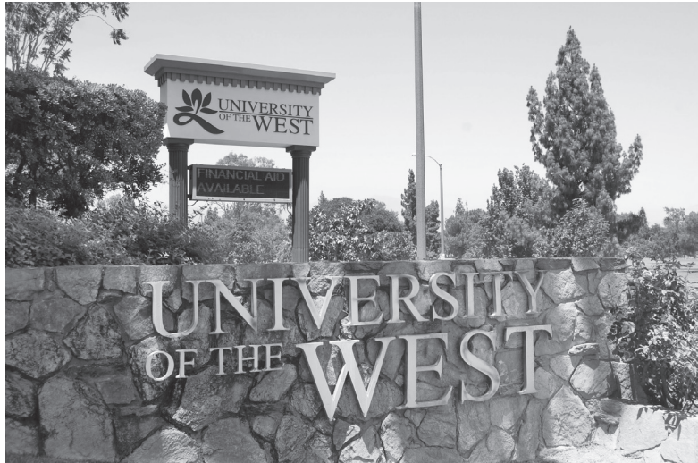
佛光山創立的美國西來大學

佛教其實是個重視般若智慧的宗教，佛教旨在弘揚教義。佛教認為開發般若智慧，才能分辨邪正真偽；斷除煩惱，才能自度度人，究竟解脫。二千多年前，佛陀不但自己了悟「緣起性空」的人生真諦而證悟成佛，並且留下千經萬