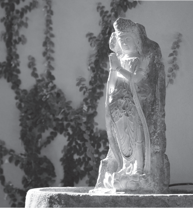
菩薩無緣大慈，同體大悲，以慈心悲願救度一切眾生。

困擾，感同身受，因此而生慈悲心，欲救眾生於諸般苦難。因此，慈悲心基於佛教認為人生本質為苦的理論預設，正是由於人們對世間之虛幻執著追求而無法自我解脫，才需要諸佛菩薩的慈悲心以為普濟。