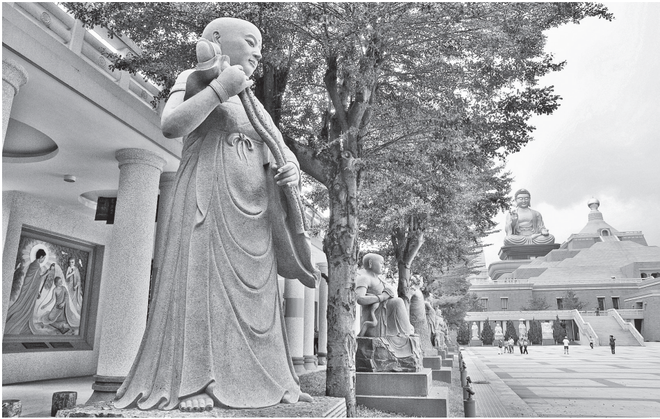
佛館十八羅漢中有三尊女羅漢，前一為蓮華色比丘尼，前二為妙賢比丘尼。

模糊並因此後來引起爭論的一個焦點是：在家居士能否證得羅漢？這與後來大乘佛教中，關於女性是否需要轉男身成佛的討論截然不同。星雲大師多年來一直提倡佛教四眾平等，特別關注女眾與在家信徒對於當今佛教發展做出的貢獻與重要的價值。十八羅漢本身是大乘化的信仰形態，在其中加入三尊女性羅漢，這既符合羅漢概念本有的突出性別平等的特點，又可以激發當今佛教界中潛存的巨大女性力量，是在遵循佛教傳統基礎上做出的適應時代變化的調整。