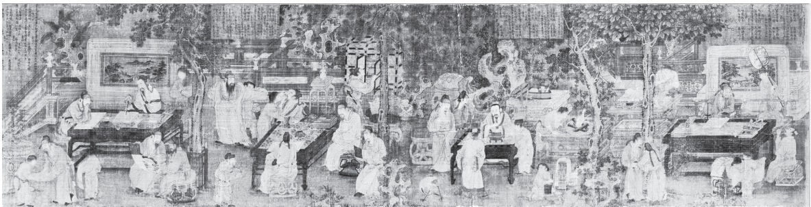
五代南唐周文矩所繪《十八學士圖》