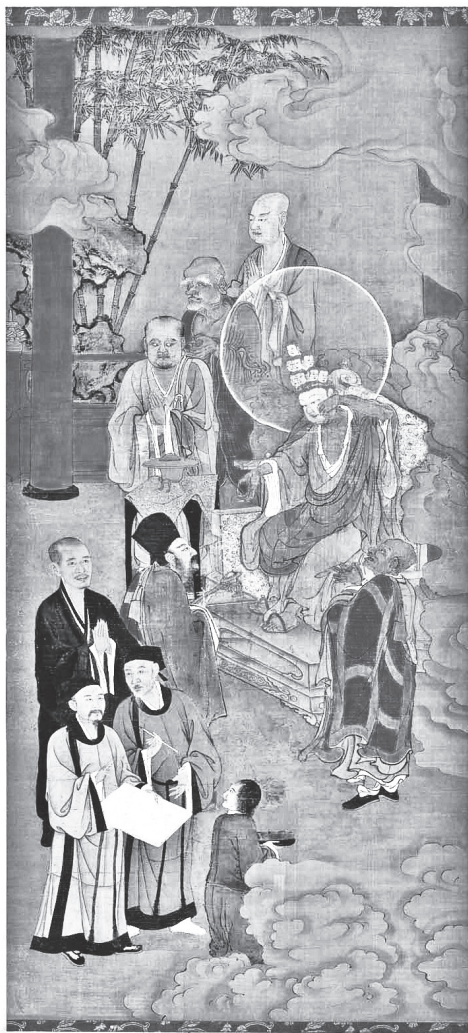
南宋周季常所繪《五百羅漢圖·應身觀音》，現藏於美國麻州波士頓美術館。

武帝是「住世四果聖人」。 23 而寶誌和尚作為梁武帝時期的神僧，雖然一直被看作十一面觀音的化身，但由於中國人信仰的雜糅特點，一個僧人往往既被認為是菩薩的顯化，又同時被看作是羅漢的化身。由南宋明州（今寧波）畫工所作《大德寺五百羅漢圖》中，有一幅「應身觀音」（現藏美國波士頓美術館），描繪張僧繇為寶誌作像，而寶誌現多面觀音像的情景，這裡又把他吸納到五百羅漢隊伍當中，寶誌又有了一重羅漢的身分。由此來看，梁武帝與寶誌進入十八羅漢的隊伍並非毫無典據。