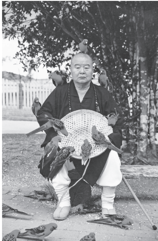
十幾隻鸚鵡棲息在星雲大師身上，其中一隻還站在頭頂，雖然爪子抓著頭很疼，但大師深怕牠受驚嚇，動也不敢動。