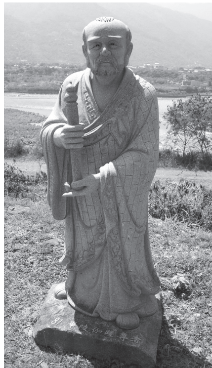
畢陵迦婆蹉雖已是阿羅漢，但因五百世習氣所致，仍難改惡口。

惡習難改，我們更要精進的修行。經中寫道：「菩薩有一法，能斷一切諸惡道苦。謂於晝夜，常念、思惟、觀察善法，令諸善法，