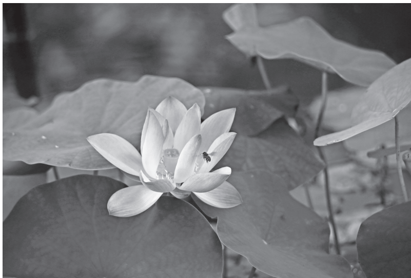
每個人都具有清淨心，只是隨著年紀的增長、環境的影響，才逐漸沾染汙點。

古人說「善心莫善於寡欲」，能知足就能安貧樂道。如顏回的「居陋巷，一簞食，一瓢飲」；大迦葉在山林水邊、塚間，安然過著頭陀苦行的生活；唐朝法常禪師，他以荷葉為衣，松子為食，依然自得其樂；弘一大師一生勤儉，飲食簡單，用具破爛，也不以為苦……他們知足淡泊，以無為有，以空為樂，財物在他們心中，恐怕如浮雲、如敝屣吧！不過，佛教並沒有排斥財富，只是強調「君子愛財，取之有道」。