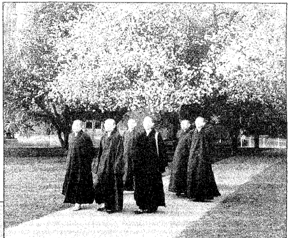
師法諦見視探美赴(一左)師法因悟長院學佛家尼光香。園校大華觀象,時(三右)