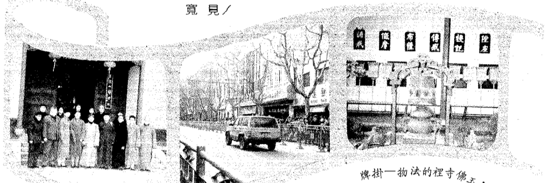
佛五寺裡的法一物掛牌