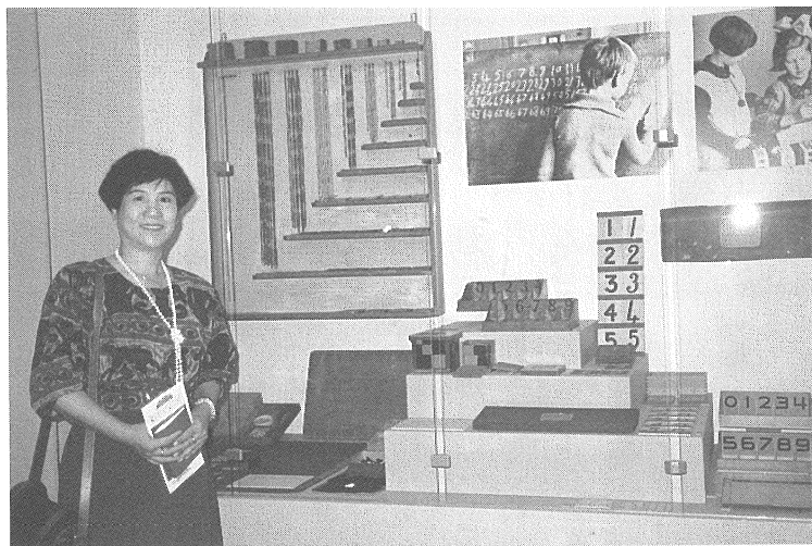
◎參加研習活動是老師進修的管道之一。(圖為荷蘭蒙特梭利館內的算數教具)