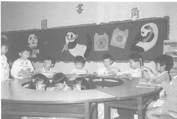
◎孩子們在書中探索生命，認識世界。

在馬路上亂闖，到了商店又因為老闆正在吃早餐，空手折回。沒去「行」，「知」總是有限。